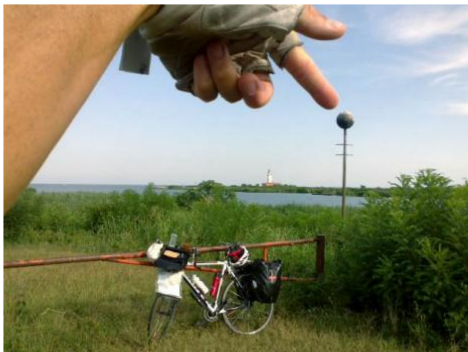
Ritrovare il punto nella foce.