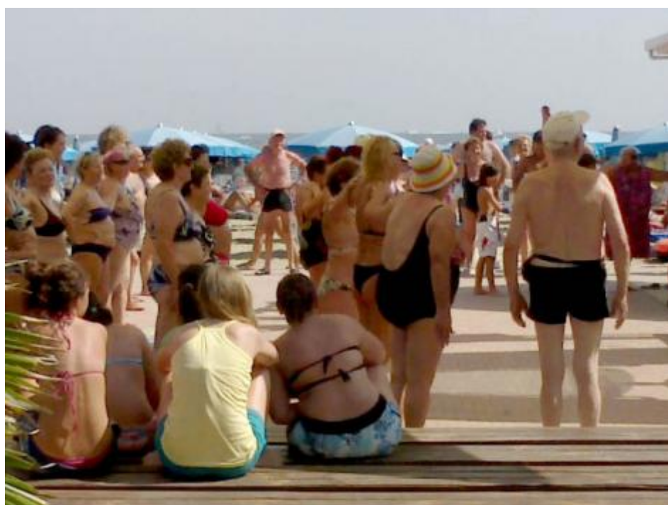
La riviera di mattina.