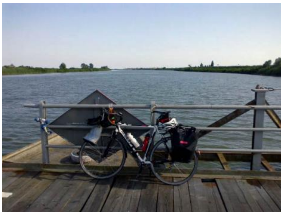
Tra la Romagna e il Veneto un ponte di barche.