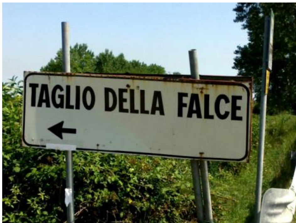
Taglio della falce.