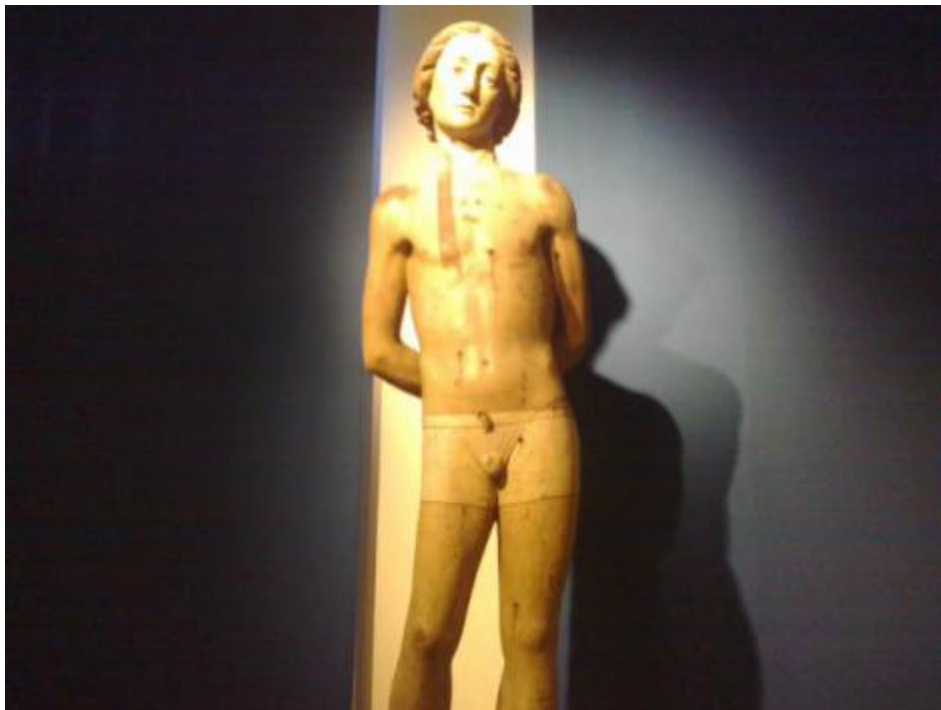
A Fermo i boxer di San Sebastiano.