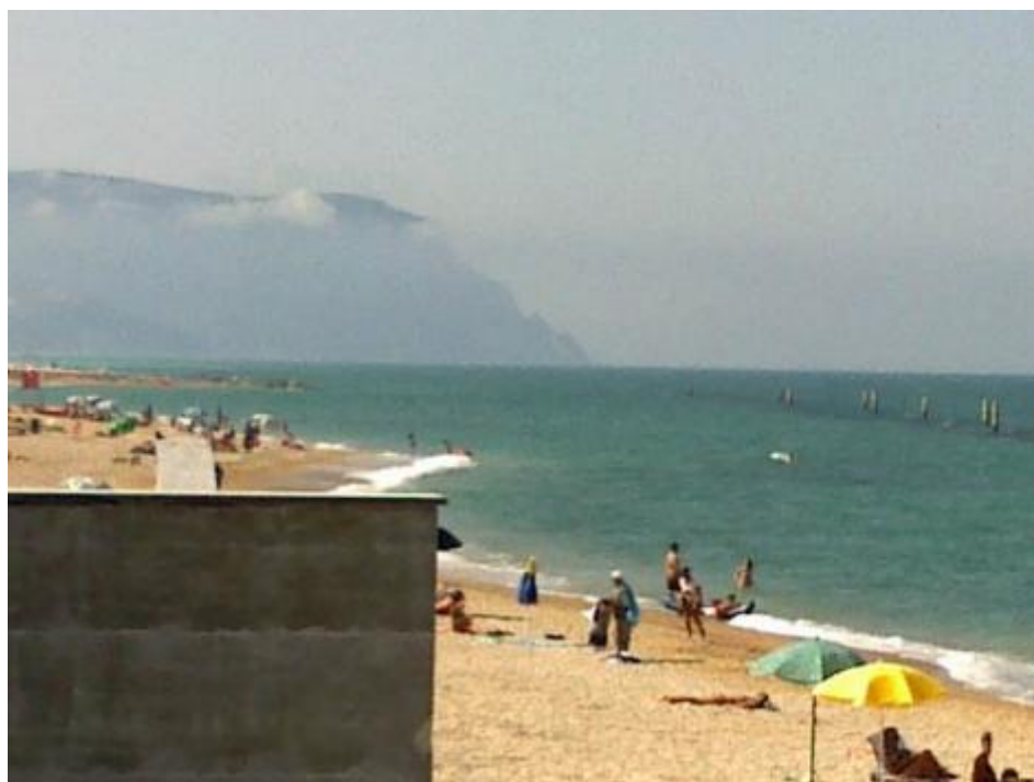
Il Conero dietro a un muro.