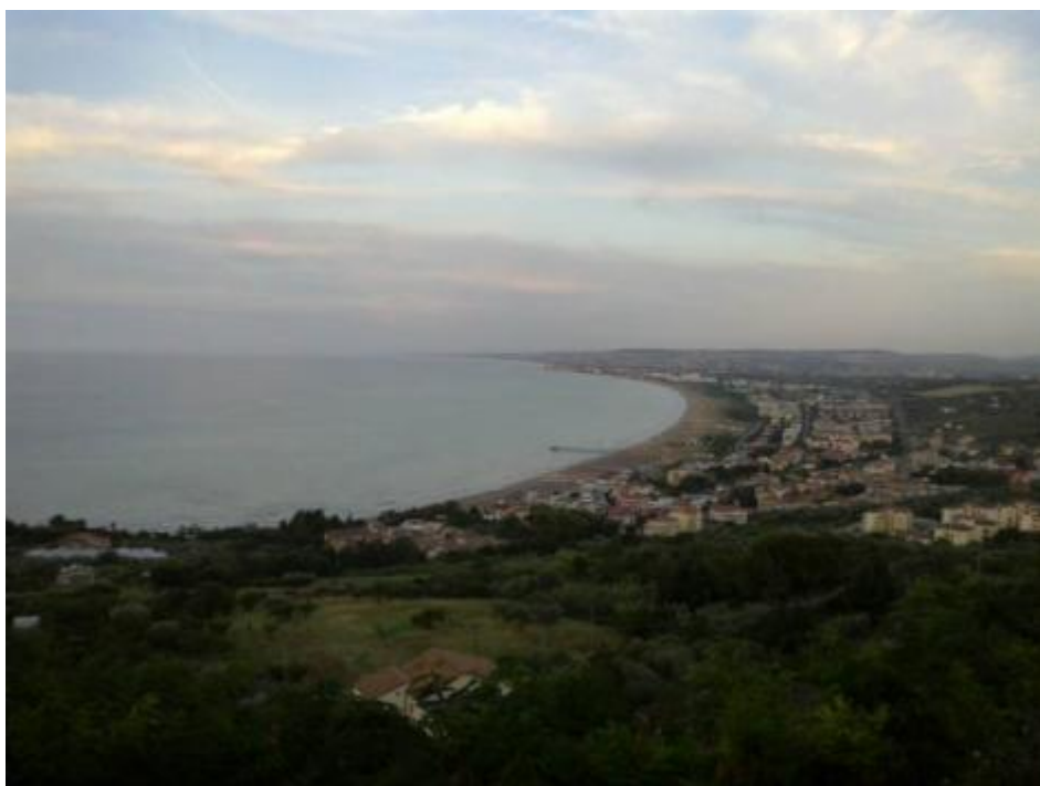
Fermo. E mi fermo.