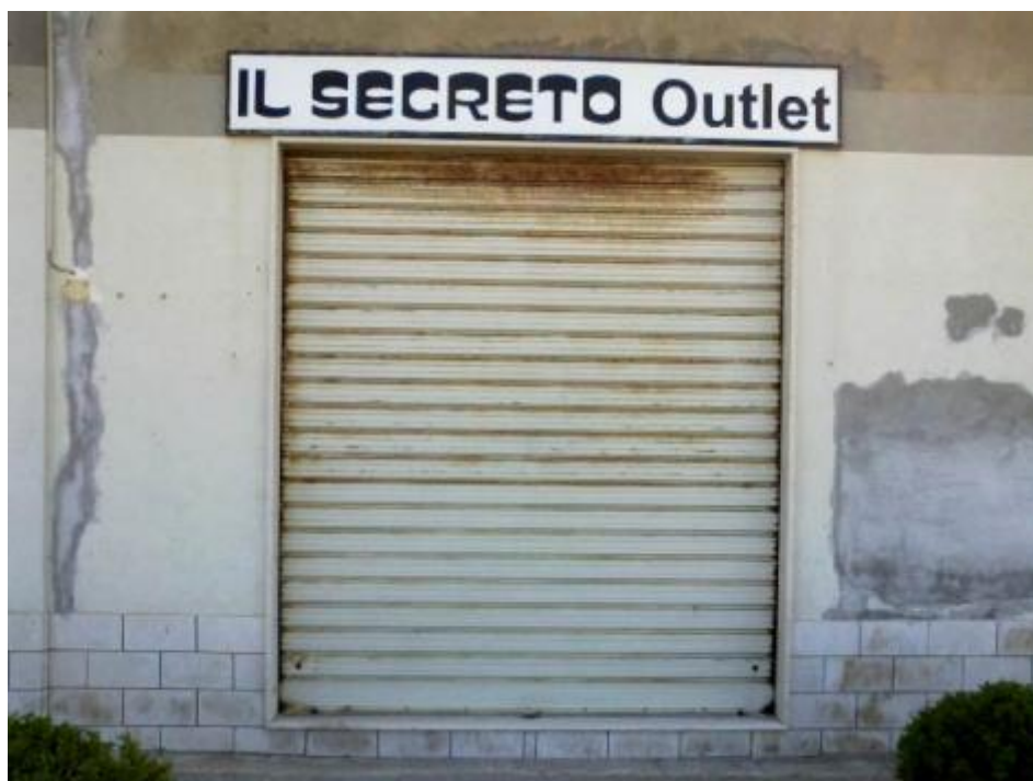
Il segreto di Riva Verde.