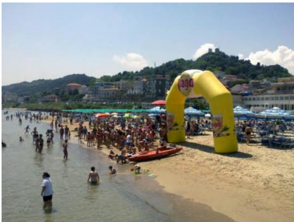
Calypso al Lido