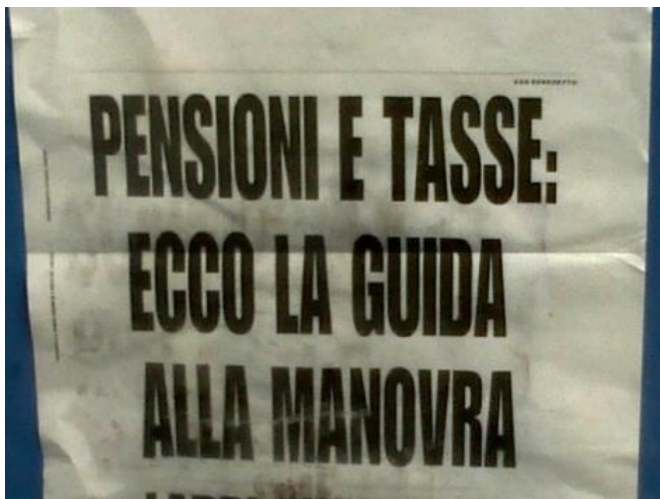
Ecco la guida