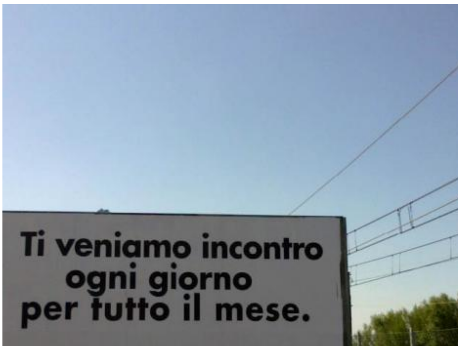
Ogni giorno per tutto il mese