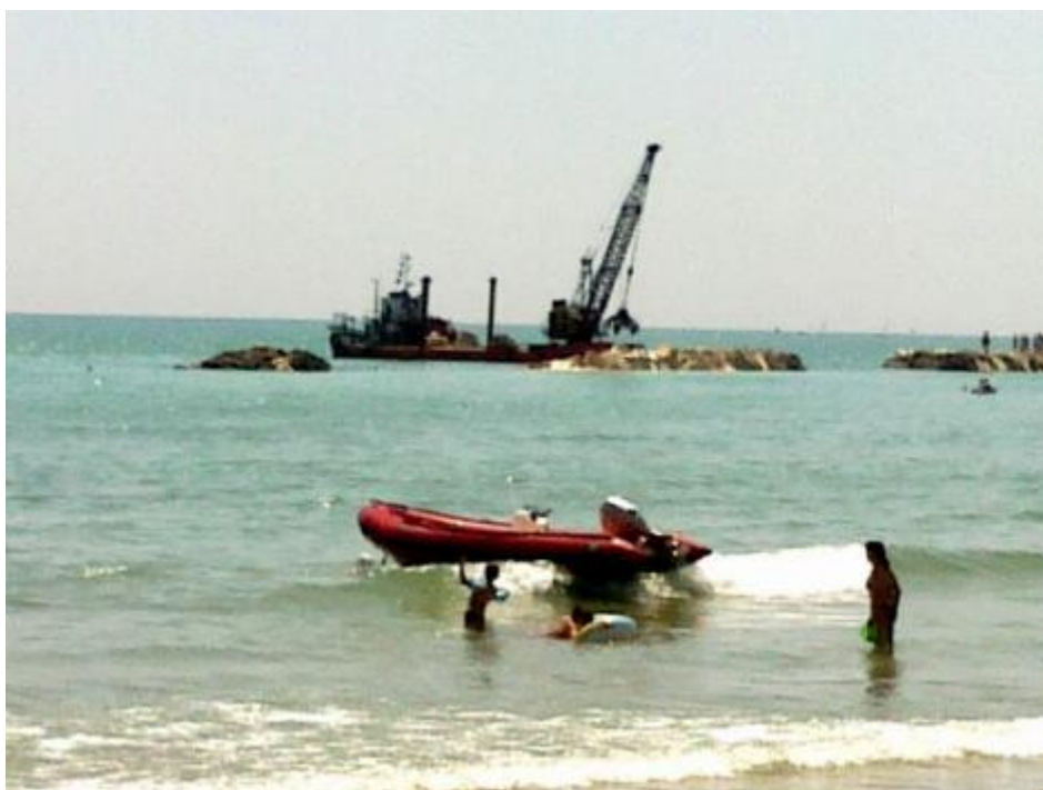
Orizzonte in costruzione