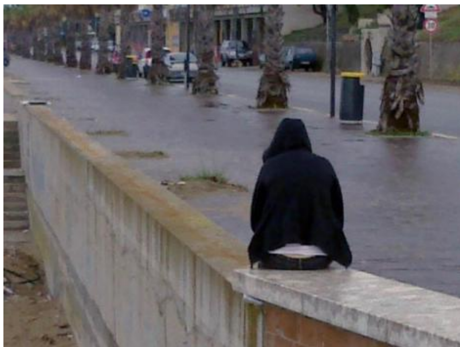
La malinconia a Termoli