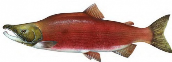
Umberto Eco Come viaggiare con un salmone