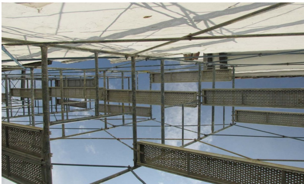
Opere di Kwasi Ohene-Ayeh.