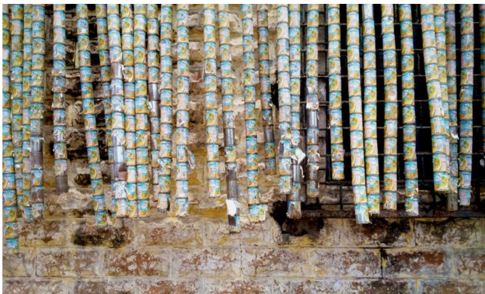
Opere di Kwame Asante Agyare.