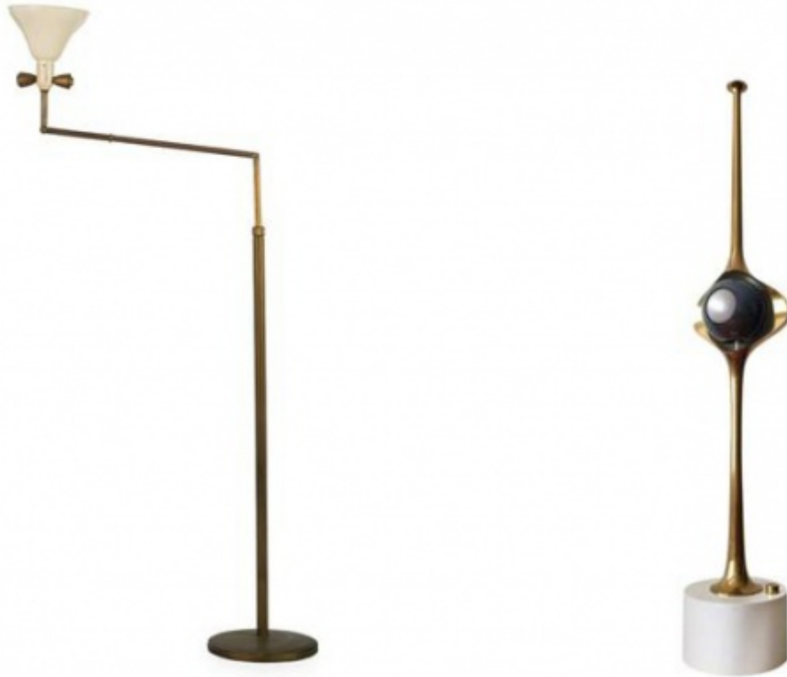
Angelo Lelii, Lampada Tris (1946) e lampada Cobra (1965).

L'anno successivo la ditta monzese, che intanto aveva assunto il nome di Arredoluce, partecipa all'VIII Triennale (quella di Piero Bottoni e del suo QT8) con la lampada (mod. 12128) che sarà conosciuta nel mondo con lo stesso nome della rassegna milanese.