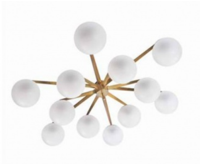
Angelo Lelii, Lampada Triennale (1947) e lampadario Stella (1950).