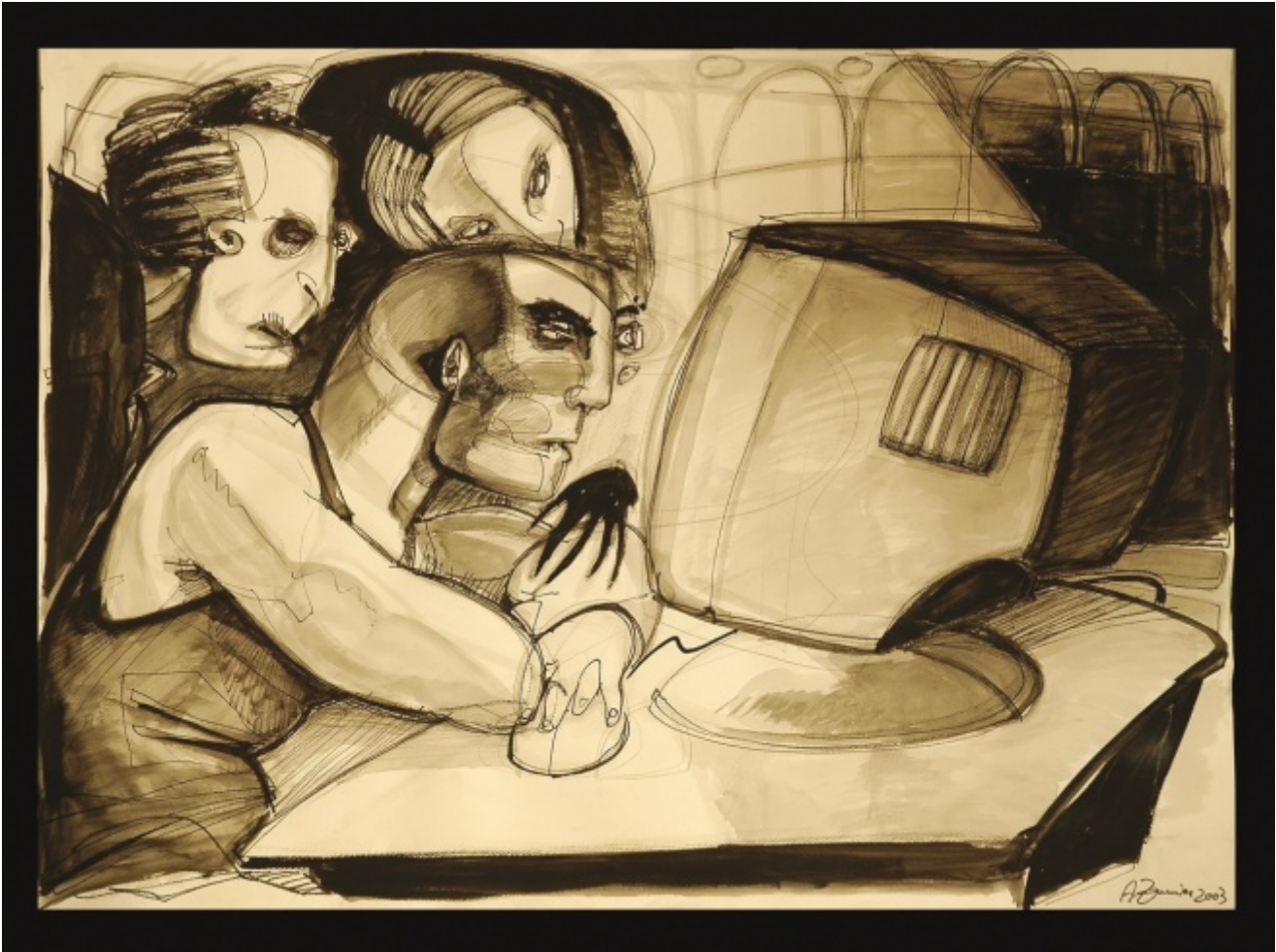
A. Zannier, I cospiratori .

parte dei “poteri forti”, politici economici e culturali; quella di destra vede la storia attuale come effetto di cospirazioni delle “sinistre” per dominare il mondo moderno. Il cospiratore è sempre “l’altro”, il proprio successo è invece sempre “autentico”.