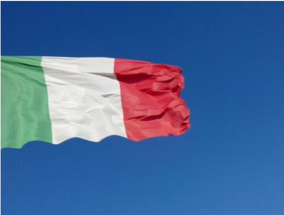
Santa Maria di Leuca. De finibus terrae