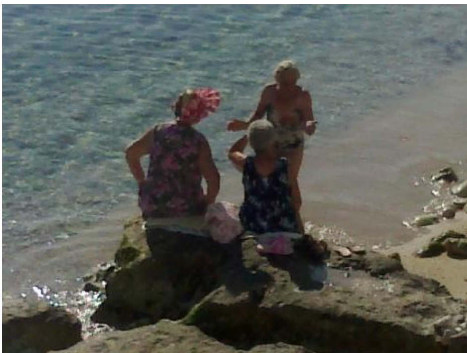
Care signore di Monopoli