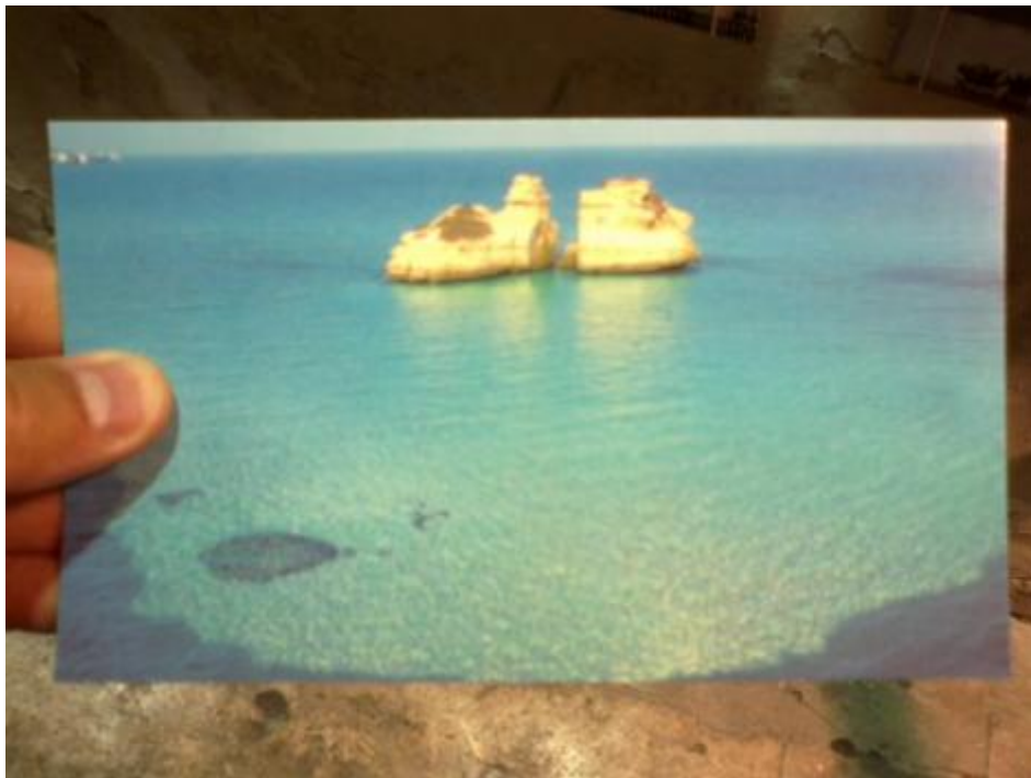
Due sorelle a Melendugno