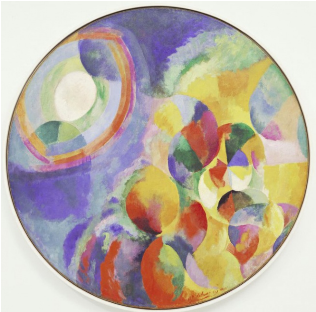
Robert Delaunay, Contrasti Simultanei, Sole, Luna, 1913

Il termine 'qualità terziarie' risale addirittura a John Locke. La sua classificazione parte dalle qualità primarie, le qualità inseparabili dai corpi: la solidità, l'estensione, la figura, il numero, il movimento e la quiete; esse sono calcolabili, oggettive e rendono possibile la scienza matematica della natura, la fisica di Galileo e Newton. Le qualità secondarie sono invece quelle percepibili da un solo organo di senso: il sapore, l'odore e, appunto, il colore; sono soggettive e quindi escluse dalla trattazione scientifica, a meno che non se ne trovi un aspetto misurabile. Il che in effetti avvenne con l'esperimento newtoniano della scomposizione della luce attraverso lo spettro, ciò che permise a Newton di legare i diversi colori alla diversa velocità delle particelle che la compongono.