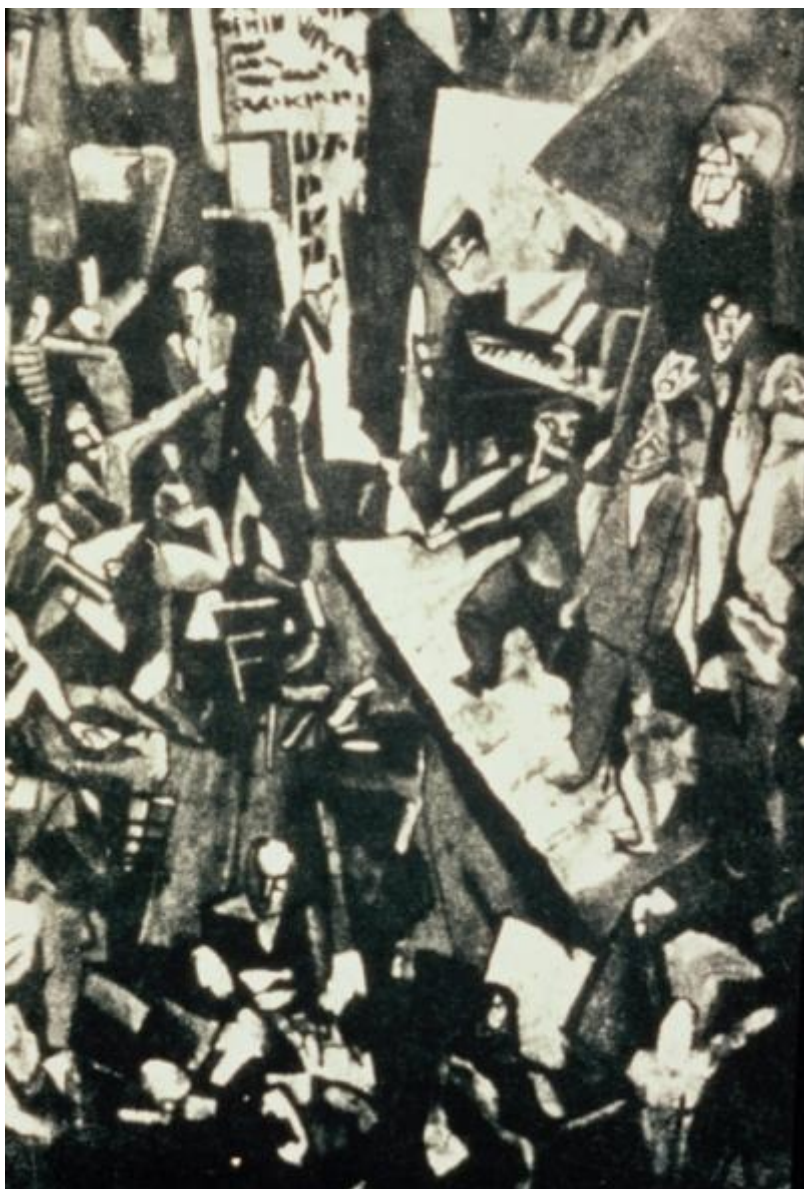
Janco, Cabaret Voltaire

Il nome del Cabaret è un omaggio, un riferimento all'autore del Candide , una delle più sagaci e impietose denunce della stupidità umana. Sempre nel diario di Ball c'è una dichiarazione sintetica che suona proprio: "Gli ideali artistici e culturali come programma di un varietà: ecco la nostra maniera di presentare Candide in contrasto con i nostri tempi".