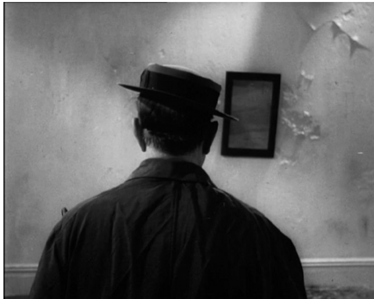
Da sinistra: Immagine pubblicitaria (1927 ca.); "Film", di Alan Schneider (1965)

Berkeley o non Berkeley, la figura di Keaton vista di spalle possiede una indubbia forza iconica. Già nel 1927, in occasione del suo passaggio alla United Artists, viene diffusa un'immagine pubblicitaria che lo ritrae appunto di schiena. Prima ancora, nel 1917, era stato lo stesso attore, a debuttare in questo modo sul grande schermo, nel due rulli di Roscoe Arbuckle The Butcher Boy .