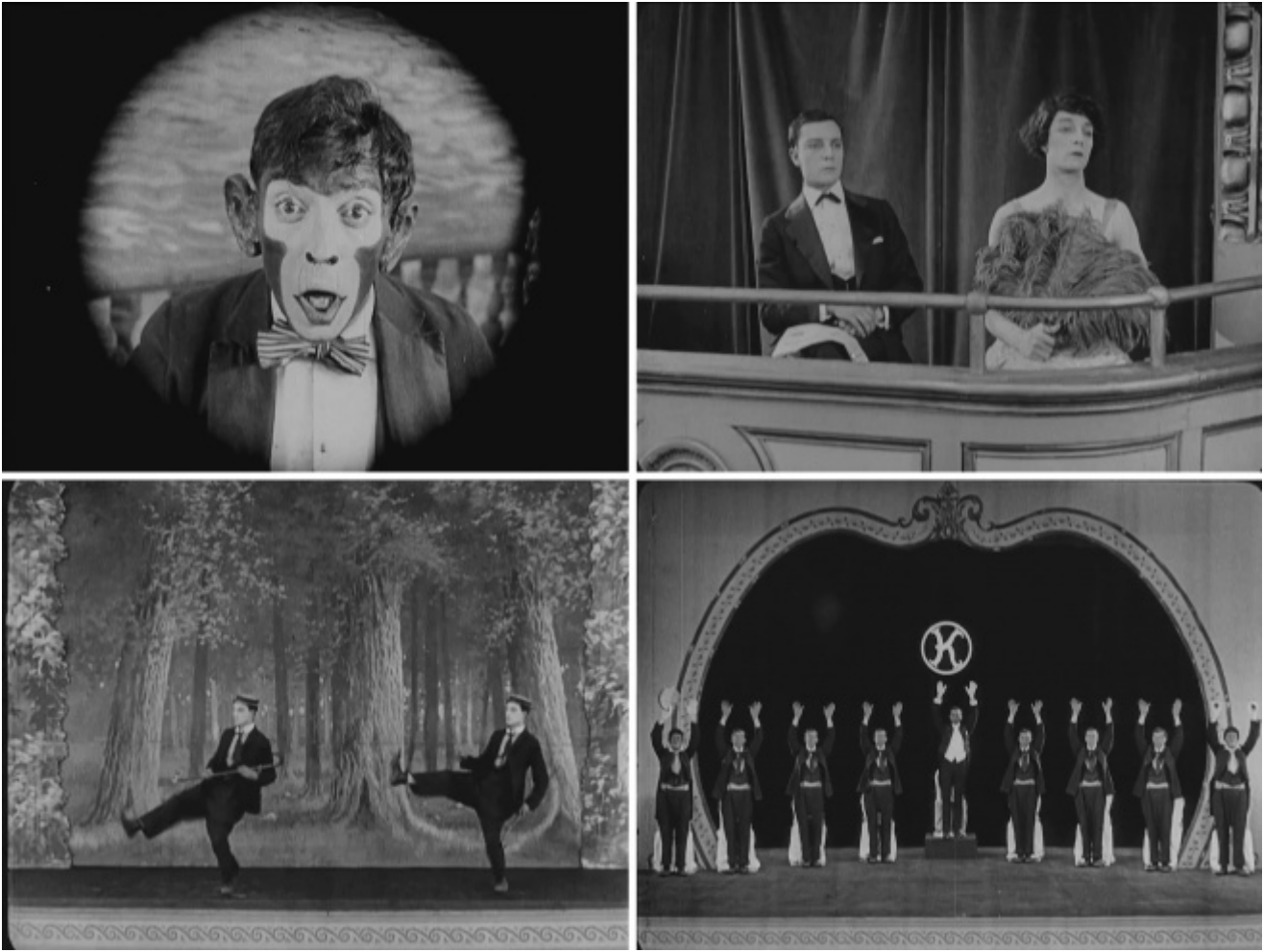
“The Playhouse” (1921)

d'altra parte non consisteva proprio in quello il suo essere “buster”, il fenomeno?