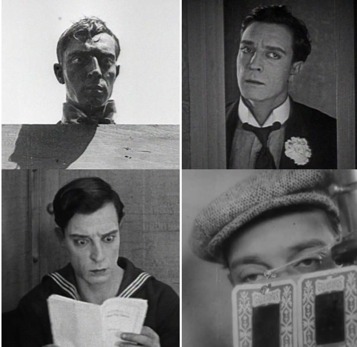
Dall'alto, da sinistra a destra: "Neighbors" (1920); "The Haunted House" (1921); "The Navigator" (1924); "The Cameraman" (1928)