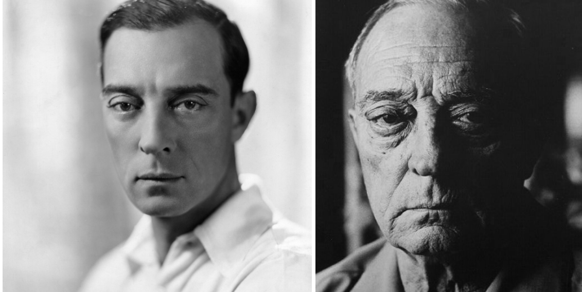
Keaton nel 1930 e nel 1965

A proposito di seduzione, vale la pena di sottolineare un aspetto del volto keatoniano sul quale in pochi si sono soffermati: la bellezza . (Prima o poi bisognerà che qualcuno parli della bellezza dei comici: di Chaplin, naturalmente, ma anche di Harold Lloyd, di Stan Laurel o – perché no? – anche di Oliver Hardy). Può sembrare una provocazione, ma le testimonianze non mancano. James Agee scrisse che la faccia di Keaton «rivaleggiava quasi con quella di Lincoln come archetipo americano, era inquietante, attraente, quasi bella» (l'interessato commentò: «Non riesco a immaginare come avrebbe preso questa affermazione il grande Lincoln, io ne fui molto contento»); mentre Louise Brooks la definì molto più semplicemente «il più bel volto d'uomo che abbia mai conosciuto». Una bellezza che non è solo l' appeal del divo hollywoodiano (in alcune immagini degli anni Venti sfiora persino il fascino androgino d'un Valentino), ma è qualcosa di più. Lo dimostrano i ritratti del Keaton anziano. Ora che il glamour ha ceduto il posto alle rughe, alle pieghe amare, alle borse profonde sotto gli occhi liquidi, quel volto acquisisce una ieratica grandezza, un “sublime naturale” non lontano da quello di certe statue antiche (preveggenza, Cecchi l'associava alle «terracotte azteche» e ai «basalti egizi»).