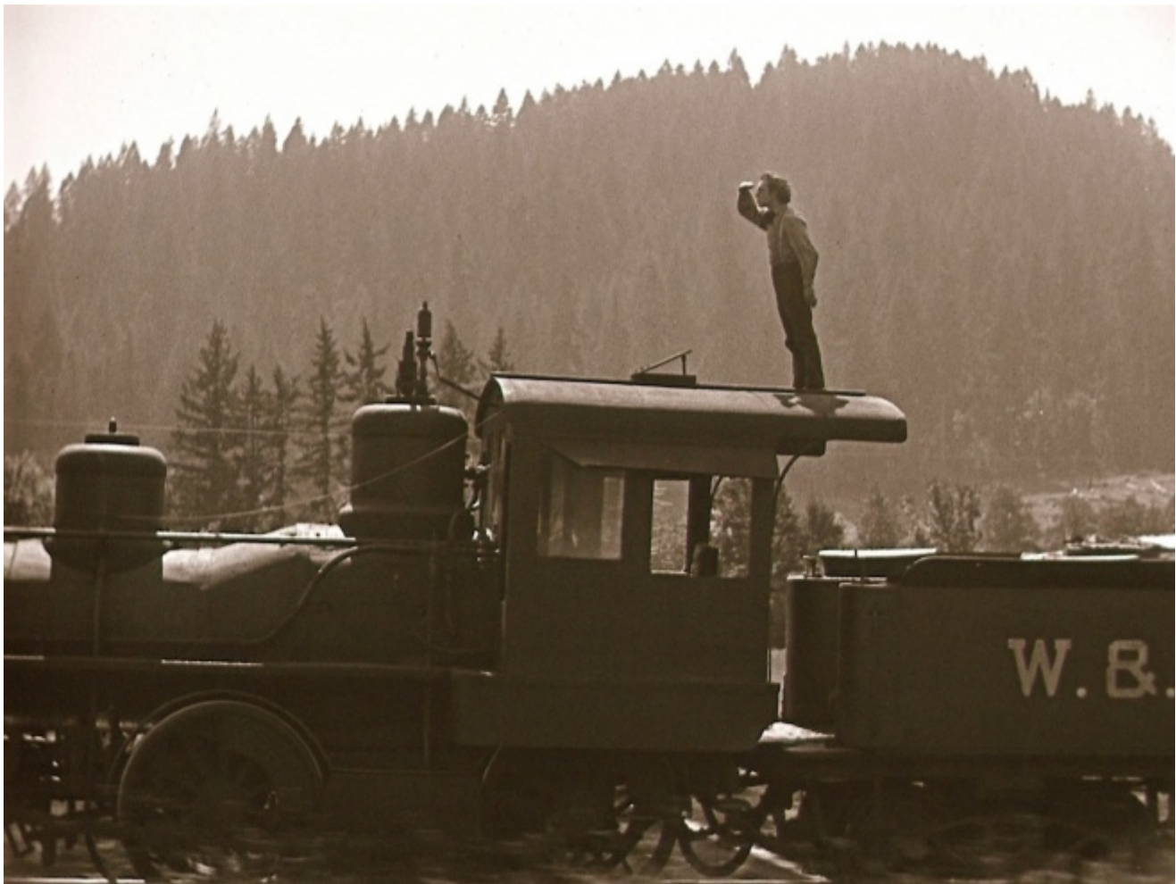
"The General" (1926)

Questa dialettica tra fisicità concreta e fisicità astratta si ripresenta continuamente. Basta un gesto, un'occhiata, una svolta qualsiasi nel racconto. In The General è sufficiente che Buster porti la mano agli occhi, a mo' di visiera per scrutare l'orizzonte, o che si prenda la faccia in mano con aria preoccupata. Per un istante, con un gesto che non è nemmeno una gag, l'intero film (l'inseguimento ferroviario, la ragazza in pericolo, la Guerra di Secessione) viene messo come fra parentesi, relegato in secondo piano. Rimane soltanto quel corpo, il corpo di Buster, piatto e immateriale come una gif avanti lettera.