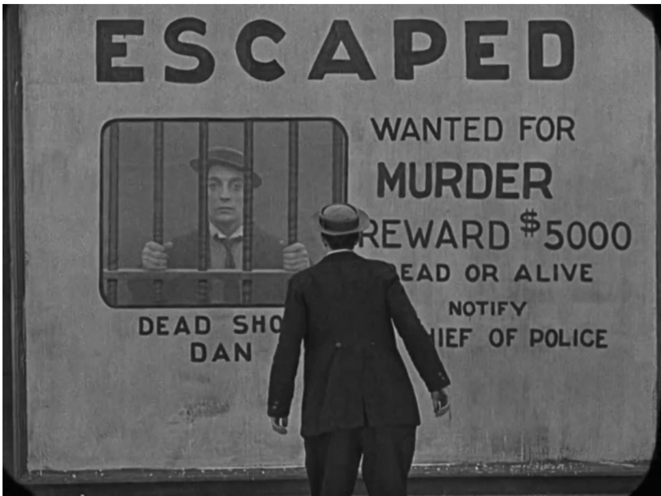
"The Goat" (1921)

Rispetto a lui, Keaton è quasi una presenza defilata. Essere al centro dell'attenzione sembra infastidirlo, e probabilmente si sottrarrebbe volentieri all'obbiettivo. Semplificando, si potrebbe dire che mentre Chaplin gioca sull'eccesso di presenza , Keaton punta su una altrettanto eccessiva assenza . Del resto, nel suo primo film come autore completo, The High Sign , viene presentato da questa didascalia: «Our Hero come from Nowhere – he wasn't going Anywhere and got kicked off Somewhere».