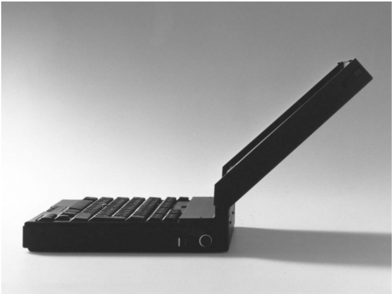
Dall'alto: Telefono Grillo, Siemens. Design di Zanuso e Sapper, 1966 Premio Compasso d'Oro; Lampada Tizio, Artemide. Design di Richard Sapper, 1972. Premio Compasso d'Oro e iF Design Award; ThinkPad 700c, IBM. Design di Richard Sapper, 1992