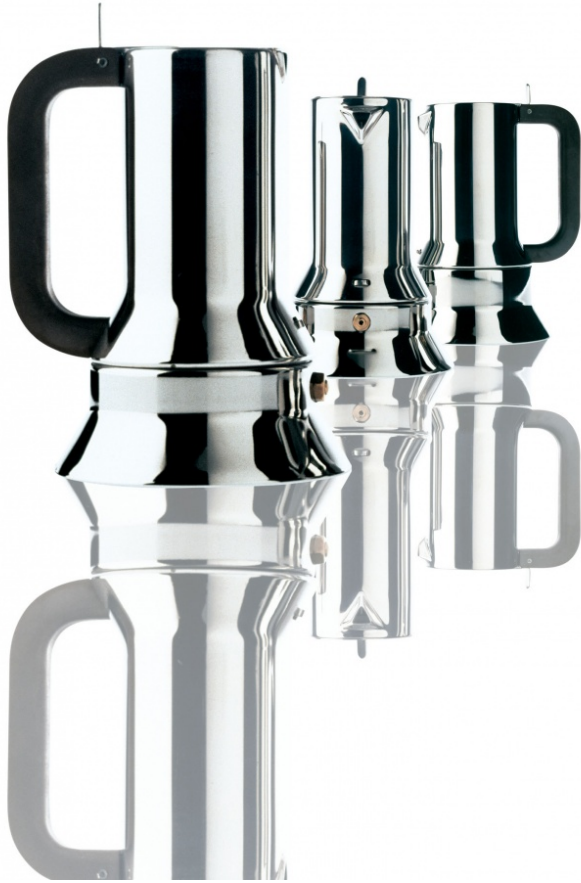
Dall'alto: Bollitore 9091, Alessi. Design di Richard Sapper, 1983; Caffettiera 9090, Alessi. Design di Richard Sapper, 1979. Premio Compasso d'Oro