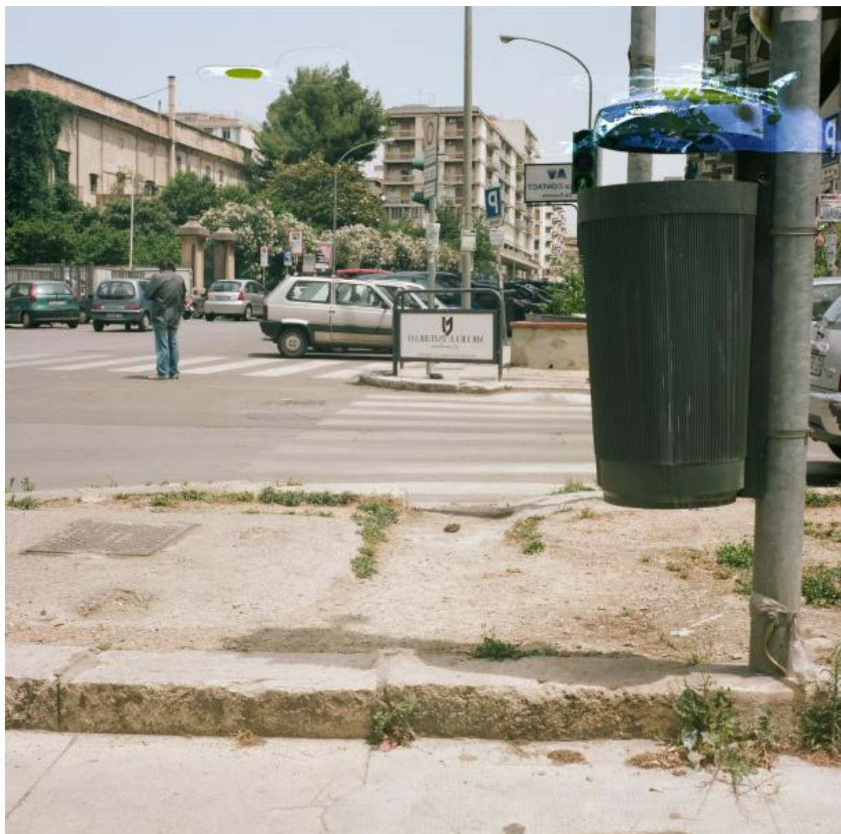
Sentiero De Gasperi