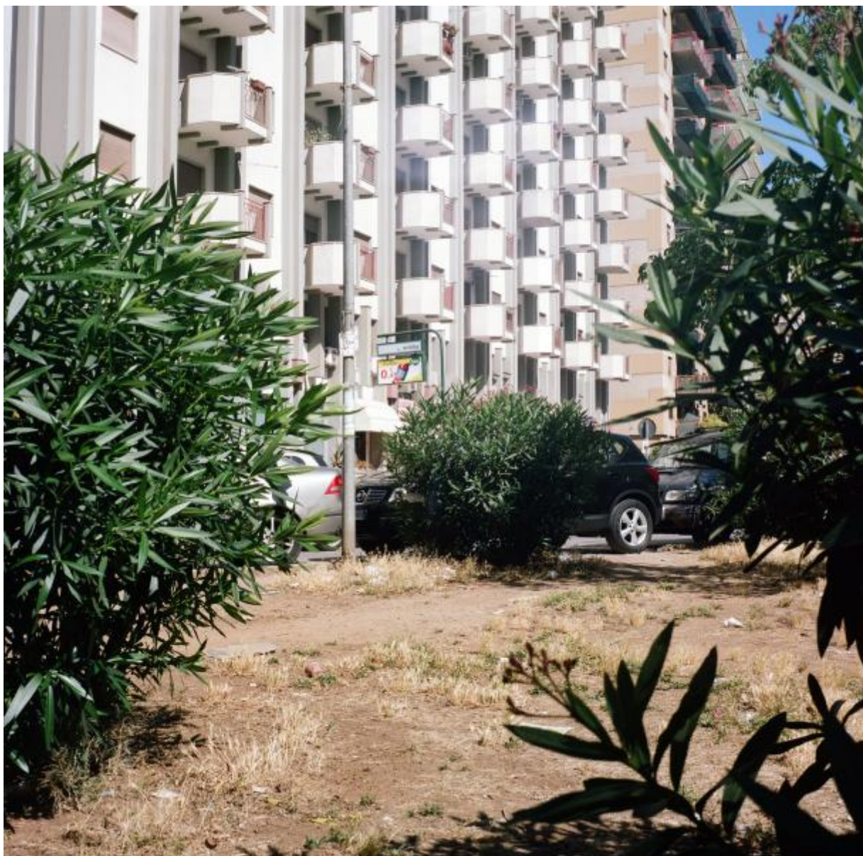
Sentiero Croce Rossa

Similmente fanno i pedoni col loro cammino, per raggiungere nel modo più lineare e veloce un punto d'interesse comune, come la fermata del bus, oppure per tagliare velocemente due strade parallele o che fanno angolo, laddove le strisce pedonali porterebbero di fronte ad un ostacolo o allungherebbero il tragitto.