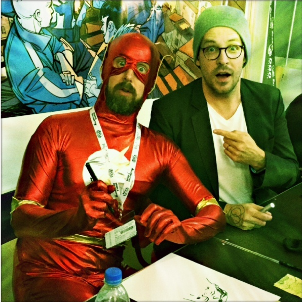
Matt Fraction e Chip Zdarsky, Lucca 2015

fronte non a franchise e personaggi di proprietà degli editori ma a titoli così detti Creator-Owned, i cui diritti sono in mano ai singoli autori. La maggior parte di loro è partita dalle autoproduzioni e dal fumetto indipendente, è stata traghettata attraverso le forche caudine di Marvel e DC e ora vede in un editore come Image la potenziale sintesi perfetta che coniuga libertà creativa con uno spiccato e legittimo spirito commerciale.