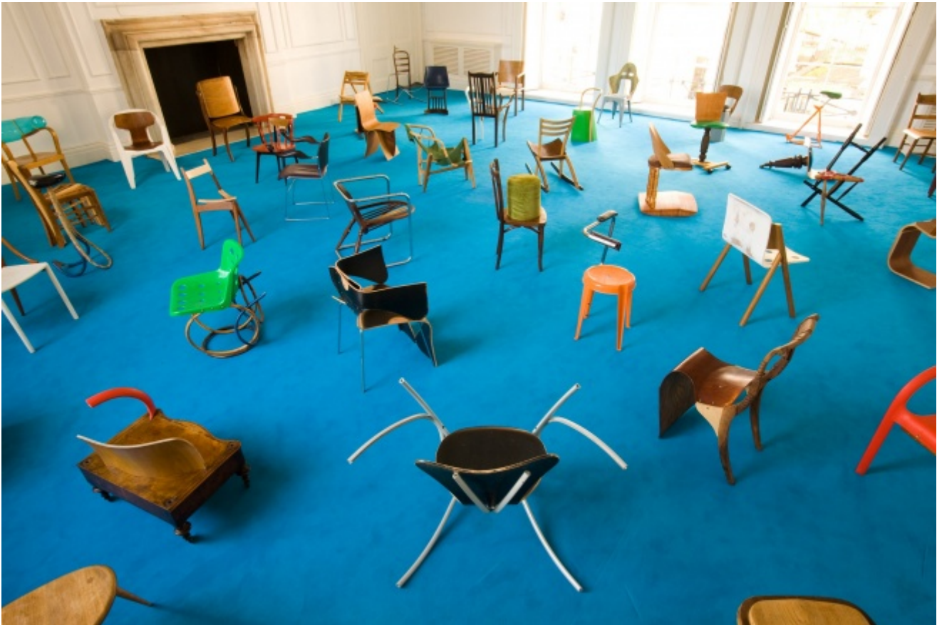
Martino Gamper, 100 Chairs in 100 days

Ora, il ruolo del trasformatore – designer, artisti e altri creatori – può essere visto come la creazione di nuove forme di sinergie creative, capace di traghettare il mondo oltre la trasformazione materiale, verso una nuova unificazione. L'arte non può più essere separata dal design, e viceversa. Stiamo reinventando un nuovo lavoro creativo totale. Emergono così nuove soluzioni per risolvere la schizofrenia del nostro tempo, che ci riportano su un terreno più umano, e al tempo stesso decisamente contemporaneo: il sociale e il collettivo, il partecipatorio, il democratico.