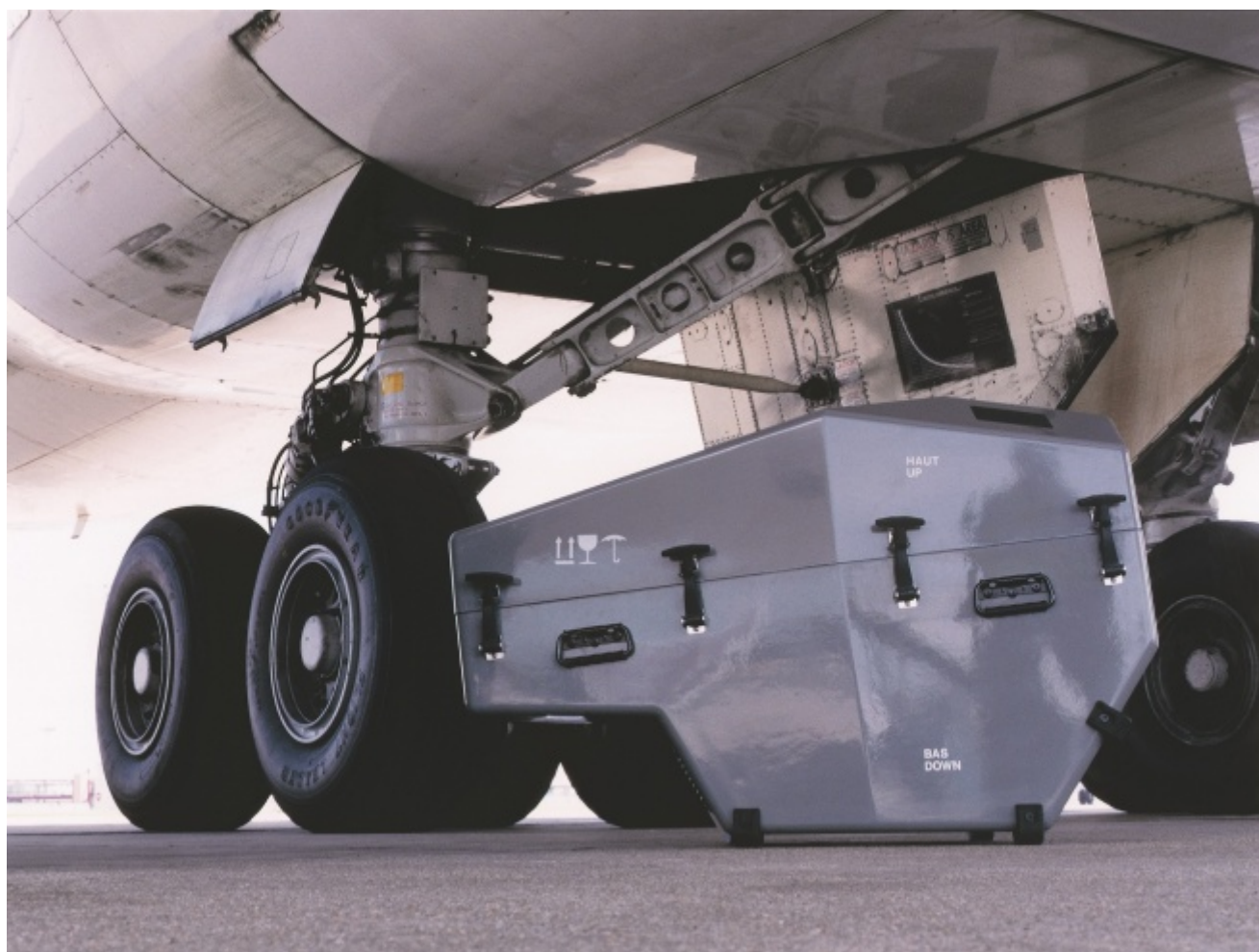
Didier Faustino, Body in Transit

In occasione del primo appuntamento, Come si diventa indipendenti (oggi pomeriggio alle 18 presso la Galleria 3 del MAXXI), pubblichiamo un estratto dal testo di Hou Hanru pubblicato nel catalogo Transformers, edito da Corraini Edizioni, che ci è stato gentilmente concesso.