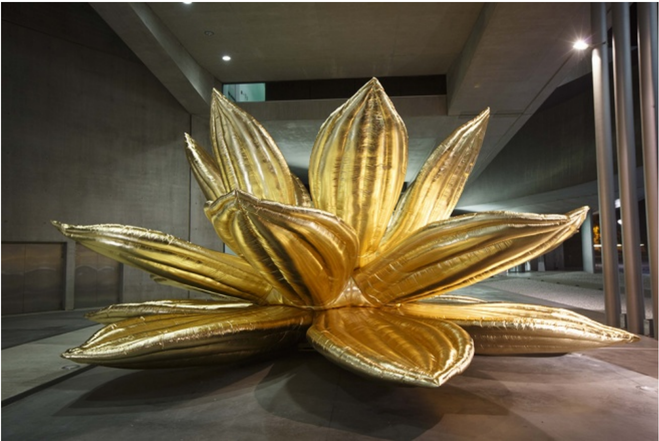
Choi Jeong-hwa, Breathing Flower , MAXXI 2015

immaginazione artistica, enfatizzano il potenziale di trasformazione, negoziando nuove tipologie di strutture spaziali che oscillano tra pubblico e privato, mobile e statico, effimero e permanente, politico e poetico.