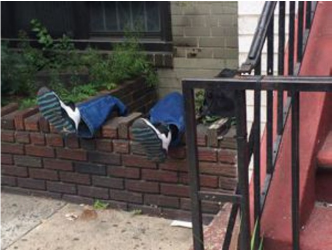
Un senzatetto in una fioriera

Sempre di questi mesi è la notizia che, a San Francisco, un'estensione per smartphone del numero d'emergenza 311 permetterà di segnalare alla polizia i sempre più numerosi senzatetto di una città divisa tra classe media impoverita e quella patrizia di lavoratori dell'hi-tech. «Una app per spioni», come l'ha definita una persona intervistata dal San Francisco Examiner. «Quello che stanno facendo è trasformare i residenti in poliziotti». Esagerava? È il solito gufo?