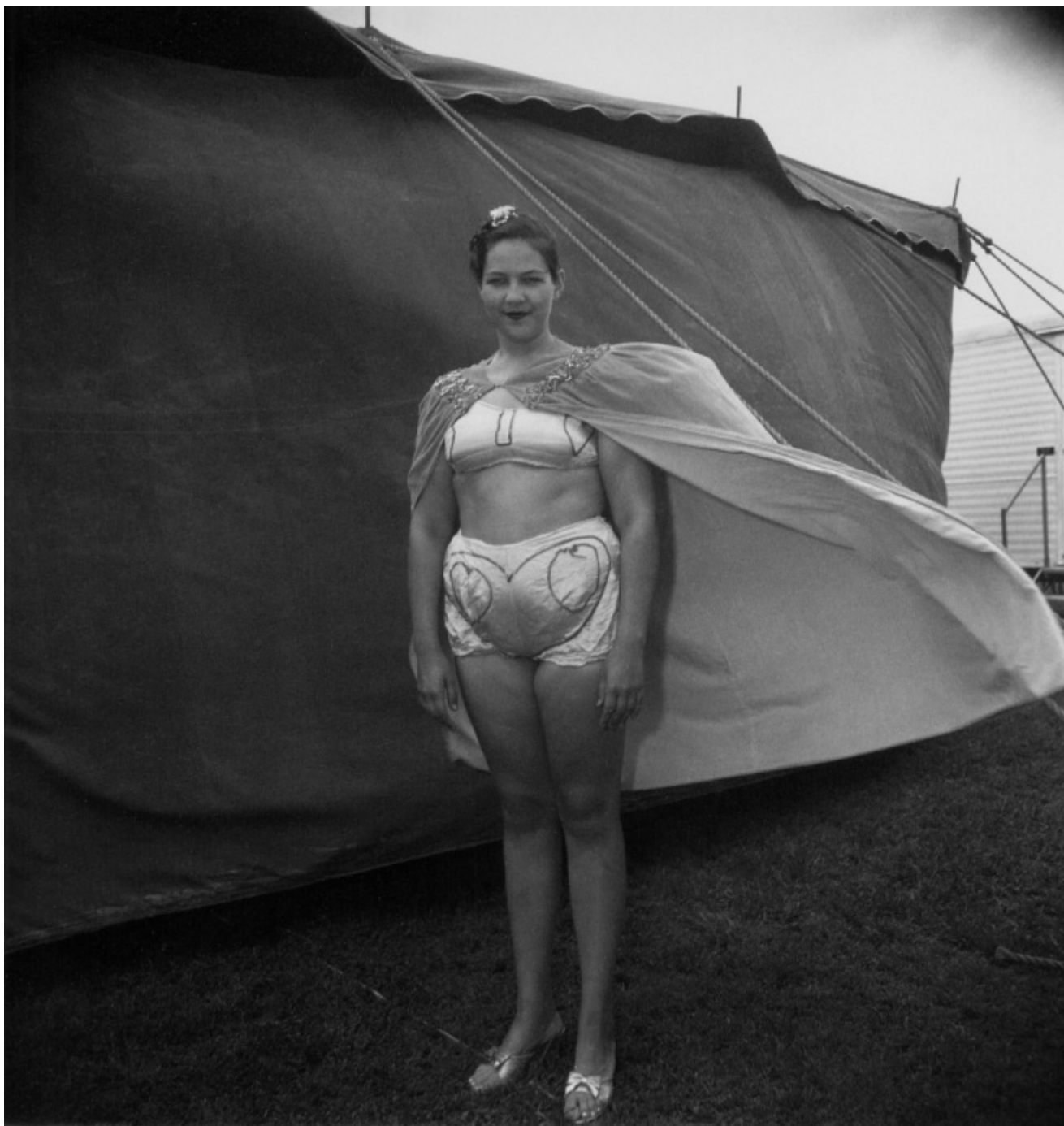
Diane Arbus, Girl in her circus costume, MD, 1970.

La risposta si trova in maniera diversa nelle altre immagini esposte. Sembra che in esse sia racchiuso il tentativo di oltrepassare ciò che Susan Sontag nel suo saggio sulla fotografia, scriveva a proposito delle immagini della Arbus: ovvero che impediscono una comprensione storica della realtà, poiché mostrano “un mondo nel quale tutti sono stranieri, disperatamente isolati, immobilizzati in identità e reazioni meccaniche e paralizzanti”, rendendo così irrilevanti la politica e la storia.