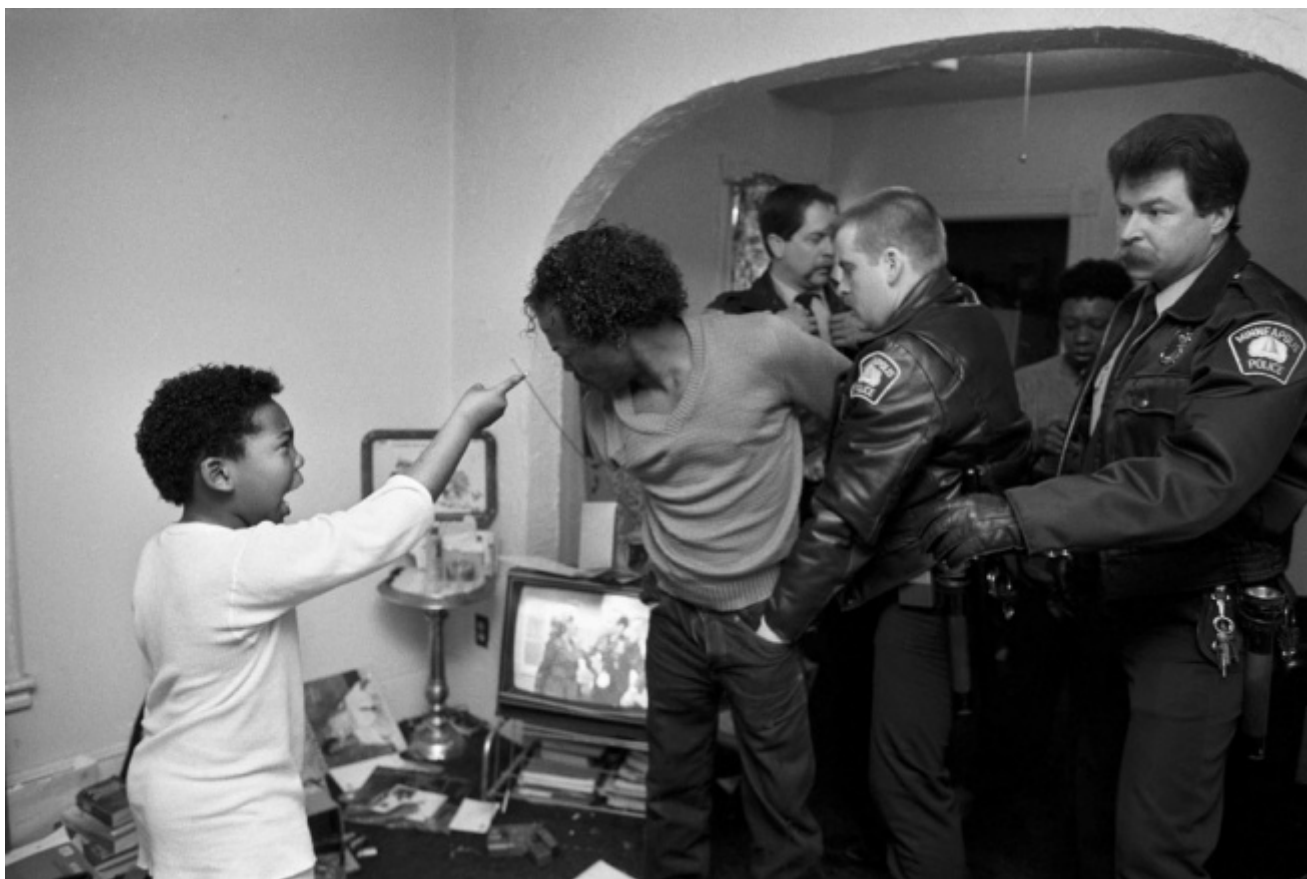
Donna Ferrato, Diamond (from the series Living with the Enemy) 1988. Donna Ferrato

E se alla fine l'interrogativo che sorge è: cosa hanno cambiato queste immagini? La violenza è diminuita, il degrado sparito, le città sono luoghi idilliaci? No. Eppure l'imperativo categorico è iniziare: a guardare, a capire, a stare nel mondo, forse a cambiare. E queste fotografie ne sono l'emblema: non se ne vanno, stanno ferme, chiedono di essere viste, sono lì a interpellare ognuno di noi sul nostro ruolo e il nostro essere nel mondo. C'è una frase di Marlene Dumas che voglio ricordare: «Vorrei che i miei quadri fossero poesie. La poesia è una scrittura che respira, lascia spazi aperti, in modo che si possa leggere tra le righe». Grazie a questa mostra, si può capire come lo può essere anche una fotografia.