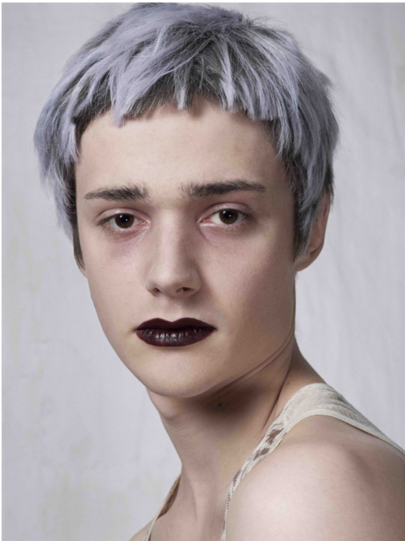
Bettina Rheims, Valentin P. III (From the series Gender Studies) 2011. Bettina Rheims

E ancora Catherine Opie che inizia a fotografare le comunità del suo paese: quella queer di S. Francisco, i surfisti in attesa delle onde, i pescatori dei laghi ghiacciati del Minnesota, i giocatori di football delle squadre