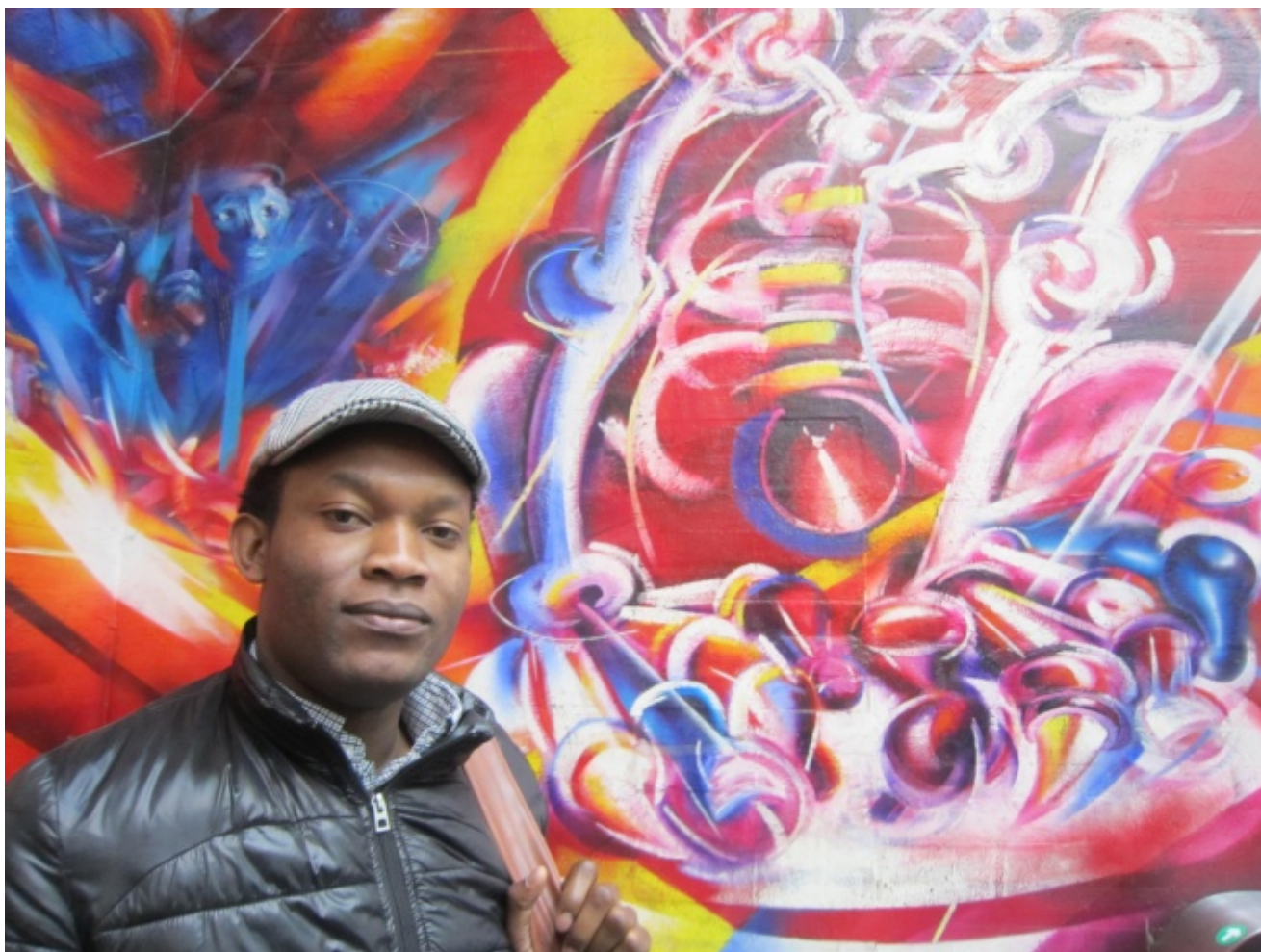
Fiston Mwanza Mujila

Lucien arrivò in via del Gabinetto del Primo Ministro numero 63 verso le due di notte.