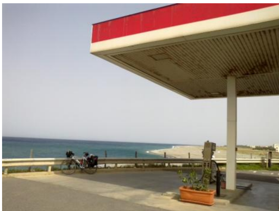
A Vibo Valentia faccio una pausa. Breve!