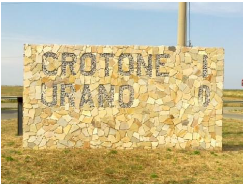
Crotone-Urano uno a zero