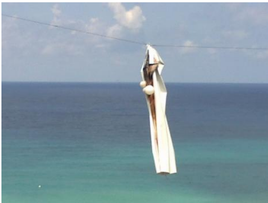
Ieri sposi oggi piegati