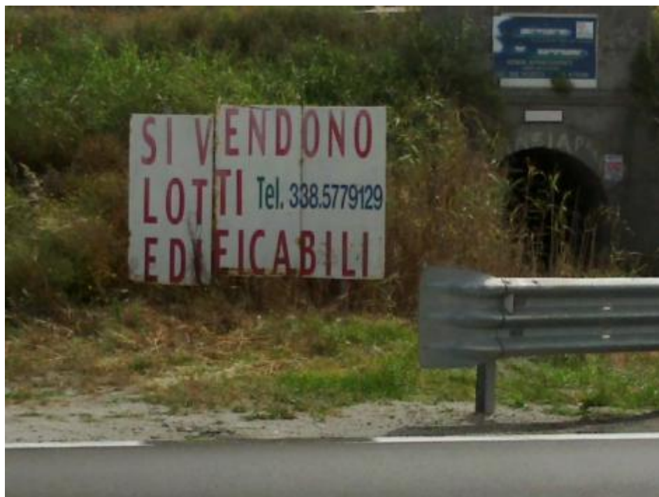
Si vendono lotti edificabili a Falerna Marittima