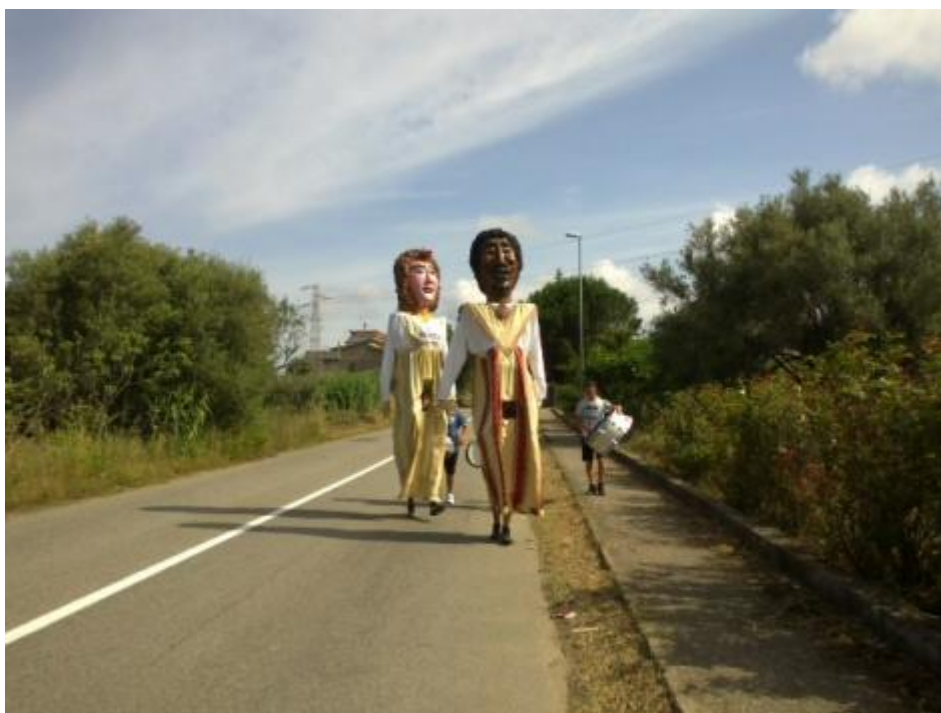
Incontrare Sant'Antonio il 13 Giugno alle 9 del mattino a Coccorinello