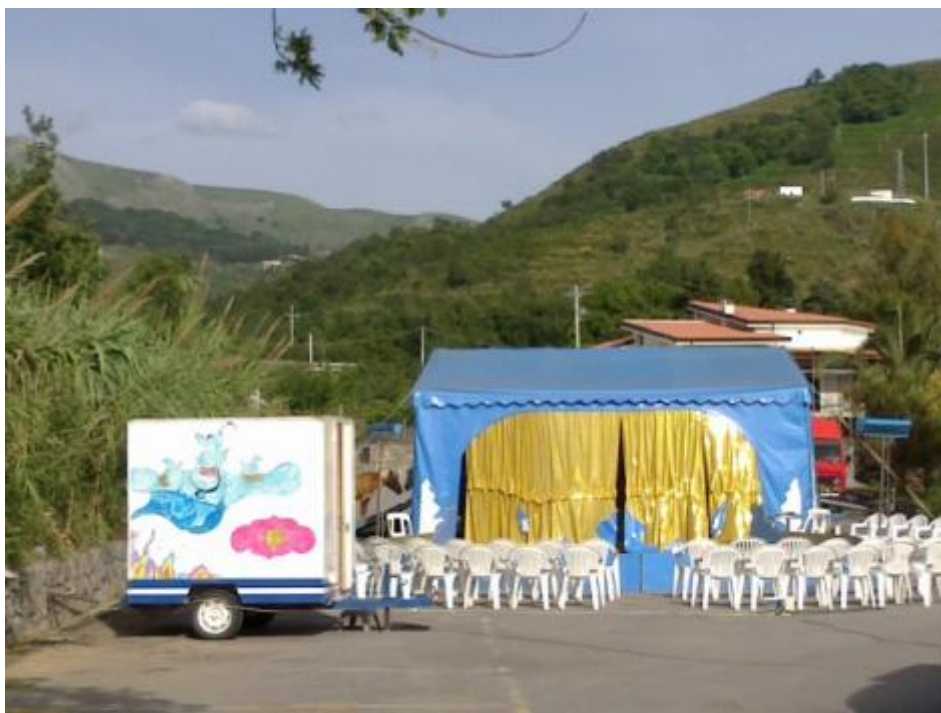
Anche in Calabria i cammelli