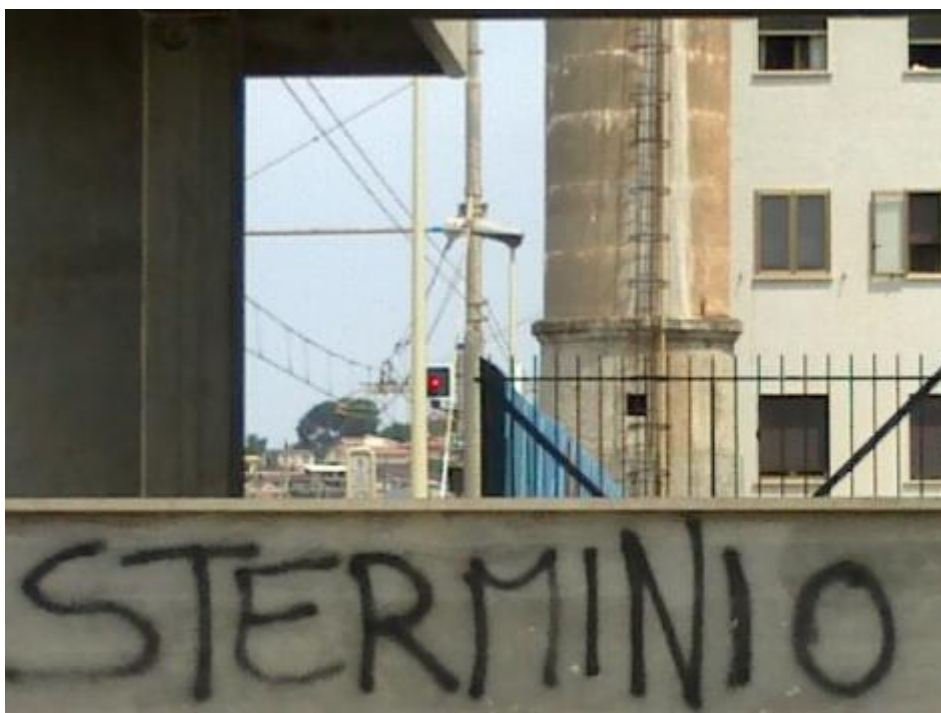
Sterminio a Belvedere