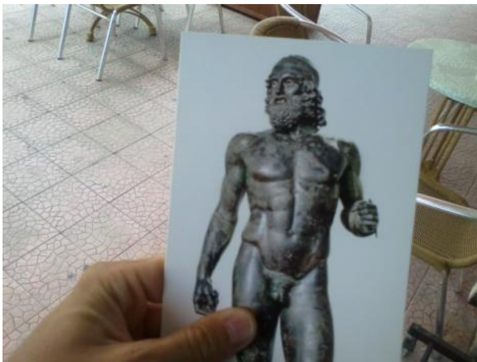
Non ancora Reggio Calabria