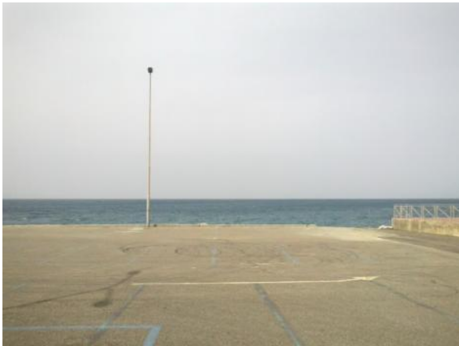
La solitudine di un palo (e la sua meravigliosa semplicità)