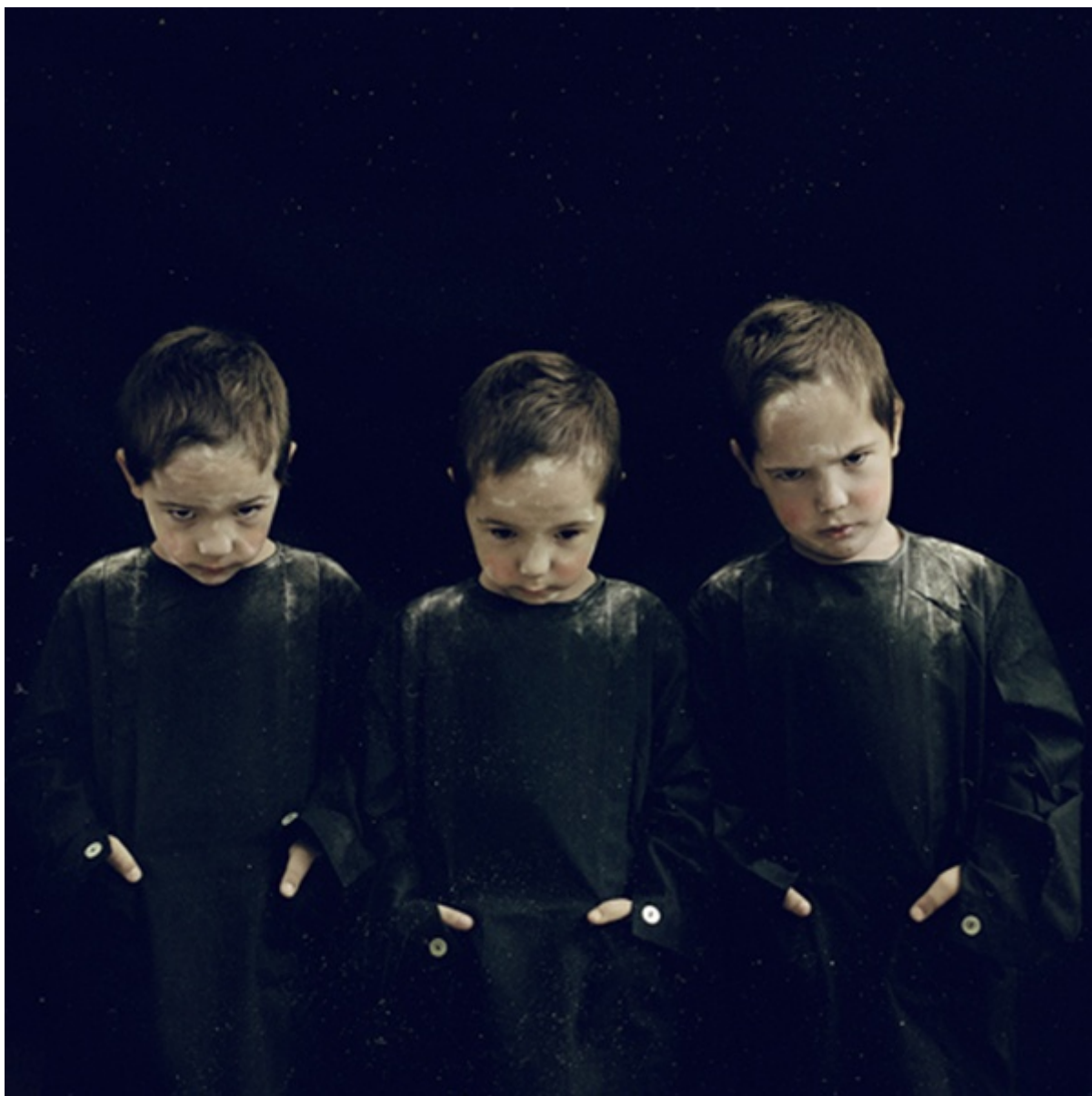
Dall'alto: An opening Song; Shadows on Parade

Però hai detto che non ti interessa ritrarre quello che vedi.