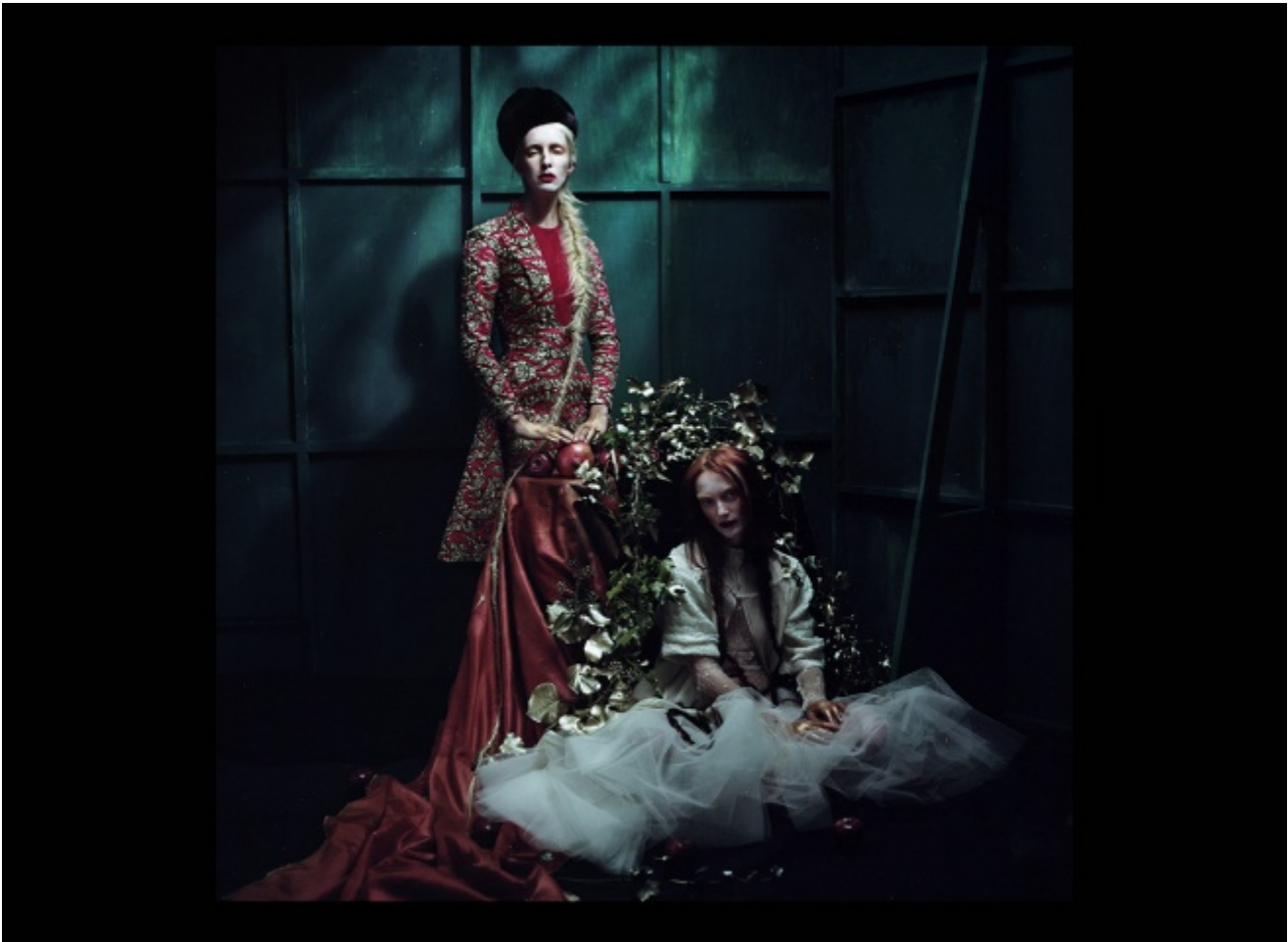
A Study in Red and Gold, 2015

Quale consideri il primo lavoro che ti ha dato la possibilità di metterti alla prova come artista, al di là della moda?