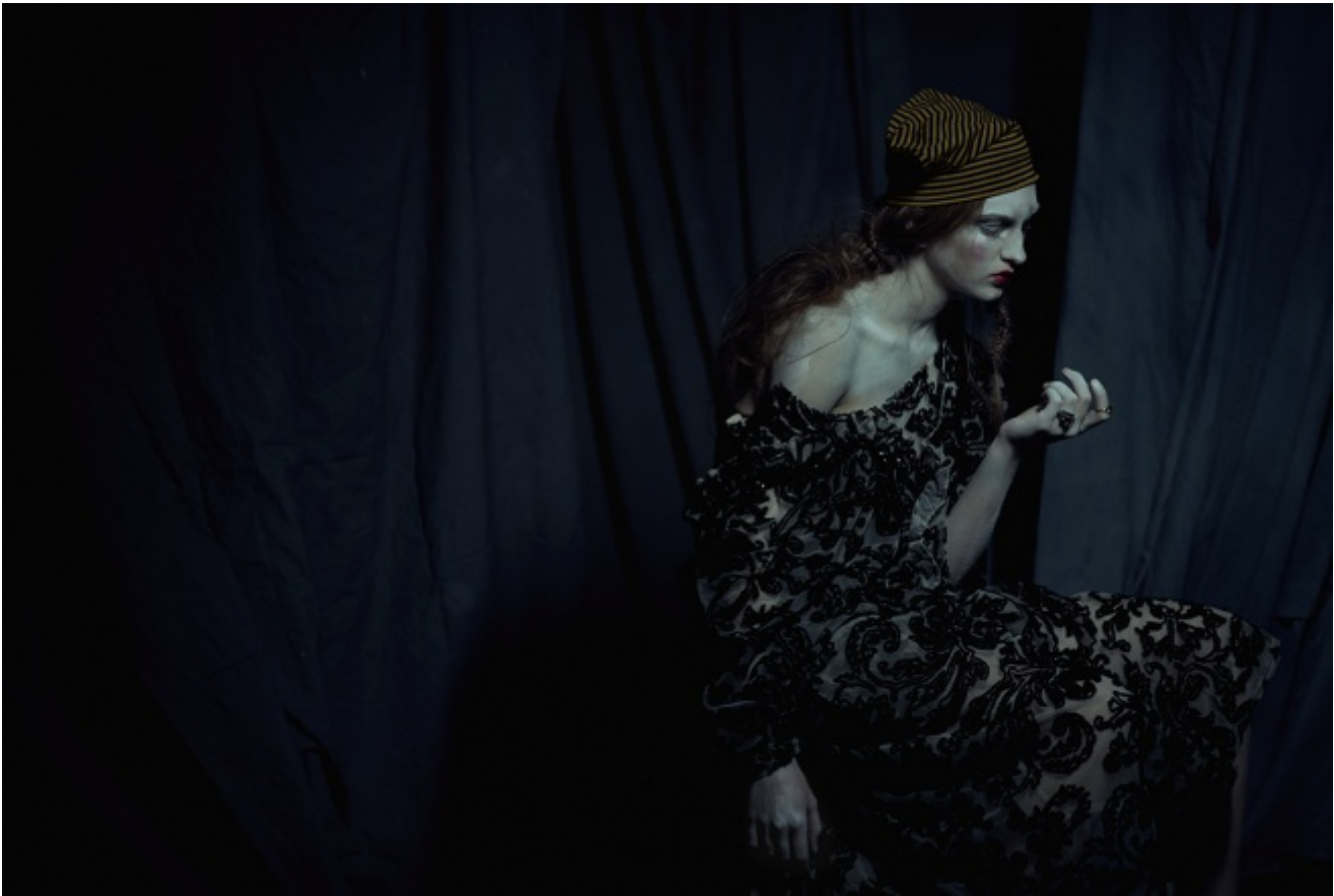
Shooting for Grey Magazine, 2015