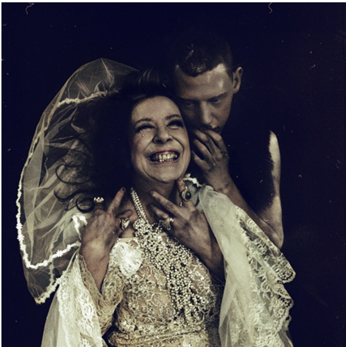
Shadows on Parade

Da Roma a Londra. Che cos'è che ti ha portato qui?