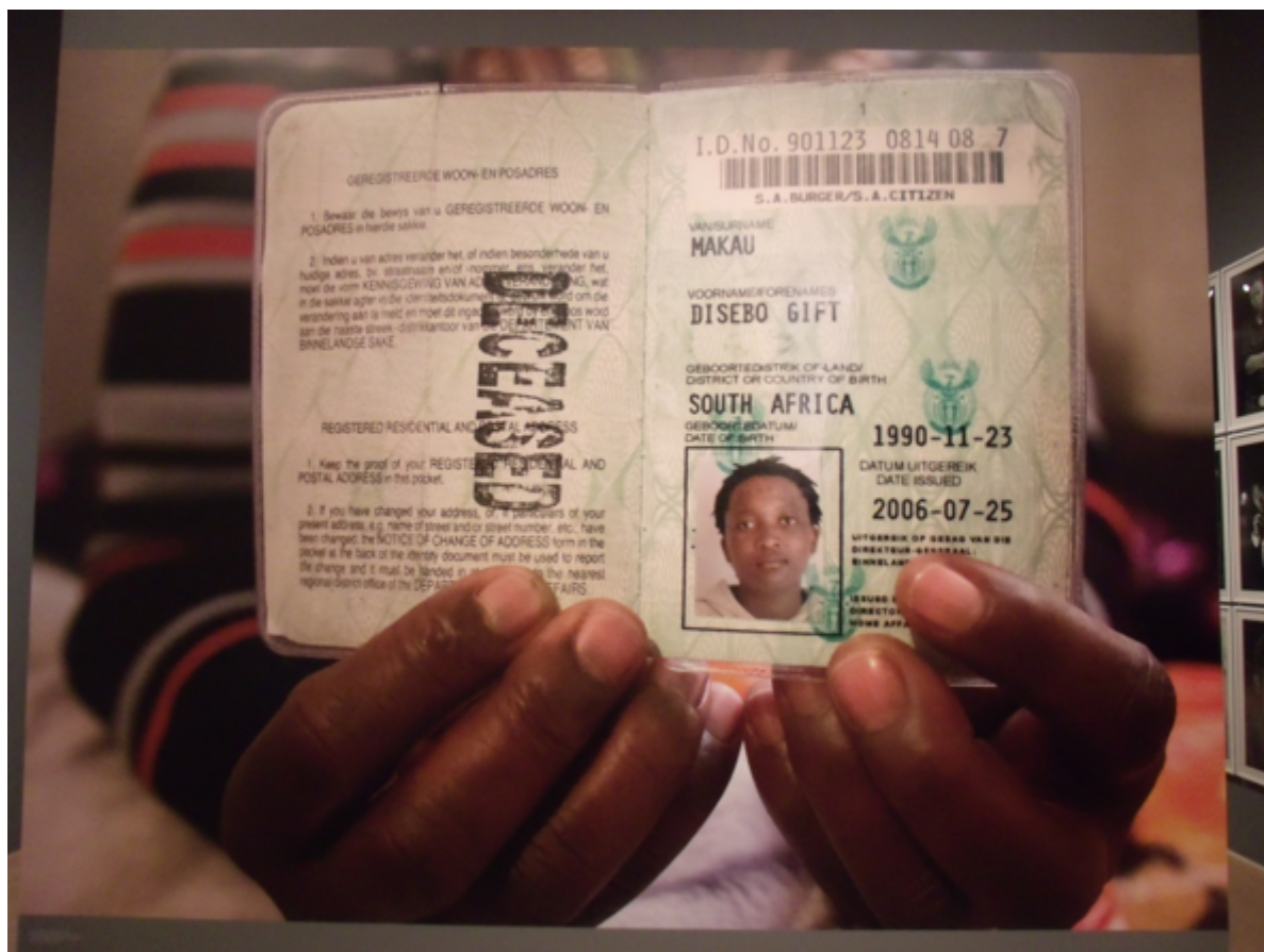
Zanele Muholi, Isibonelo/Evidence , installazione, Brooklyn Museum, 2015.

Per quanto gli ambienti artistici abbiano fatto grandi passi in avanti nel rappresentare ed esporre artisti di origine africana – da un crescente numero di mostre personali (Ibrahim El-Salahi alla Tate Modern, El Hadji Sy al Weltkulturen Museum, Zanele Muholi al Brooklyn Museum), alla prolifica presenza africana alle biennali di tutto il mondo (compresa la cruciale partecipazione a All the World's Futures di Okwui Enwezor per la Biennale di Venezia 2015) – esiste un gruppo di persone per le quali l’Africa è ancora un luogo immaginario.