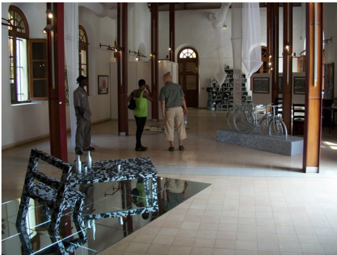
Toguo/Cissé, installazione alla Galerie Le Manège, Biennale d'Art, Senegal, 2010.

La mia prima visita a Dakar ha messo a dura prova la disinformazione che avevo assorbito nel corso di una vita. A qualsiasi osservatore dotato di senso critico appare evidente che il Senegal non rappresenta l'intera Africa, che Dakar non rappresenta il Senegal, e che nessuno dei suoi arrondissement rappresenta tutti gli altri. L'omogeneizzazione si frammenta rapidamente in idiosincrasie e specificità. Non esiste un singolo tipo nazionale o regionale di persona, proprio come non esiste uno stile artistico unico e lineare.