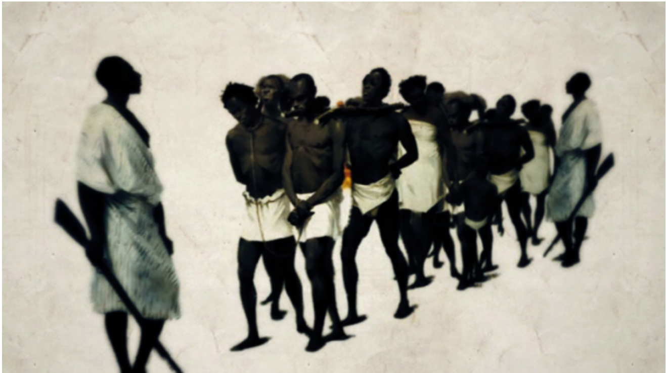
Bofa Da Cara, My African Mind, 2010, still da video, 6'11''.