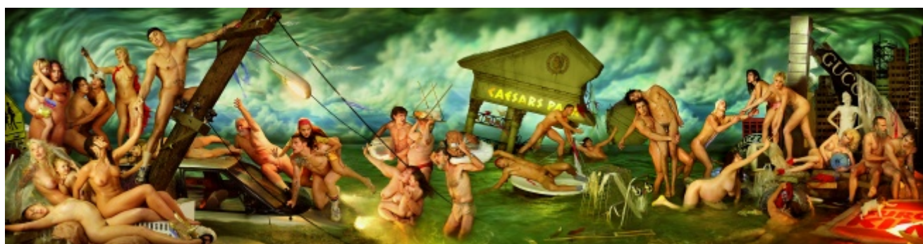
David LaChapelle, Deluge , 2006

La fine di una civiltà porta sempre con sé un cumulo di macerie, cadaveri, rovine semi carbonizzate di un'epoca colma di corpi e oggetti. Dopo il Diluvio , retrospettiva sul lavoro di David LaChapelle in mostra fino al 13 settembre al Palazzo delle Esposizioni di Roma, cattura in immagini il crollo fantasticato della nostra cultura ipermediatica e lo racconta secondo quello che a prima vista potrebbe essere considerato il canone estetico più diffuso del nostro tempo, ovvero quello di una società dello spettacolo estremamente fotoritoccata. La trasposizione nel contesto del presente di un'icona o un topos narrativo sedimentati nella coscienza culturale è un evento necessario per estrapolare dal passato quei dati emotivi o concettuali che continuano ad agire dentro l'essere umano; e la morte di una civiltà presuppone, ben più degli specifici decessi biologici, la fine delle idee, dei pensieri, e soprattutto della capacità di immaginazione di un popolo, lasciando solo i resti dei prodotti culturali da esso realizzati. In Il diluvio , David LaChapelle descrive la distruzione della nostra epoca come un'implacabile inondazione in cui le persone, annegate o semisommerse, possono trattenere della loro vita passata solo gli abiti che indossano, i corpi talora lucidi e palestrati che si sono costruiti, o quelli molli e grinzosi che gli sono capitati.