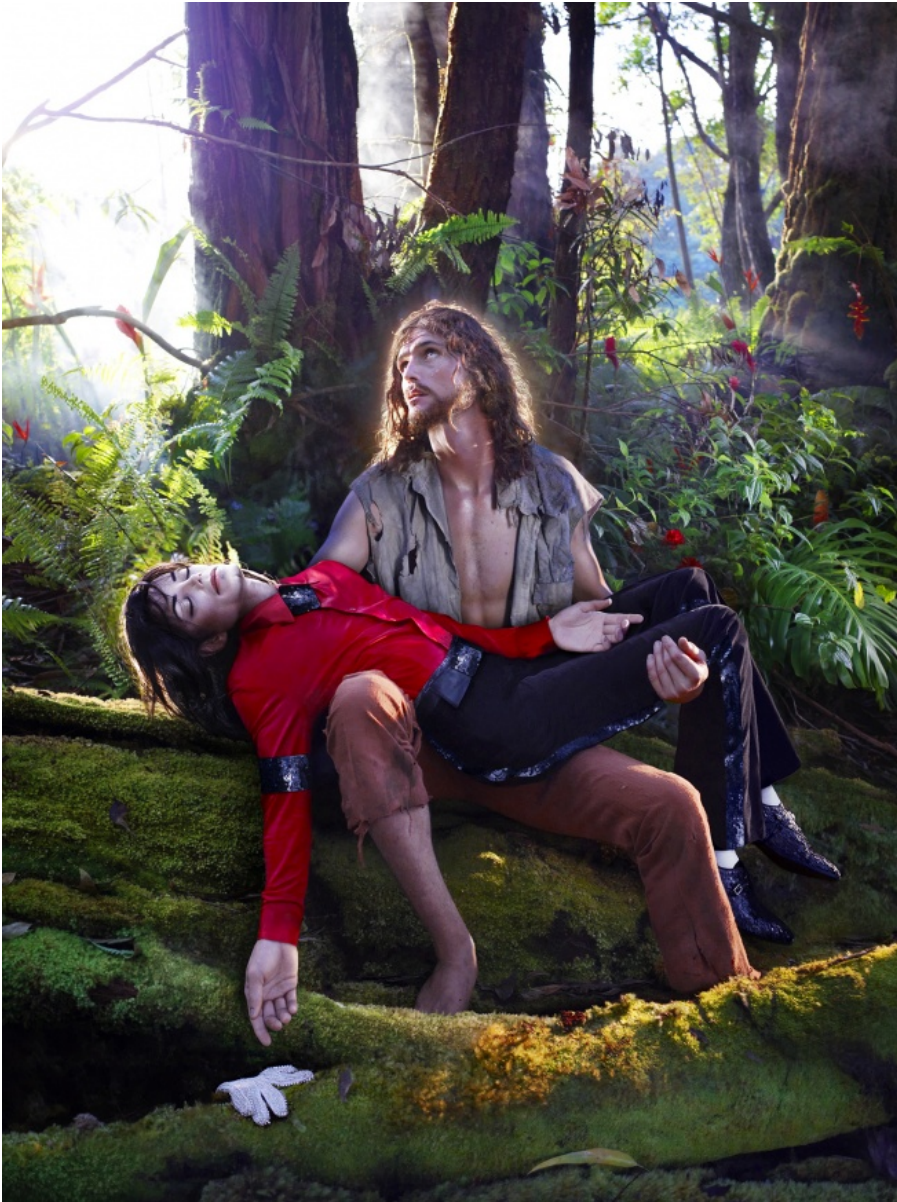
David LaChapelle, American Jesus , 2009