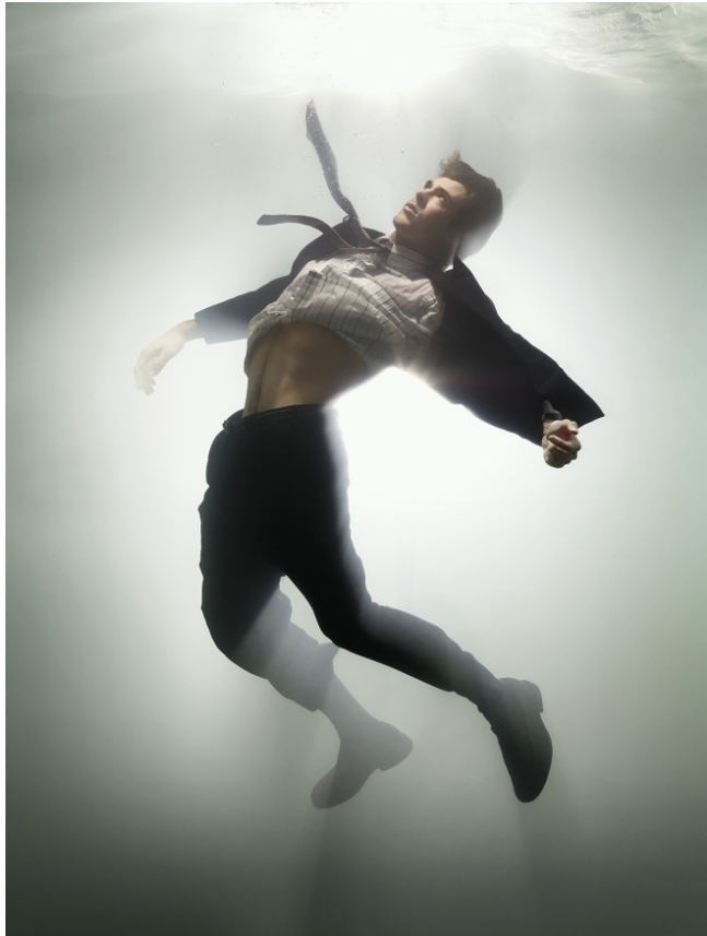
Da sinistra: David LaChapelle, Anonymous Politicians , 2012; The Awakened , Job, 2007