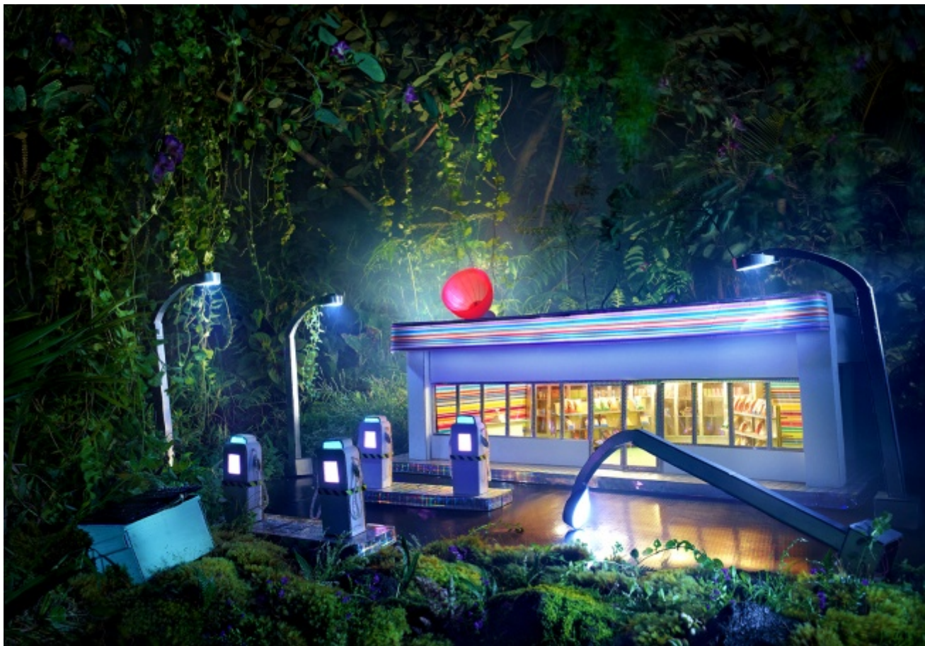
David LaChapelle, Gas am pm , 2012

commissione dopo molti anni di attività.