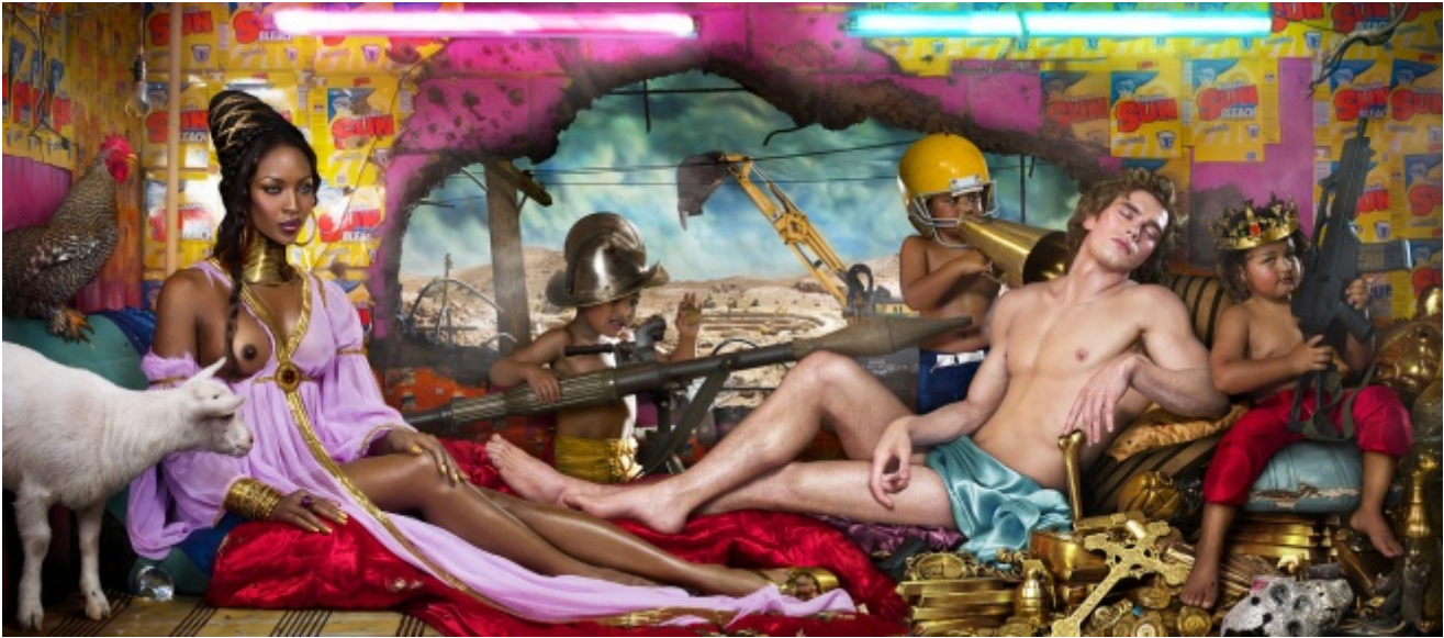
David LaChapelle, The Rape of Africa , 2009

soggetti scelti per interpretare immagini consacrate alla storia dell'arte. Come nei casi di Rape of Africa (2009), citazione dalla Venere e Marte di Sandro Botticelli (1483), oppure in Negative Currency, Car Crash (2008), opere realizzate in seguito alla crisi del 2008, come in My Own Marilyn (2002), dove i riferimenti alle serie One Dollar Bill e Death and Disaster , di Andy Warhol, sono evidenti.