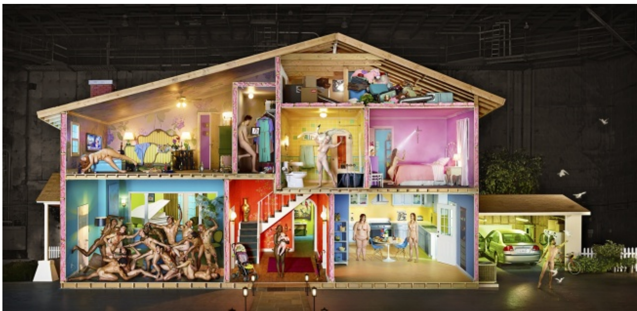
David LaChapelle, Self Portrait as a House , 2013