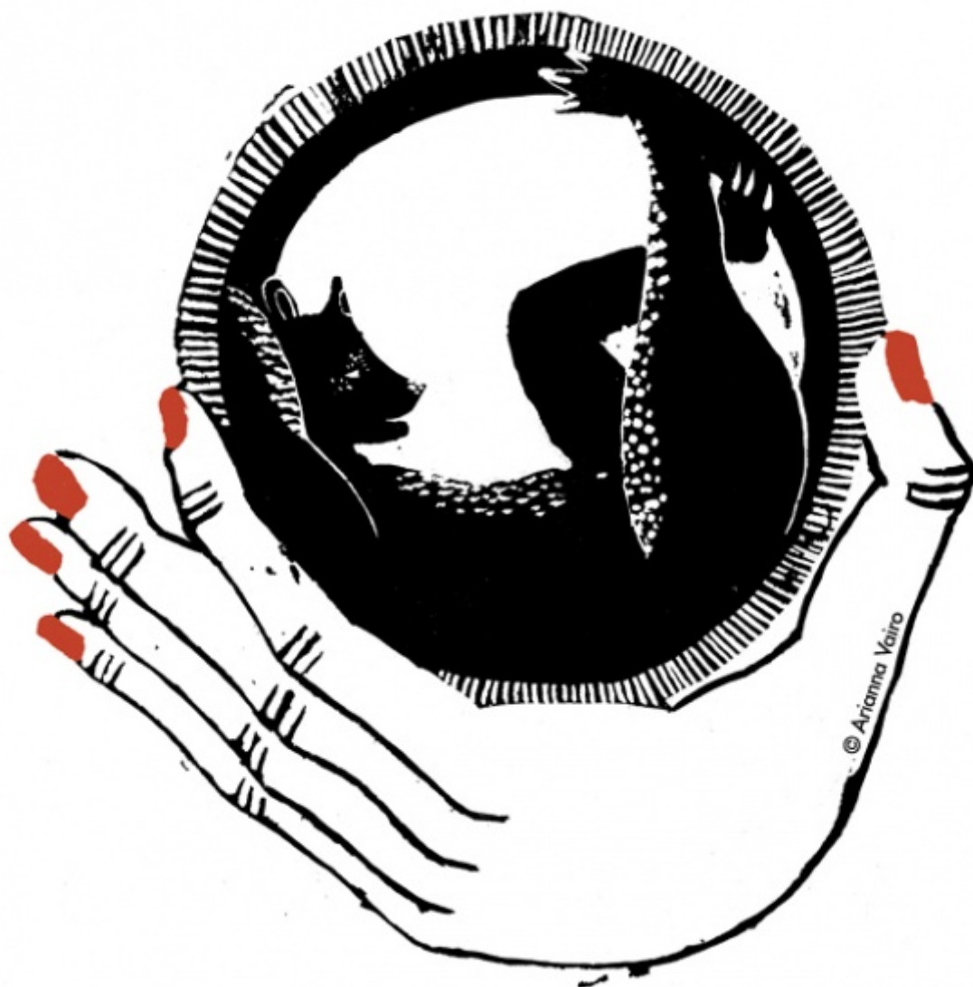
PHOTO-BERLIN SUMMER 2015