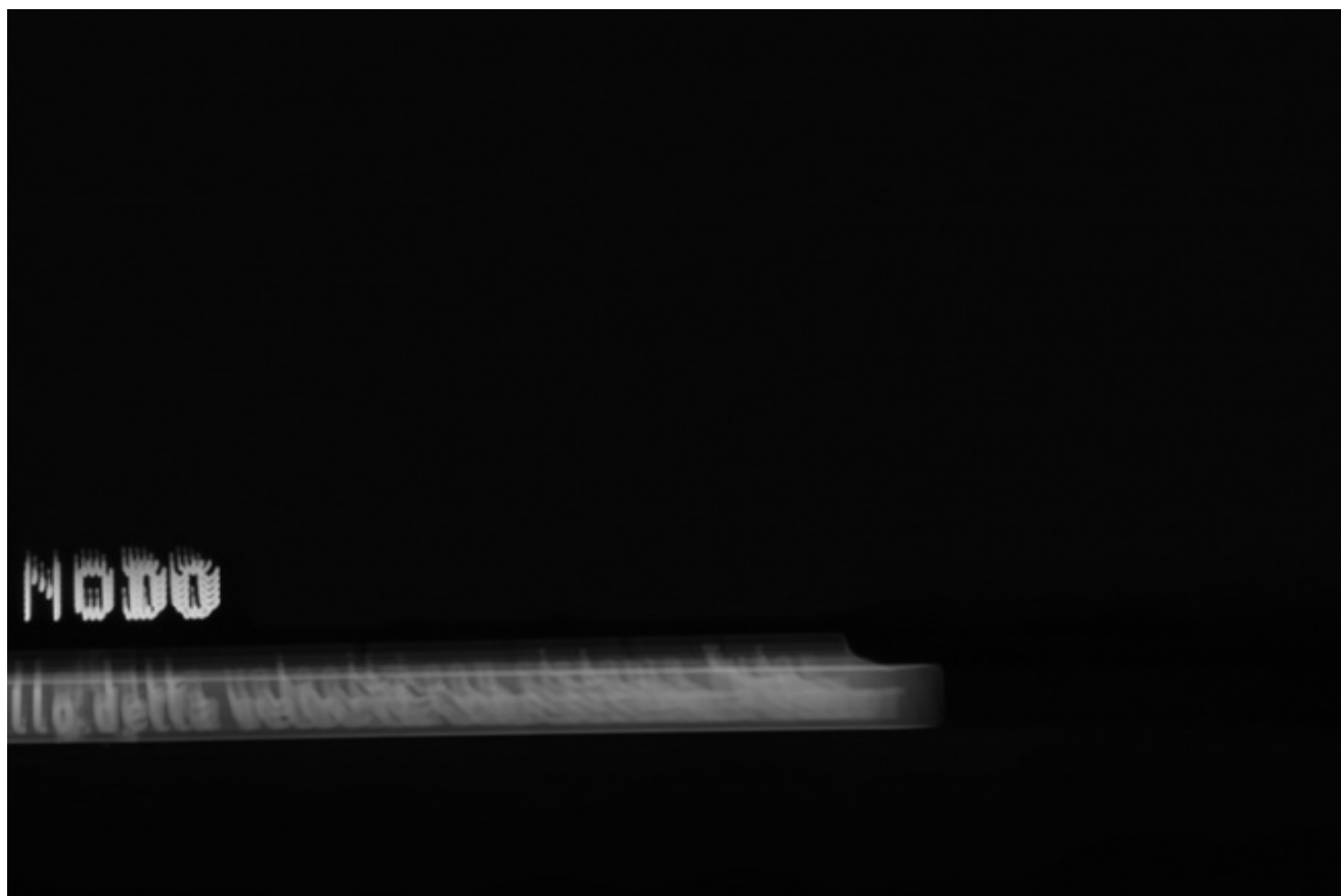
ph. Aurelio Andrighetto