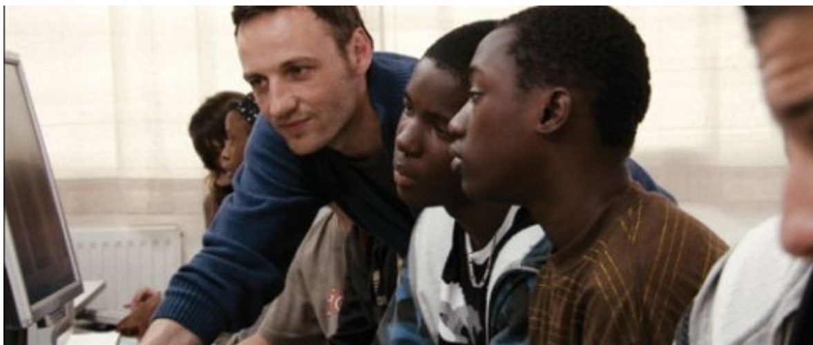
Entre les murs (The Class, France 2008)

favorire apprendimento. Il che richiede scienza ma anche arte, per dirla un po' all'antica. E, così, ti imbatti in una serie di questioni che riguardano i bambini e anche te stesso. Certo, ogni lavoro interroga se stessi, ma qui si tratta di una relazione umana intensa, ripetuta ogni giorno, per anni, con persone che stanno crescendo e sono giovani alla vita: c'è un "di più".