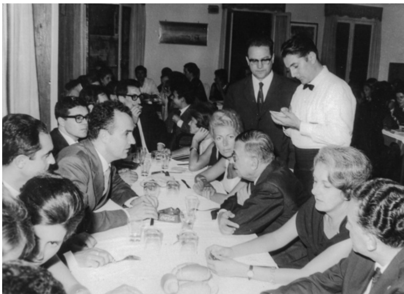
A cena con Sartre: si riconoscono a destra Jean-Paul Sartre e Rossana Rossanda; a sinistra Italo Calvino, Luigi Nono, Giuliano Scabia, Toni Negri

Continua lo speciale dedicato agli ottanta anni di Giuliano Scabia, uno dei padri fondatori del nuovo teatro italiano, maestro profondo e appartato di varie generazioni, artista sperimentatore, poeta, drammaturgo, regista, attore, costruttore di fantastici oggetti di cartapesta, pittore dal tratto leggero e sognante, narratore, pellegrino dell'immaginazione, tessitore di relazioni, incantatore. Dopo l'intervista Alla ricerca della lingua del tempo , la pubblicazione in quattro puntate del poema Albero stella di poeti rari – Quattro voli col poeta Blake (lo potete scaricare in pdf qui ), l'articolo di Oliviero Ponte di Pino sul suo teatro , Attilio Scarpellini lo intervista sulla delicata della violenza politica, incrociata in vari momenti del suo camminare e ricercare. E il poeta regala, infine, ai lettori di doppiozero una Canzone inedita.