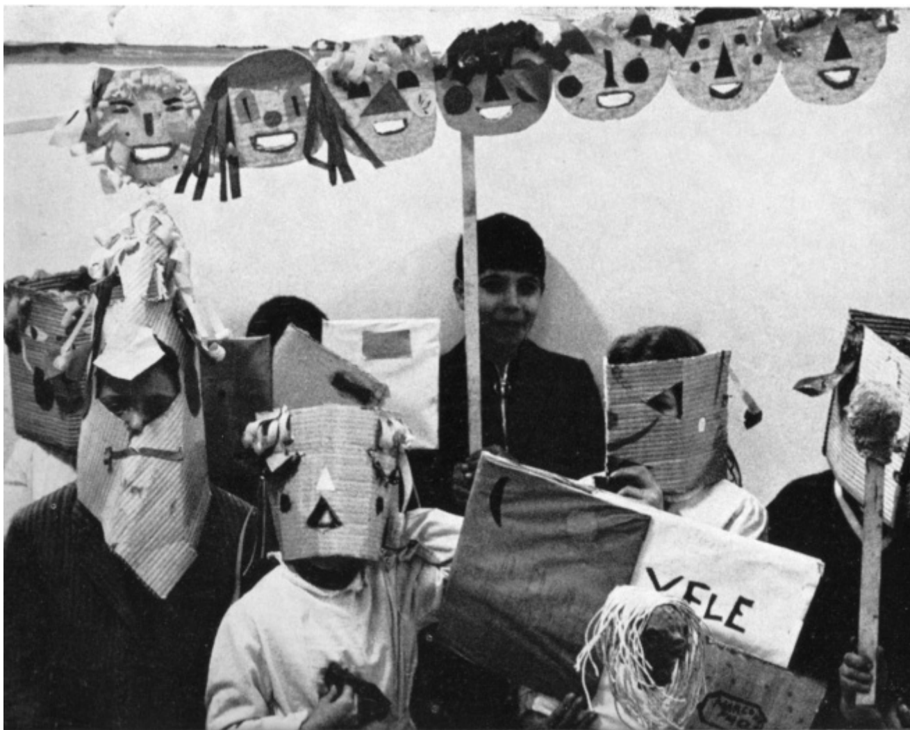
Azioni di decentramento a Torino: i bambini e il loro doppio; le maschere di cartone per il Teatrino di Corso Taranto, e – in alto – il grappolo delle sagome di teste in compensato

A quel punto è successo che mi sono spaventato, del dolore e di quell'esplosione dolorosa che era stato il '77. Perché avevo visto tante persone, anche tra i miei allievi, rovinate da questa infatuazione per la violenza politica. Volevo calmare le teste e allora ho detto: ricominciamo da zero. Uno dei primi lavori all'epoca è stato quello di rileggere con gli studenti la prima scena di Zip dove c'è la nascita degli attori dall'uovo. Ho chiesto agli otto studenti che in quel momento seguivano il mio seminario di cominciare dalle loro parole più segrete, che è una pratica che avevo già esplorato in In capo al mondo . Ognuno si è dato un nome e ha elaborato un copione ispirato alle prime parole, quelle dell'infanzia, quelle segrete, i primi suoni con la madre e il padre. Alla fine c'erano queste otto voci che dialogavano tra di loro. Volevo ripartire da ciò che è più radicale, più profondo e spesso più rimosso dentro di noi.