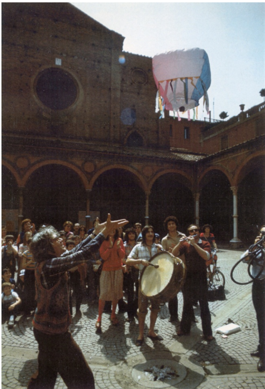
Volo di mongolfiere nelle strade di Bologna dopo i fatti del marzo '77