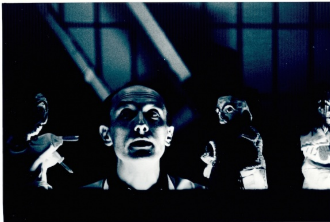
Ciclo del Teatro Vagante: Fantastica Visione Vision Fantastique, regia di Alessandro Marinuzzi, prod. Css Udine - L'Abattoir - Centre Régional de Créations Européennes de Chalon-sur-Saône (1993)