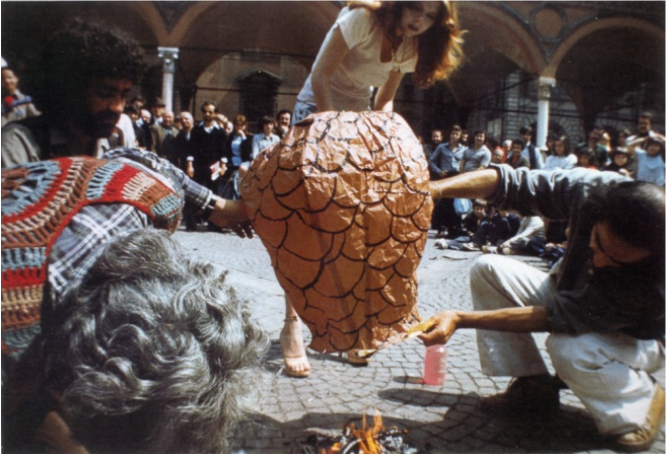
Lancio di mongolfiere nelle strade di Bologna dopo i fatti del marzo '77