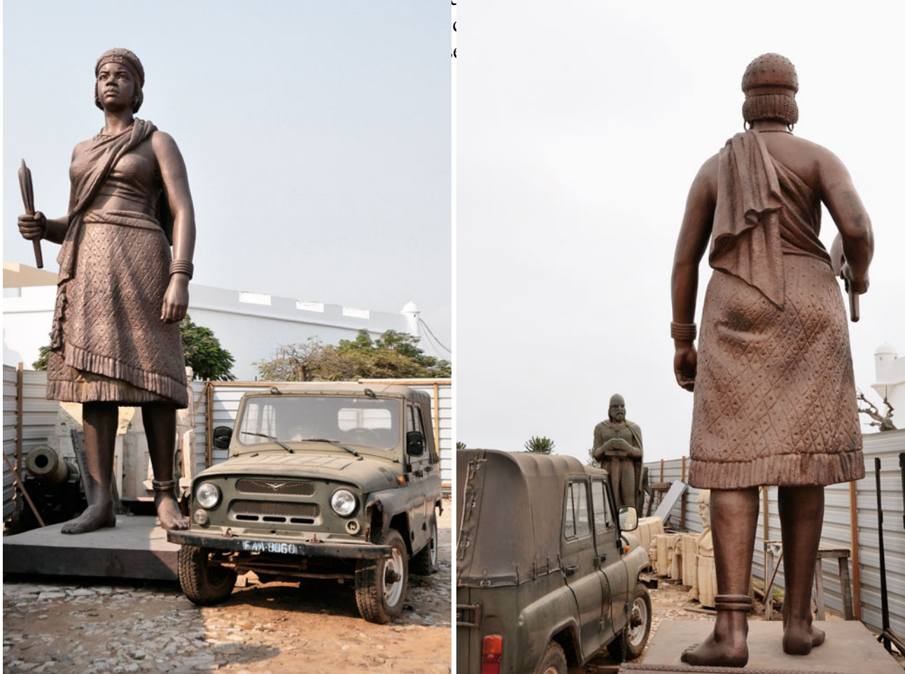
Kiluanji Kia Henda. Balumuka (Agguato), 2010. Per gentile concessione dell’artista e della Galleria Brundyn+, Città del Capo

“conseguenze del colonialismo” e sul “segno che esso ha lasciato nell’attuale panorama geografico, sociale e olto ad