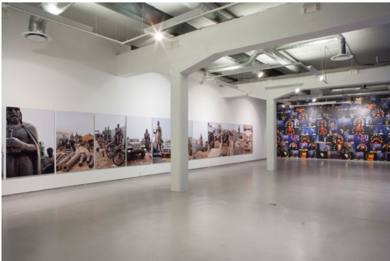
Un'immagine della mostra (2014) di Kiluanji Kia Henda, As God Wants and the Devil Likes It .

Basate principalmente sull'uso del mezzo fotografico, le opere di Henda ruotano intorno alla rappresentazione dell'Africa, al passato e al futuro del continente. La sua mostra dal titolo As God Wants and the Devil Likes it , tenutasi lo scorso settembre alla galleria Brundyn+ di Città del Capo, è una riflessione sulle