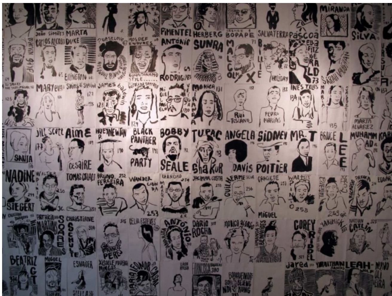
Francisco Vidal. Installazione. Per gentile concessione dell'artista

La pratica artistica di Vidal attraversa una pluralità di mezzi espressivi – tra cui disegno, scultura e installazione – per riflettere sulla realtà che lo circonda. La sua ricerca verte intorno ai concetti di razza, differenza, negritudine e diaspora africana.