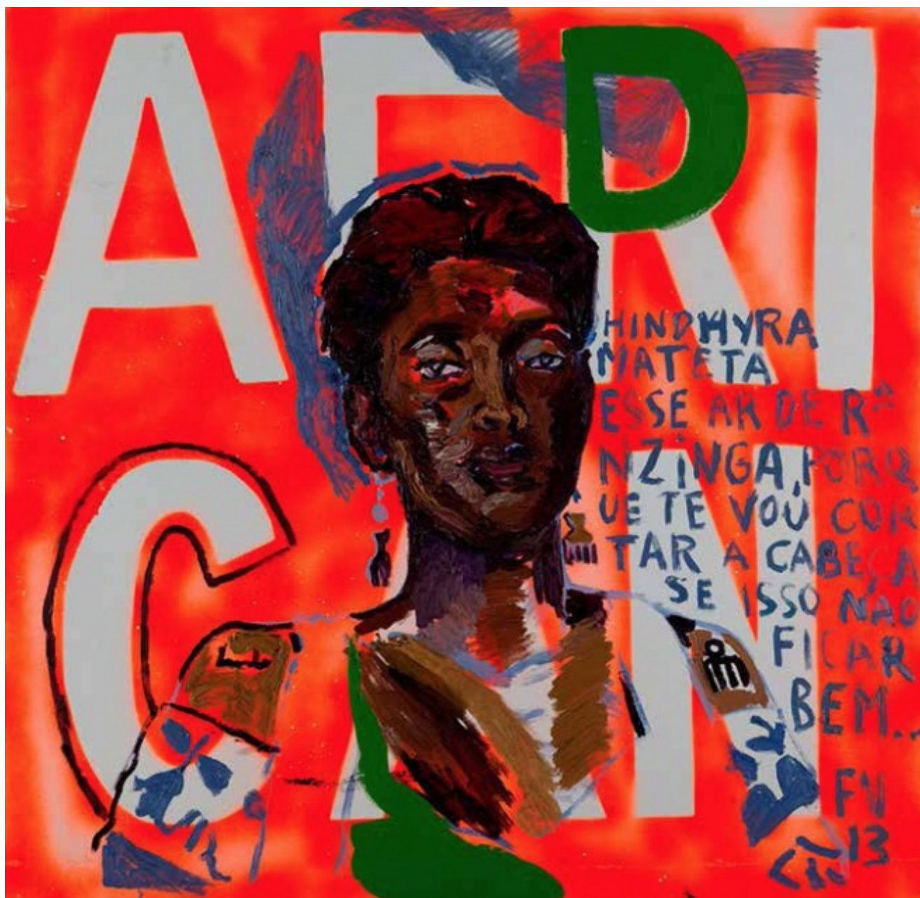
Francisco Vidal. Hindyra Mateta, Luanda, 2013.

Al centro della sua opera è anche l'esplorazione del suo stesso patrimonio culturale. Nato a Lisbona da madre capoverdiana e padre angolano, egli si considera la manifestazione vivente della creolizzazione prodotta dalla storia coloniale, l'incarnazione della fusione culturale di tre paesi diversi, politicamente e storicamente connessi.