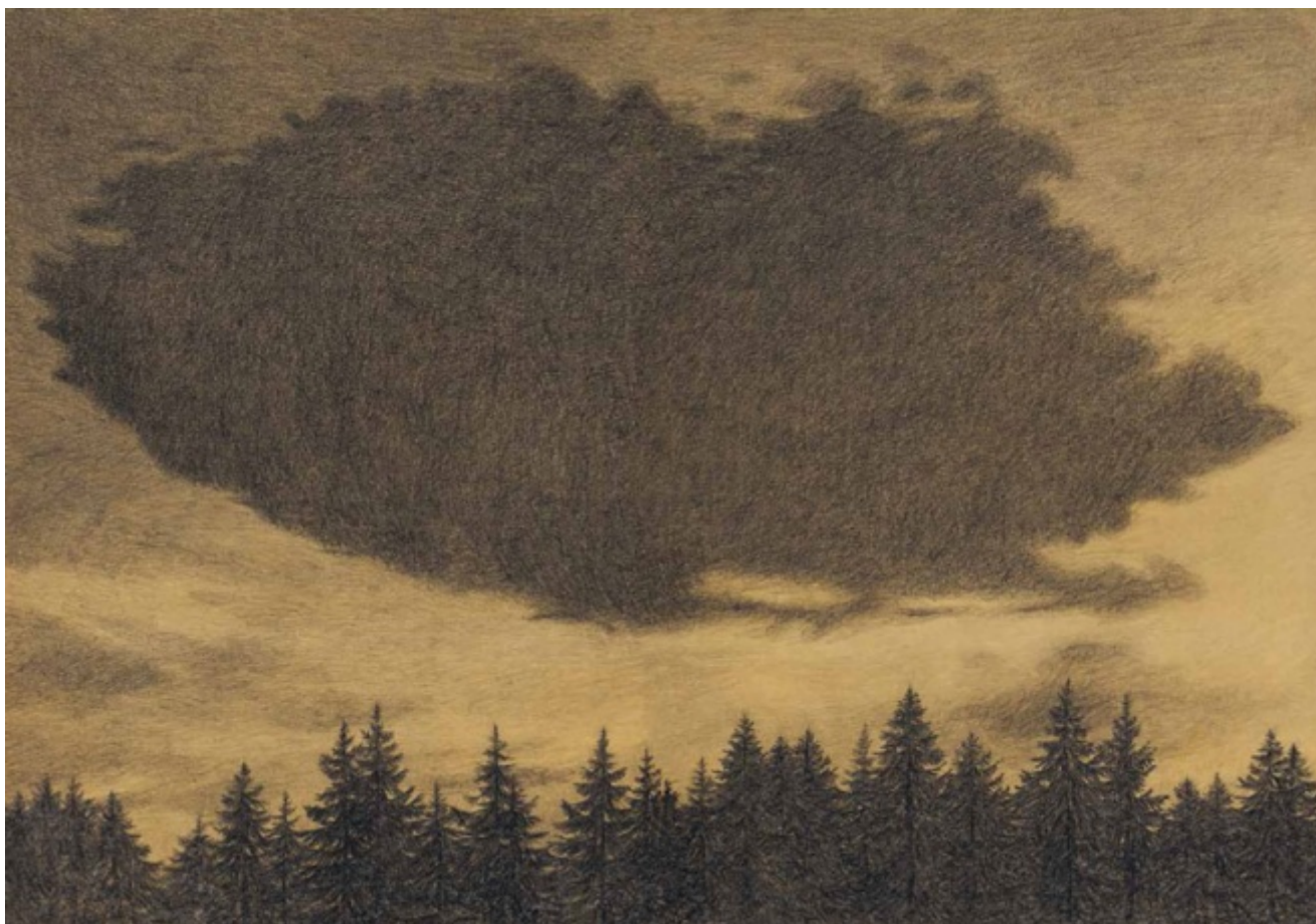
Giovanna Zoboli, Joanna Concejo, C'era una volta una bambina , Topipittori 2015

Ricevo centinaia di riscritture di fiabe o storie mutate dalla fiaba: fra queste solo una parte infinitesimale rivela una comprensione profonda e accurata del genere. La gran parte si perde nelle secche di una idea di magia la cui primaria espressione risiede in un ricorso fideistico e abnorme all'aggettivazione. Si cerca di emulare il fulgore del bruco, non accorgendosi che posto ha la bellezza nella sua strategia vitale. Dunque, lo si fa malamente.