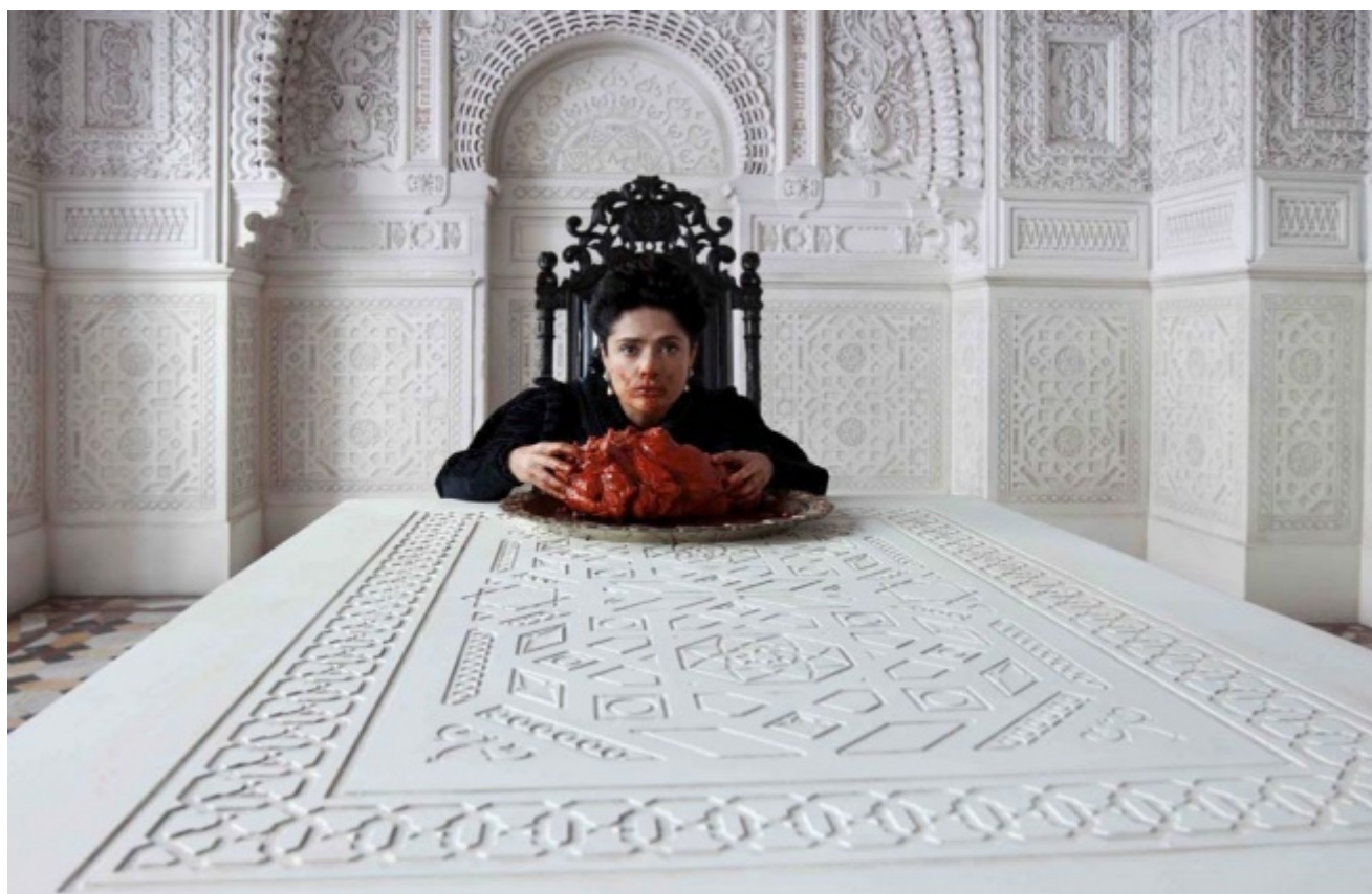
Salma Hayek nel film Il racconto dei racconti , di Matteo Garrone 2015

Mentre stavo scrivendo questo articolo, ho visto al cinema Il racconto dei racconti , adattamento cinematografico della raccolta di fiabe Lo cunto de li cunti di Giambattista Basile, realizzato da Matteo Garrone. La mia impressione è che sia un film clamorosamente non riuscito, sotto tutti i punti di vista: recitazione, sceneggiatura, caratterizzazione dei personaggi, montaggio eccetera. Confesso di essere uscita dal cinema al primo tempo. Ma come è possibile, mi sono chiesta, che persone competenti e preparate come Garrone e la sua troupe facciano un autogol di queste proporzioni, e con una materiale così generoso e ricco quale è la fiaba? Possibilissimo. Anzi, con la fiaba il rischio di sbagliare è colossale. Perché ci sono pochi terreni scivolosi e impervi quanto le fiabe. Facilissimo, infatti, è travisare la loro natura, il loro spirito, capire dove risieda davvero la loro bellezza e importanza che non stanno mai, ma proprio mai in quello che sembra al primo sguardo.