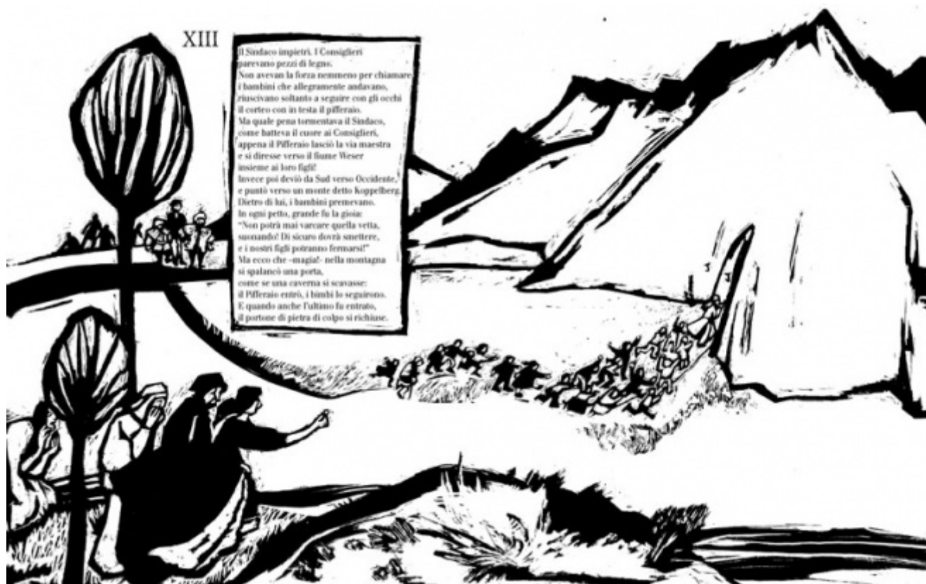
Robert Browning, Antonella Toffolo, Il pifferaio magico di Hamelin , (trad. Umberto Fiori), Topipittori 2008

E tuttavia, in questa caotica fase di cambiamento che contraddistingue la nostra cultura, accanto ai nuovi paradigmi persistono, destrutturati, i vecchi. Così che fra i principali responsabili del fraintendimento della fiaba, per paradosso, si può individuare quel medesimo paradigma vero-falso fondativo della cultura europea. È la separazione fra forma e contenuto istituita da questa modalità di pensiero – per cui la forma, l'estetica, è dominio dell'arte e dell'irrazionale; il contenuto, territorio della morale, della scienza e della verità –, che continua a spingere, a tutt'oggi, a vedere nelle storie di magia, le fiabe appunto, una costruzione fantastica del tutto fine a se stessa, e nel fiabesco, polverizzato nei suoi elementi primari, una scatola di montaggio disponibile per ogni genere di intrattenimento, materiale elettivo per effetti speciali del tutto sganciati da riferimenti di senso. Come se il bruco fosse tale solo per mostrare finti occhi e variegata colorazioni. È in questo contesto che strumenti di consultazione ben congegnati e scritti sulla fiaba e sul fiabesco, capaci di guidare i lettori più o meno esperti in un ambito tanto vasto, variegato e scivoloso, si rivelano di importanza determinante.