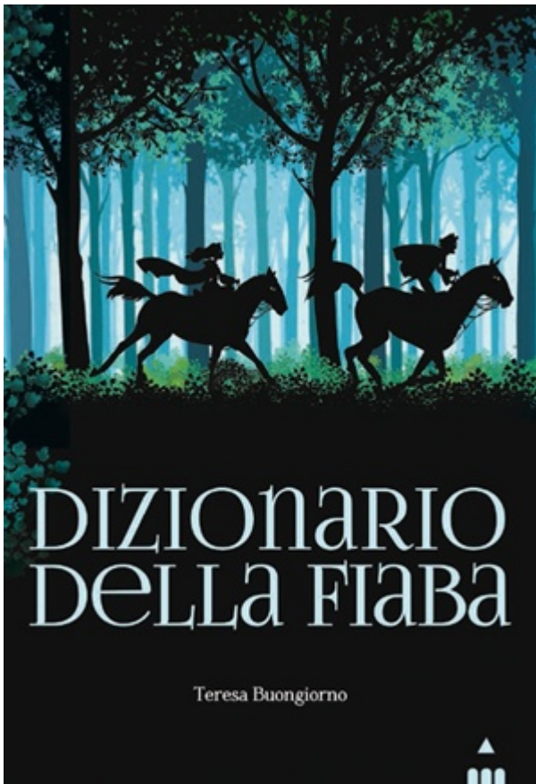
Dizionario della Fiaba, Edizioni Lapis 2014