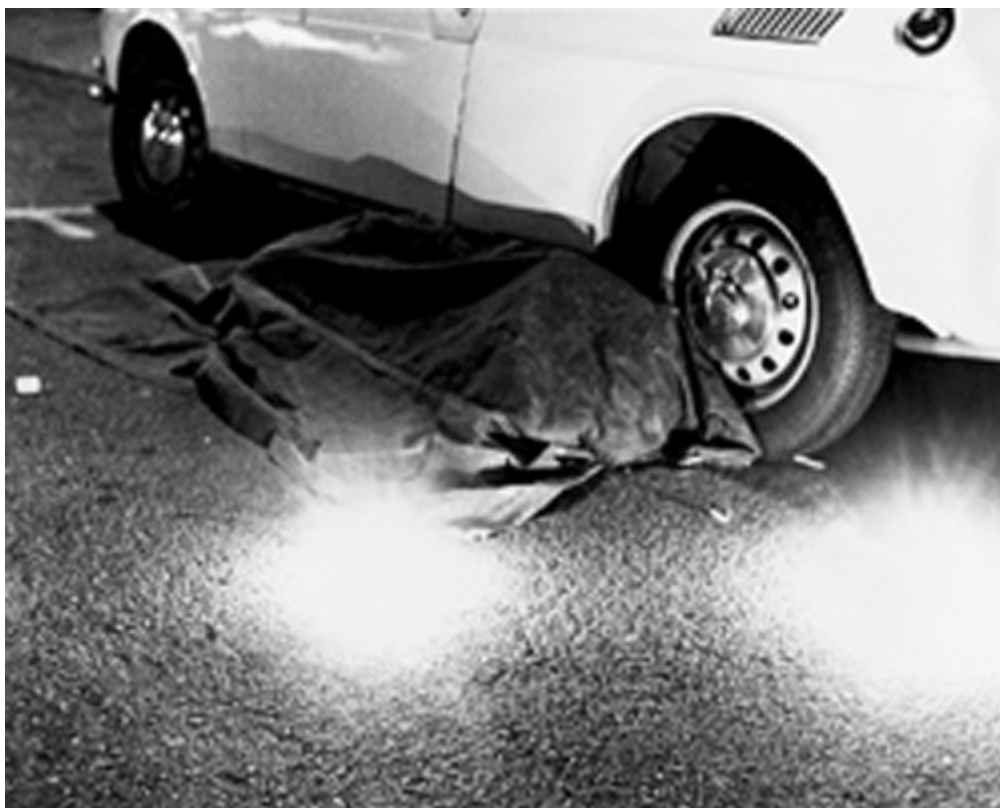
Chris Burden, Dead Man , 1972

Ora, a ben vedere, persino Shoot è meno plateale di quanto sembra sulle prime: l'unico documento che ci resta, il filmino amatoriale in super8 girato con disinvoltura dall'allora compagna dell'artista, è a bassissima definizione, in gran parte senza immagini, con poche voci sullo sfondo ("...know where you're gonna do this Bruce?"). Pochissime anche le foto in bianco e nero. Fedele alla forza negativa della sottrazione, le sue azioni più estreme, di cui pochi sono stati testimoni, furono orchestrate così. Più numerose di quanto possa riassumere qui, Kristine Stiles ne ha contate quindici tra il 1971 e il 1982.