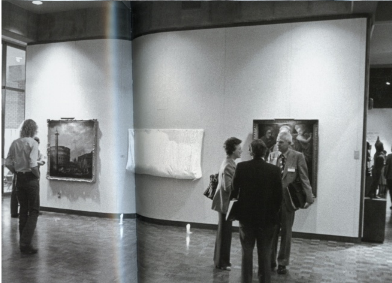
Chris Burden, Oh Dracula, 1974