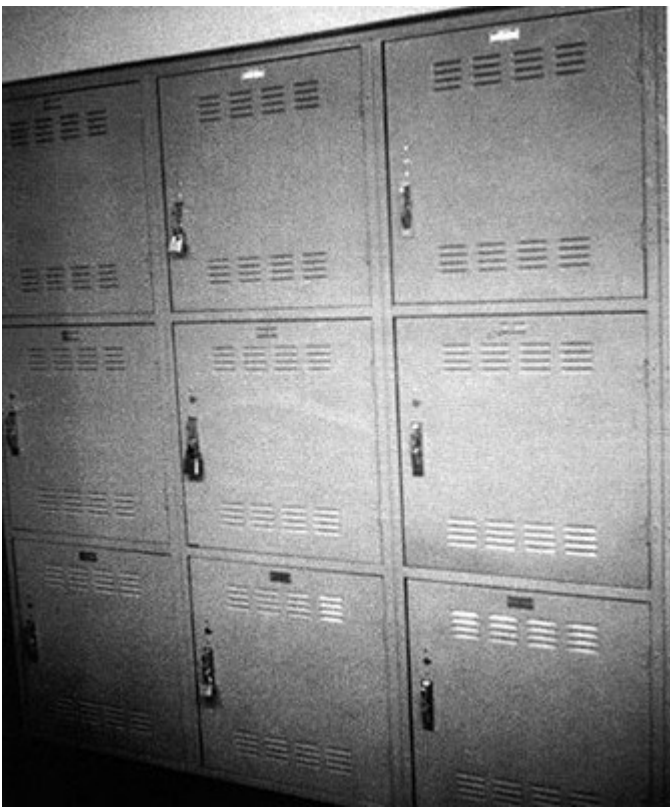
Chris Burden, Five Day Locker Piece , 1971

Oh, Dracula non è isolata nell'operato di Burden ma ne sviluppa con grande maturità e coerenza alcune intuizioni. Nel 1971, per ottenere il diploma di master a Irvine, restò cinque giorni (26-30 aprile) chiuso dentro un armadietto di 60x60x90 cm ( Five Day Locker Piece ). Nel 1975 restò disteso all'interno di una piattaforma triangolare ed elevata alla Ronald Feldman Gallery di New York ( White Light/White Heat ) per 22 giorni (8 febbraio-1 marzo) – immobile, isolato, invisibile, muto e a digiuno tranne un bicchiere di succo di sedano al giorno. Lo spettatore inavvertito che entrava nella galleria poteva pensare a una mostra minimalista alla Robert Morris. Ma la struttura sospesa a 60 cm dal soffitto somigliava meno a una scultura che a un cassetto. Era uno spazio abitato da una presenza nascosta, da un fantasma.