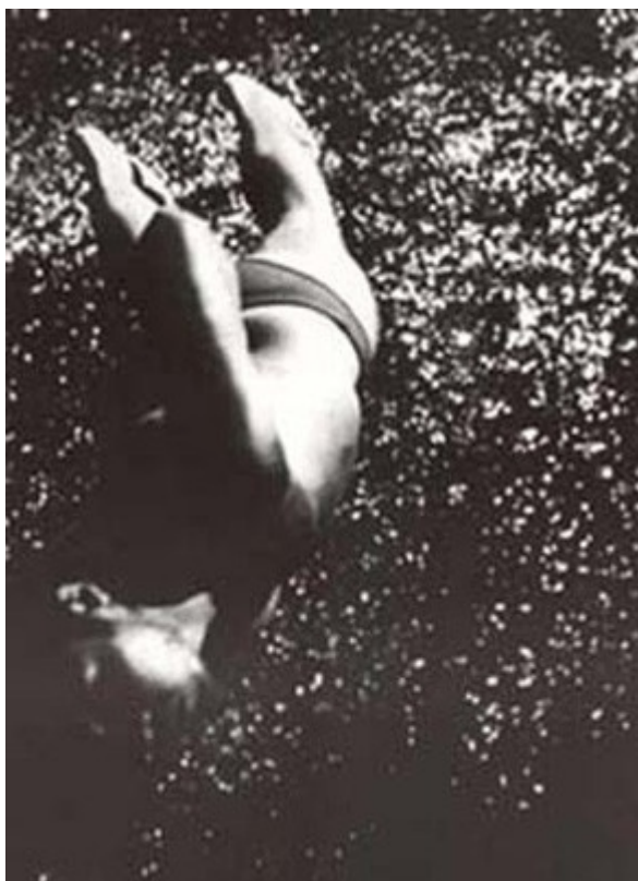
Chris Burden, Through The Night Softly , 1973

Solo più tardi mi sono convinto che il cuore delle azioni di Burden è lontano dalle prime impressioni suscitate da Shoot e Trans-fixed , e che è da cercare piuttosto nella scomparsa, nell'invisibilità e nell'assenza. In Burden la body art è indissociabile dall'aspetto concettuale, come lo è l'azione dal protocollo. Shoot ha bisogno del white cube della galleria: è qui e non in un poligono che si è sparato contro un artista.