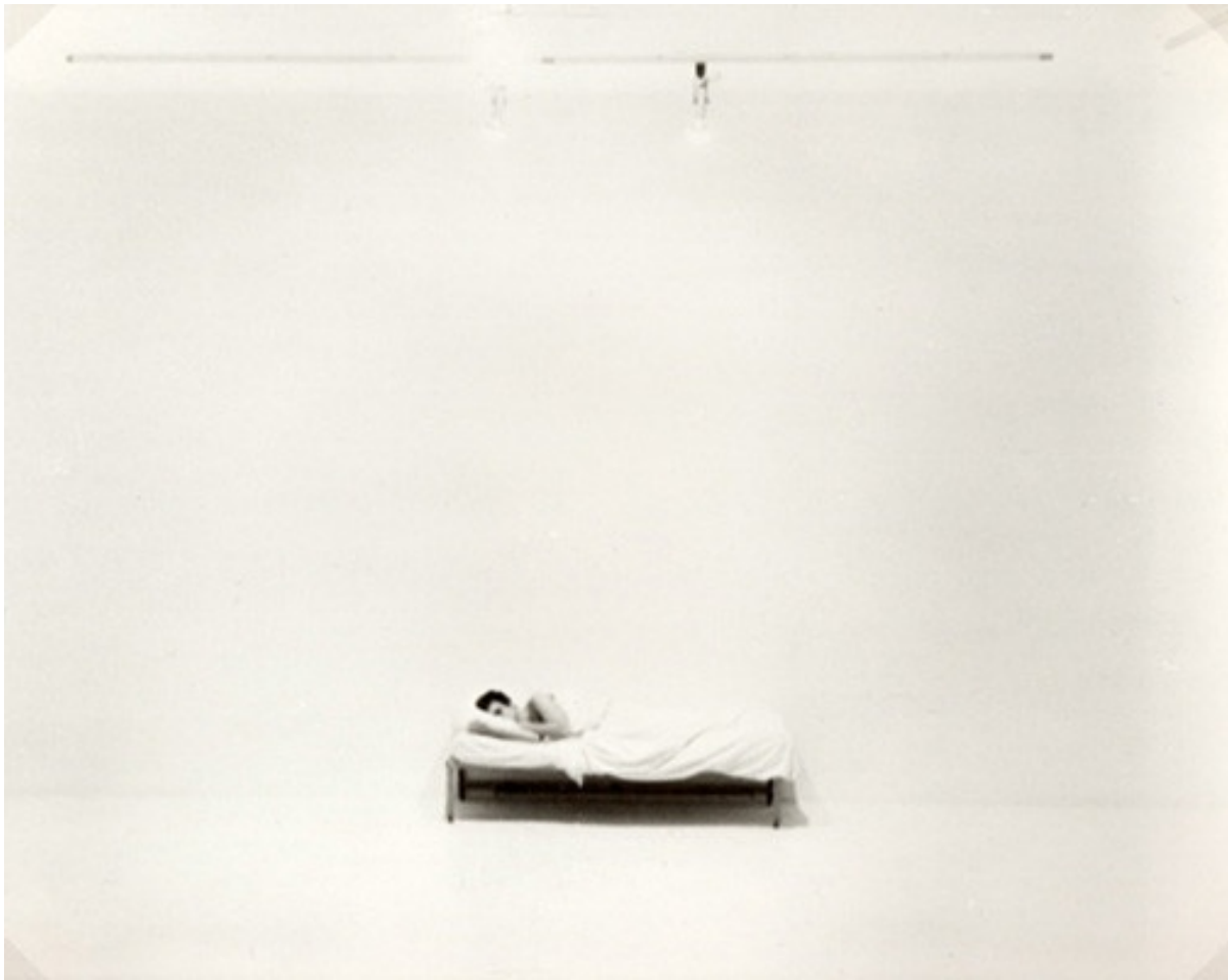
Chris Burden, Bed Piece , 1972

sinistro senza anestesia, durante i nove mesi di convalescenza si avvicinò alla fotografia. E nel 1972 piazzò un letto singolo con le lenzuola bianche in una galleria, restandovi ventidue giorni senza aprire bocca ( Bed Piece ).