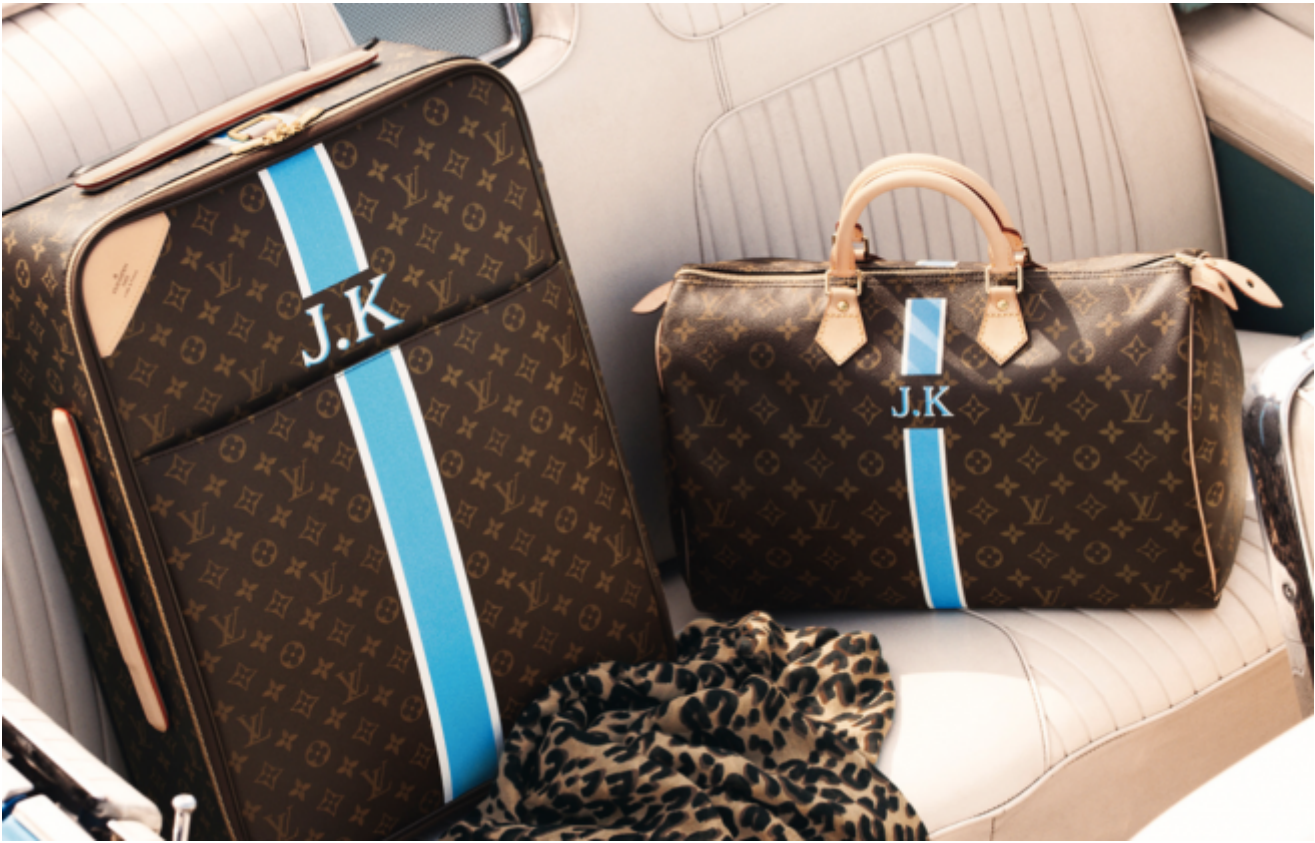
Monogram Louis Vuitton

Stesso discorso vale per Louis Vuitton, noto come Gucci per il suo monogram, che permette di personalizzare borse, portafogli, e valigie, con l' hot stamping e la pittura a mano, utilizzata agli albori della Maison di lusso, in origine specializzate nella costruzione di bauli e pelletteria da viaggio che venivano arricchiti dalle cifre dei nobili acquirenti. Nella contemporaneità dei voli low-cost, in cui il bagaglio è soggetto a restrizioni di dimensioni, peso e chiusura TSA, sembra anacronistico viaggiare con set d'antan, ma i sempre presenti selfie o foto dei look aeroportuali delle dinamicissime fashion blogger ci informano che ancora oggi è un trend, o almeno una delle tante affermazioni identitarie anche se, afferma laconicamente Lina Sotis, “non c'è niente di peggio di quelle madamine che viaggiano con un intero set firmato”. Grazie a Gucci e Vuitton le iniziali dei clienti si fondono con i monogram registrati, generando un loop di brandizzazione, in moto perpetuo dall'oggetto di moda al sé, che giustappone identità e valori nel segno della riconoscibilità a tutti i costi anche ai tempi di Anonymous e della privacy (il-)legalizzata.