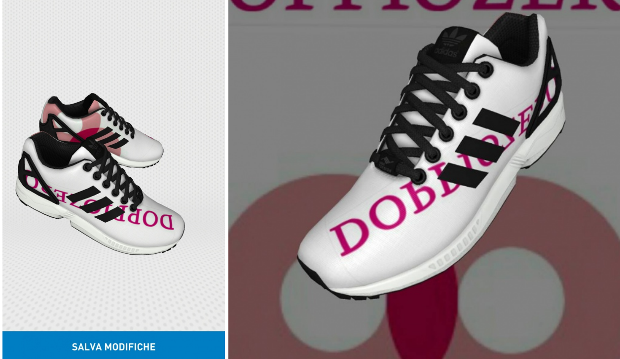
Adidas ZX Flux doppiozero

Infatti, Anya Hindmarch, designer britannica di accessori di lusso, ha lanciato gli stickers di pelle per consentire alla clientela di personalizzare qualsiasi cosa con lettere dell'alfabeto ed emoji e renderle vere e proprie opere d'arte pop. Dai fashion blogger deputati a ingolosire il pubblico, sono molto usati gli adesivi a forma di hashtag o di chiocciola seguite dalle iniziali o dal nome, proprio o del blog, ricreando una trasposizione del discorso di moda online sui suoi stessi oggetti.