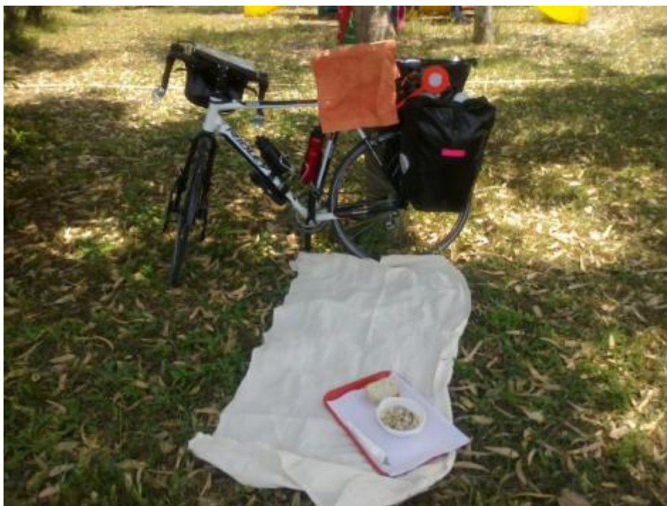
Sotto i voli di Fiumicino.