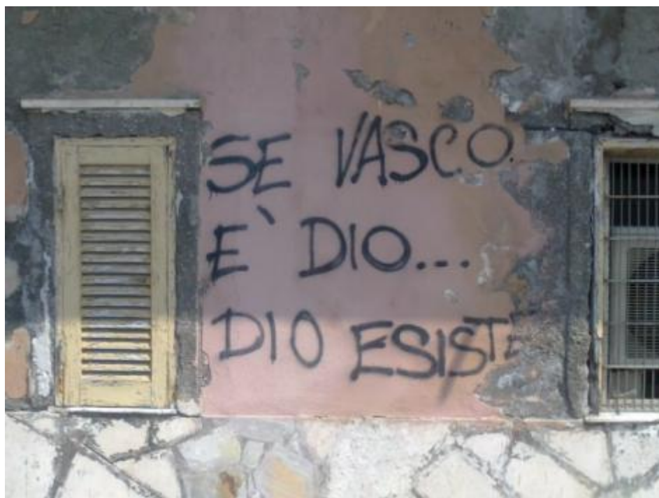
Se Vasco è Dio...Dio esiste. Ad Anzio.