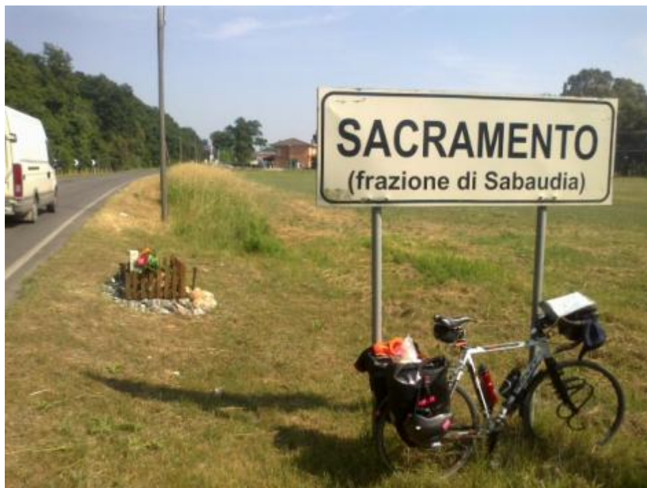
Sacramento a Sacramento.