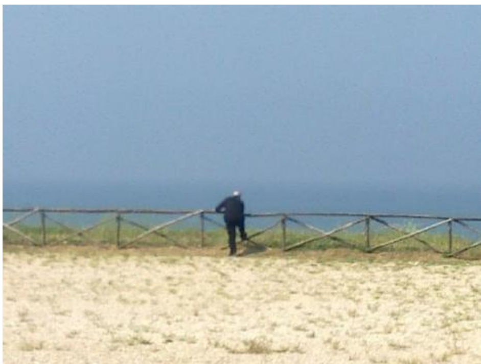
Telefonare sulla via del Circeo.