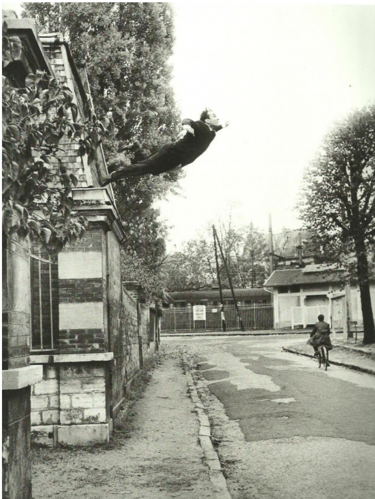
Yves Klein, Volo nel vuoto, 1960