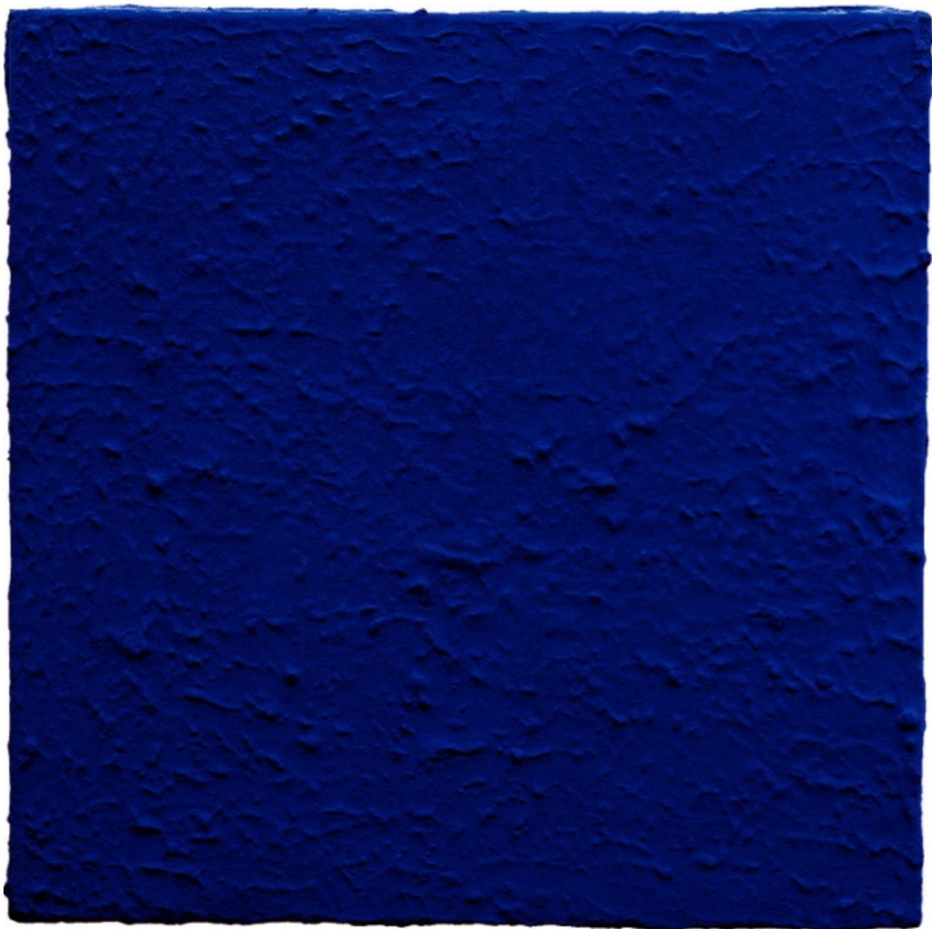
Monochrome bleu sans titre, (IKB 190), 1959

Simili reazioni ostili si produssero in patria. Fa eccezione solo il teutonico Gruppo Zero, che lo aveva preso in simpatia, e qualche italiano arcistufò dell'Informale. Questa situazione non sorprende: non appena ci si avvicina all'arte di Klein – alle opere quanto al personaggio – si è costretti a gestire una serie di impasse: “da una parte il monocromo metafisico e l’approccio solenne al vuoto; dall’altra le performance che parodiavano la solennità, l’ironia decostruttiva, le buffonate da clown”, riassume McEvelley che insiste sulla polarità Malevich/Duchamp, dai quali Klein tenne un’equa distanza se non un oculato, strategico disinteresse.