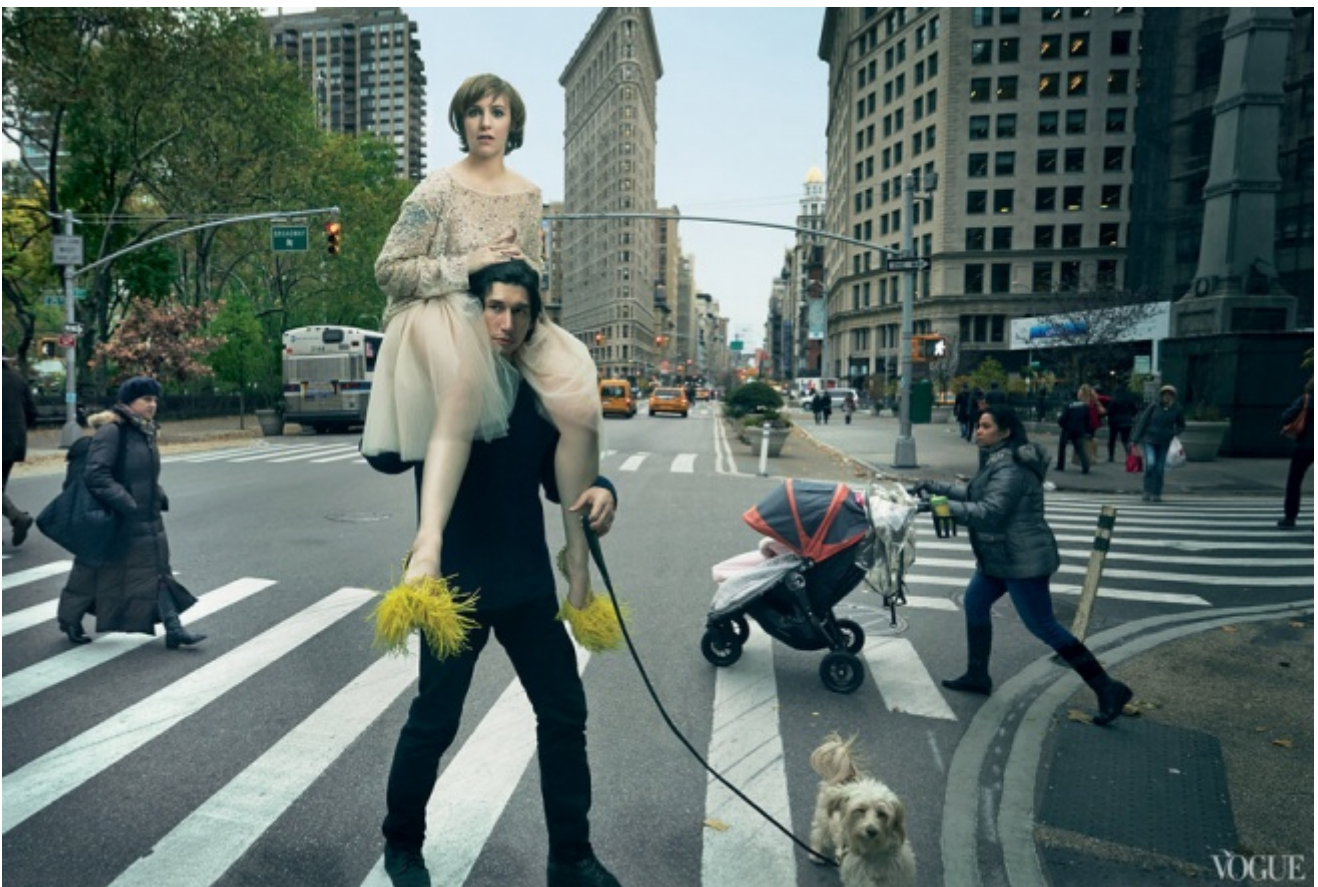
Lena Dunham su Vogue, febbraio 2014

sgraziata: un modo per affermare che oramai le persone sono perfettamente consce di essere guardate e sanno comportarsi di conseguenza. Così quando l'anno scorso Lena Dunham è comparsa su Vogue nelle immagini pesantemente photoshoppate di Annie Leibovitz, alle accuse di tradire il suo impegno nel rivendicare una visione meno rigida del corpo femminile – proponendo scene di sesso realistiche fra corpi imperfetti nella sua serie tv Girls – ha risposto «A fashion magazine is like a beautiful fantasy», ha solo riconfermato la preferenza contemporanea di sembrare inautentici come i protagonisti delle riviste patinate, senza dover rivelare all'obiettivo parti di noi troppo sincere; a riprova di una ribellione sociale che pretende di poter essere tutti ugualmente piacenti.