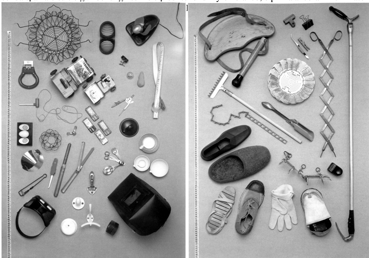
Oggetti di designer senza nome, dalla collezione di Achille Castiglioni

Già in Tubino, che era una sfida tecnica, una lampada fatta di pochissimo – affermazione coerentissima nella ricerca di una plasticità in cui si intrecciano efficacia e sintesi – e che pure resta per noi un curioso serpentello da tavolo, che si fa avvertire come personaggio teso, nervoso, qui ammansito per incanto: presenza attiva nel paesaggio della scrivania, questo oggetto è abbastanza trasparente da non imporsi al guardare ma afferma anche, con decisione, nella virtù della dimensione corretta, la propria giusta parte. E non è lo stesso, quando il progetto ripesca nel bric-à-brac delle tecniche, o quando più raccoglie il portato dei linguaggi, il repertorio pop dei fumetti o dello sport, senza citarne alla lettera le forme o i segni come avrebbe fatto il Liechtenstein pittore – al più riprendendone alcuni con sobrietà e ironia leggera? Quando, quasi riflettendo le attenzioni di Dorflès, il design trae dal lessico figurativo di una fantascienza che è diventata immaginario condiviso: si ricorda Allunaggio, verde sgabello da giardino che poggia come ragno o sonda spaziale su tre gambe lunghissime e piedi tondi di nylon bianco; e prima ancora il Luminator dalle