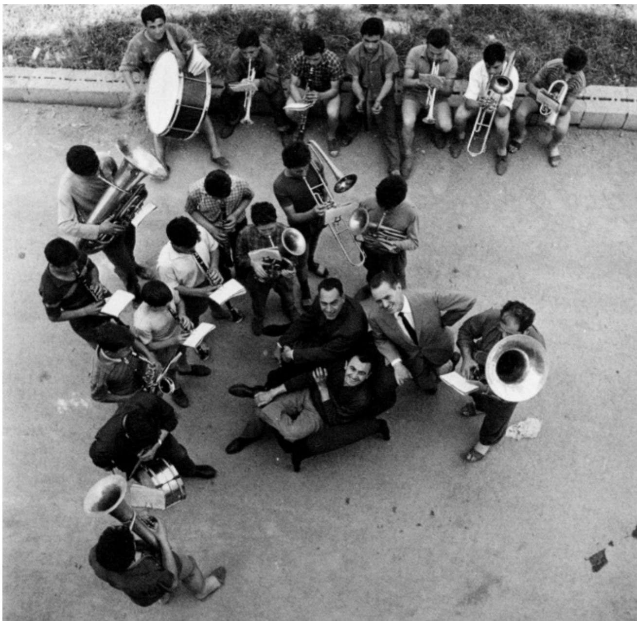
Festa per la nascita della poltrona Sanluca, con i ragazzi di don Marella