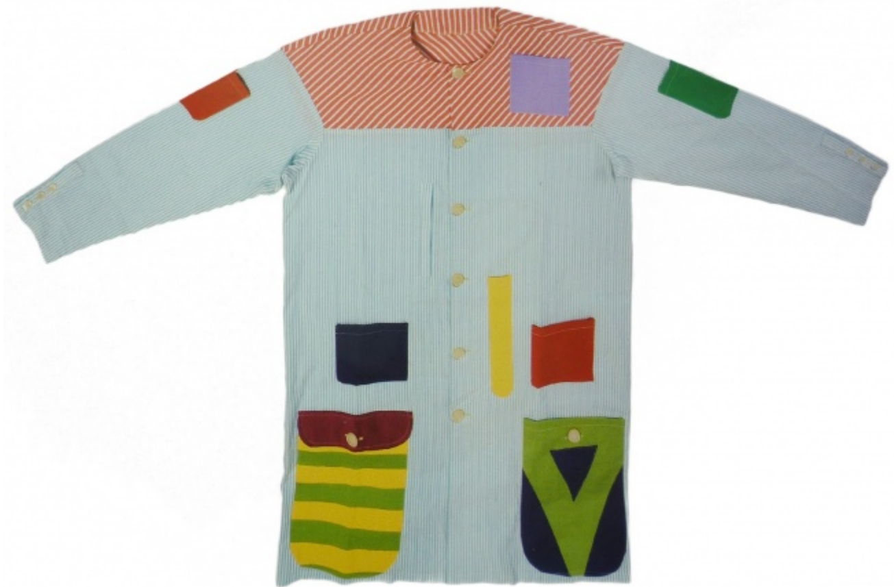
Il grembiule di Achille Castiglioni, design di A. Castiglioni e Max Huber

Tra le pagine del catalogo per un Museo del design italiano secondo Mendini, anno 2010, si trova un vestito a colori dalla foggia bizzarra: l'abito da designer di Achille Castiglioni. Come quello di un Arlecchino futurista, deperiano, è fatto di ritagli e sfridi ricuciti: camicia da lavoro che, derogando la serietà ingessata del professionista, funziona come astuccio esteso, a cingere, ad avvolgere il corpo di tasche e taschini, ed è capace di custodire addosso al designer, pronti all'uso, gli strumenti del mestiere. Capace anche – almeno idealmente, secondo un rituale non si sa quanto atteso – di introdurci allo spirito che gioiosamente dava il tono al lavoro nello studio-bottega; di inaugurare come spazio-tempo propriamente scenico – di teatro, di spettacolo meraviglia – quello che i designer abitavano come il luogo più proprio.