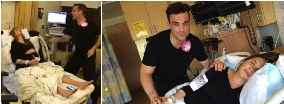
Robbie Williams durante e dopo il parto della moglie

Il mondo virtuale fa parte quindi della realtà in cui gli adolescenti navigati cresceranno, ancor prima che vengano al mondo, contribuendo a determinare importanti ricadute sul rapporto con i genitori. Questi aspetti dello sviluppo tecnologico fanno da cornice ai cambiamenti che riguardano sia il ruolo paterno che quello materno. La partecipazione di entrambi i genitori alla gestazione e alla nascita dei figli, animata dalle nuove tecnologie, è già di per sé una straordinaria novità, nutrita e sostenuta da tutta una serie di comportamenti nuovi, un tempo impensabili, che fanno ormai parte del repertorio del padre contemporaneo, davvero lontano dalla figura simbolica di un tempo. Si potrebbe dire che tutto ha inizio a partire dalla partecipazione del padre ai corsi pre-parto; la sua figura è programmata e accolta, anche se, come avremo modo di approfondire, talvolta sottoutilizzata e marginalizzata. Non sono più solo le mamme a dover essere «formate» nel percorso di avvicinamento alla nascita, ma anche i papà, che saranno presenti e partecipi nelle ore del travaglio, in sala parto e nelle prime cure al bambino.