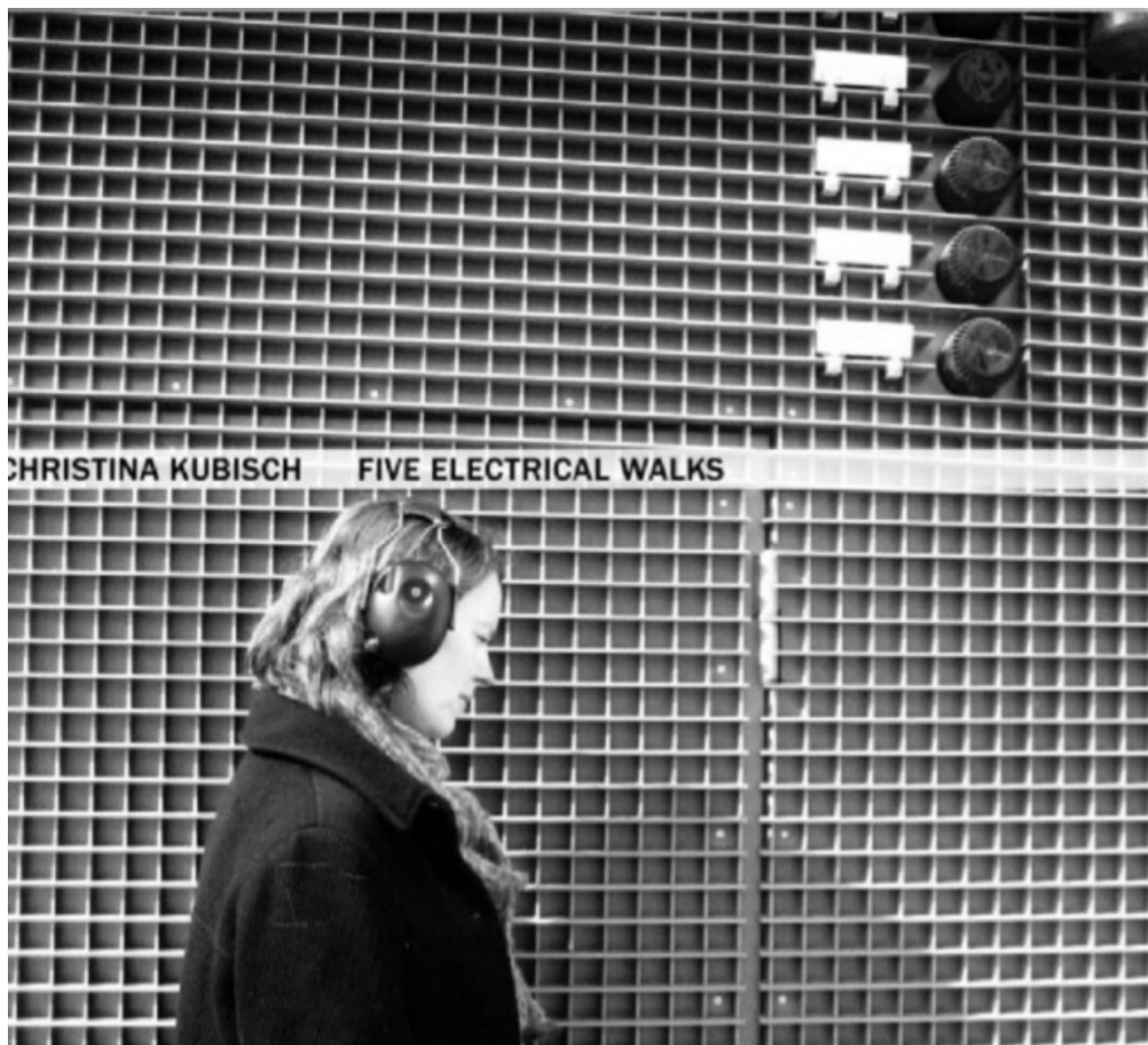
Five Electrical Walks, 2007

Solo negli anni novanta questo tipo d'esperienza d'ascolto esce dalla galleria d'arte per espandersi nelle città fino a diventare una pratica quasi esclusiva del suo lavoro artistico, tanto che il suo sito recensisce, tra il 2004 e il 2013, ben 47 Electrical Walks . Anche all'aperto il principio rimane lo stesso. Camminare per le strade della città prestando attenzione, ascoltando, le manifestazioni elettromagnetiche che le particolari cuffie sulle orecchie ci permettono di percepire e scoprire.