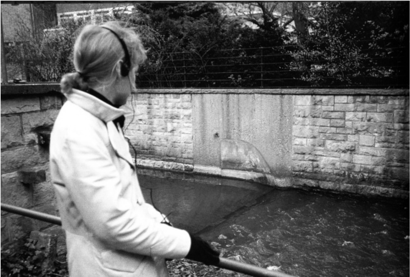
Janet Cardiff in ascolto, Münster 1997