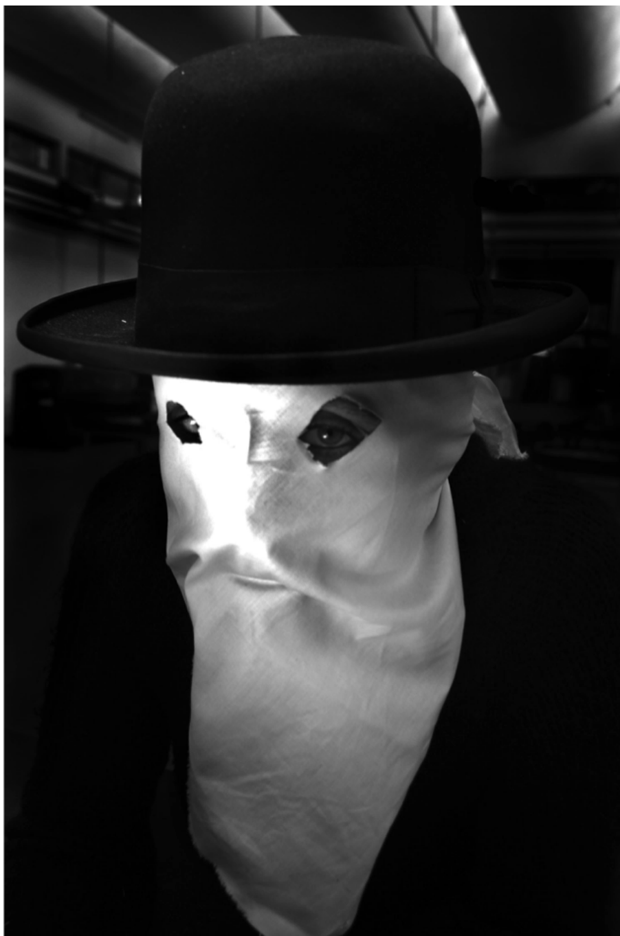
Tra un'ora e 12 minuti, Lars Norén, foto di scena