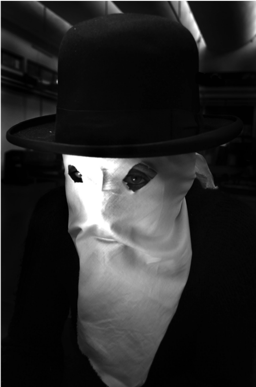
Tra un'ora e 12 minuti, Lars Norén, foto di scena

Sono un uomo in fuga dalle appartenenze e questa è una mia debolezza ed è anche una responsabilità dolorosa. Ho un bel leggere le Lettere luterane di Pasolini: io mi trovo lontano mille miglia dal suo essere impegnato, dal suo vivere la poesia, anche nelle azioni. Io gioco con le cose, in questo aiutato dalla mia non appartenenza gelosamente difesa, gioco con prospettive e punti di vista, con le opinioni, dopotutto sono un uomo di teatro, abituato alle maschere. Sono un privilegiato. La distanza rende più lucido lo sguardo, rende più liberi. Anche la Jelinek gioca, certo in un'altra categoria, ad altissimi livelli, e difatti il suo "Vorrei