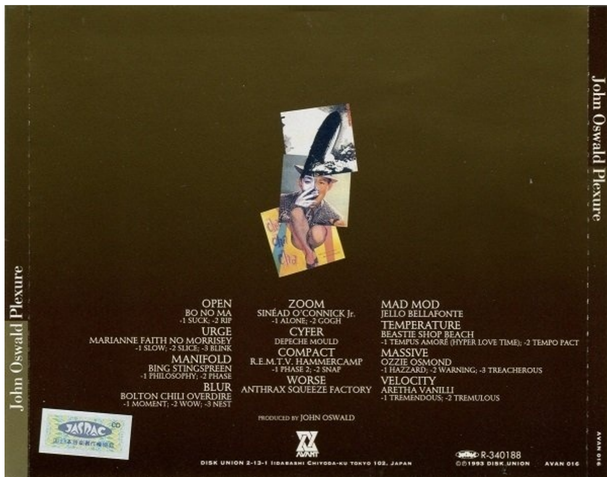
Verso del CD Plexure 1993

Comunque il processo che Oswald ha dovuto affrontare contro la CBS non ha avuto che degli inconvenienti. Infatti la giapponese Avant Record, fondata da John Zorn prima della nascita della Tzadik, gli ha proposto una collaborazione che si concluderà con l'uscita di Plexure (1993), nel quale Oswald aveva deciso di provare a includere in uno stesso disco tutti i nomi della pop music emersi tra il 1982 e il 1992, il primo decennio del CD. Se in Grayfolded Oswald dilata Dark Star , in Plexure comprime. Plexure è un condensato, un 'riassunto' degli standard del primo decennio d'esistenza del CD. Comprimere, espandere: il movimento temporale del respiro.