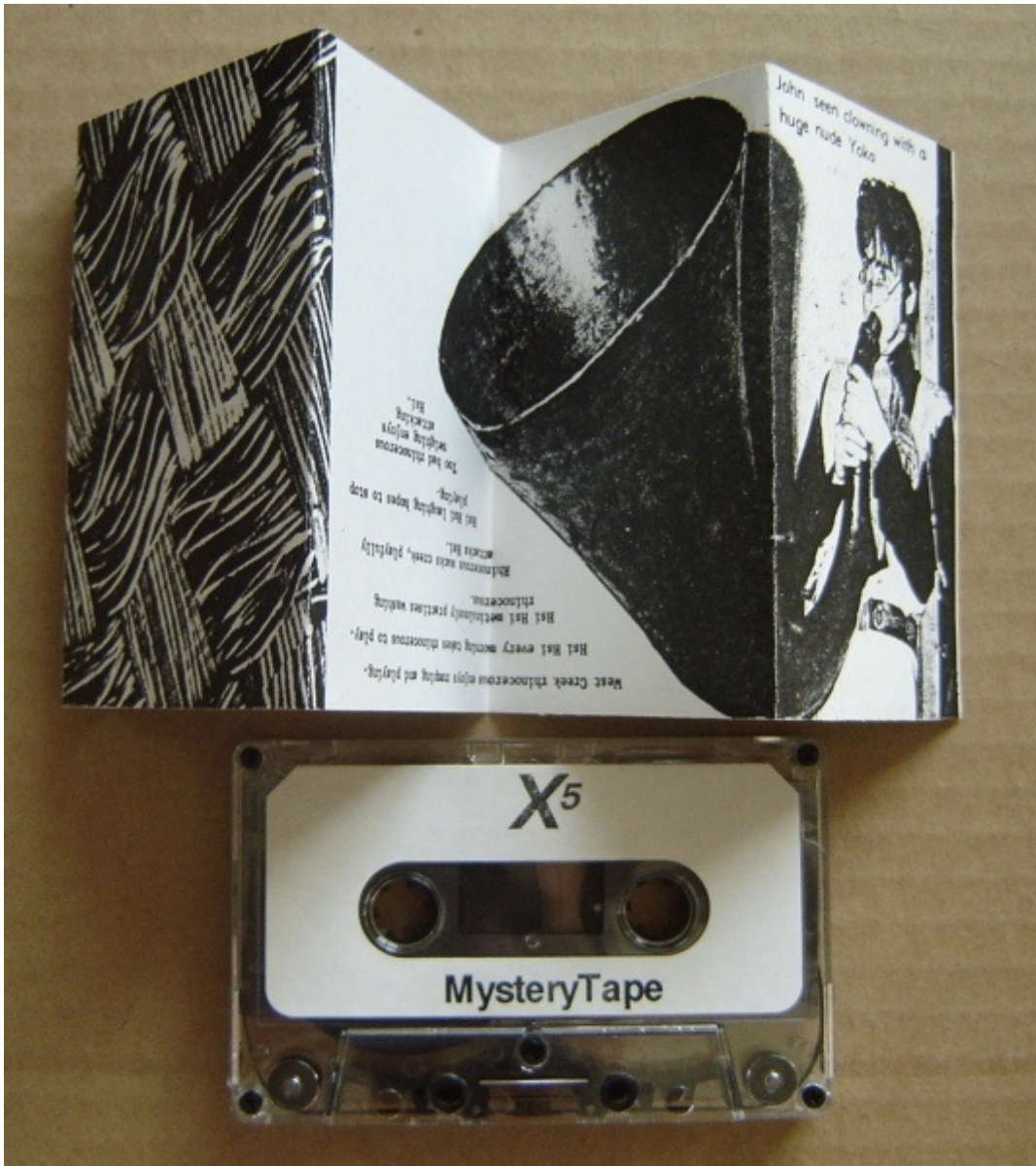
Mystery Tape Laboratory, s.d.

Probabilmente la vera ragione della molteplicità dei nomi d'autore e dell'instabilità, della moltiplicazione, delle versioni è da ricercare nel rifiuto dell'unicità, nella perdita d'identità, dell'autore, e nell'utopica ricerca di una sorta d'autore collettivo. In questa prospettiva le plunderphonics , nel loro uso di un materiale sonoro alla portata di tutti, sono anche il rifiuto del virtuosismo dello strumento. Il sogno, solo in parte naif, di poter produrre suoni organizzati senza dover passare attraverso le forche caudine dell'apprendimento dello strumento. E infatti da più di un secolo la tecnologia, che permette di 'fissare', riprodurre, trasportare e manipolare i suoni, consente questo tipo di esperienze sonore, e, attraverso la manipolazione, dà accesso direttamente al suono, come se questo fosse materia non fissata una volta per tutte ma plasmabile all'infinito.