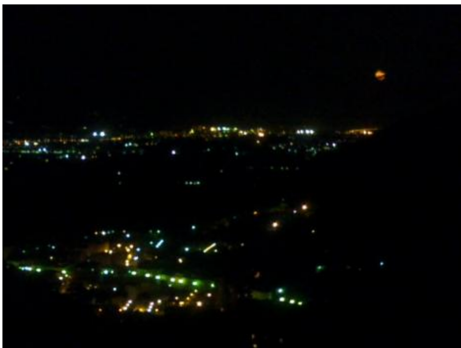
Magra di notte.