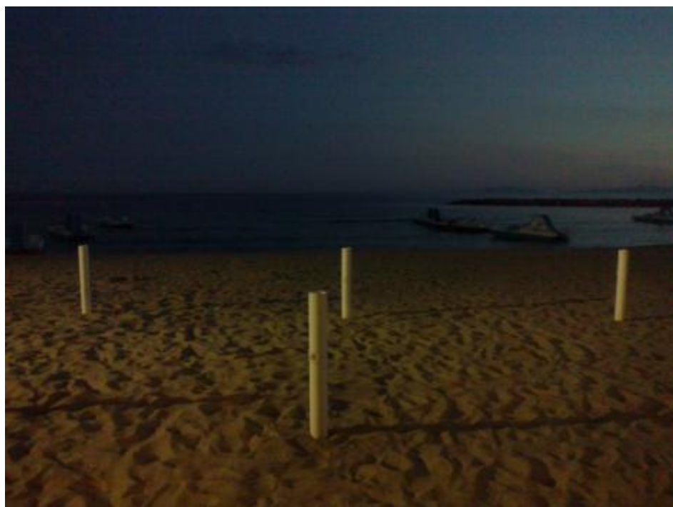
Ombrelloni a Follonica.