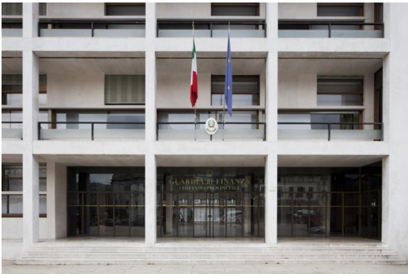
Giuseppe Terragni, ex Casa del Fascio, Como, 1932-36

Aggiro il centro, mi lascio alle spalle l'abside del duomo, supero la ferrovia e resto a contemplare la facciata della Casa del Fascio. C'è ancora qualche guida che la chiama, con un pudore che suona falso, Palazzo della Guardia di Finanza. L'adesione al Partito Nazionale Fascista determinò la sfortuna critica di Terragni, una sorta di onta incancellabile nella generazione storiografica del dopoguerra. Ridicolaggini. Non solo perché quella di Terragni fu una adesione imposta dall'alto, che accettò più per quieto vivere, all'italiana ; non solo perché, nei fatti, anche promulgate le leggi razziali, non smise mai di frequentare amici, intellettuali e artisti ebrei; non solo perché, morto nel '42 al ritorno dal devastante fronte russo, non poté come molti altri "ex-fascisti" riscattarsi vivendo gli anni della Resistenza, ma semplicemente perché, su tutto, la sua fu una architettura, qualunque fosse la sua intima ideologia politica, naturalmente lontana dalla retorica di regime.