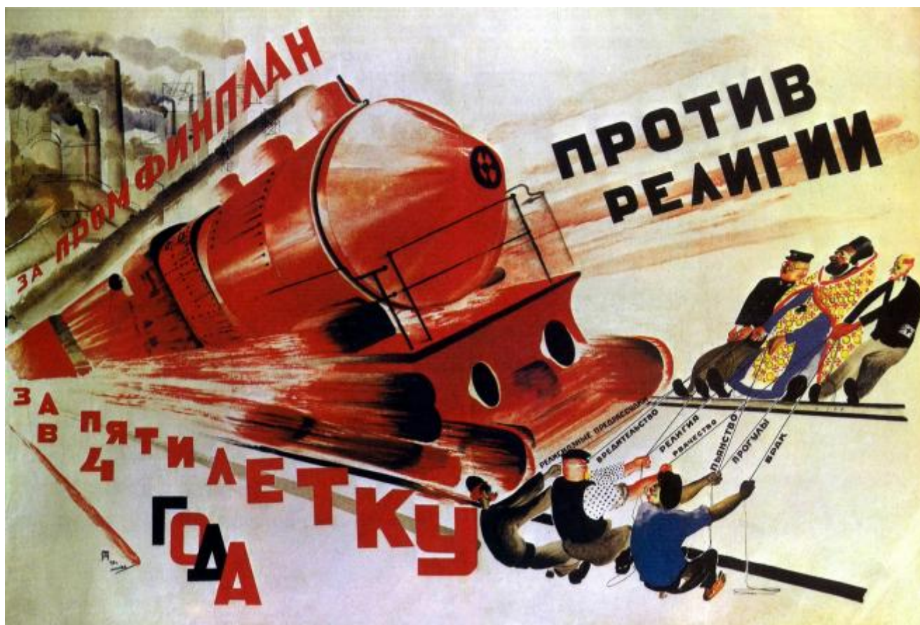
Pimenov, Contro la religione, piano quinquennale in quattro anni!, 1930

Ma se il nemico del popolo era il padre, il marito, il figlio, il compagno di lavoro, come si faceva a non dubitarne?