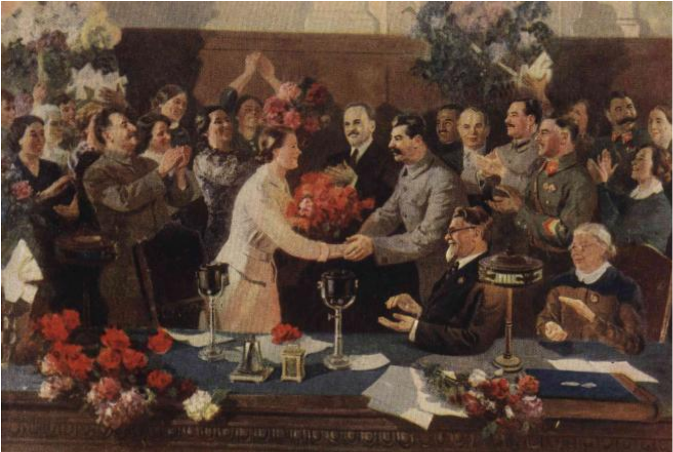
Efanov, Incontro indimenticabile.jpg

o ascoltare musica straniera, Internet non è ancora stato chiuso.