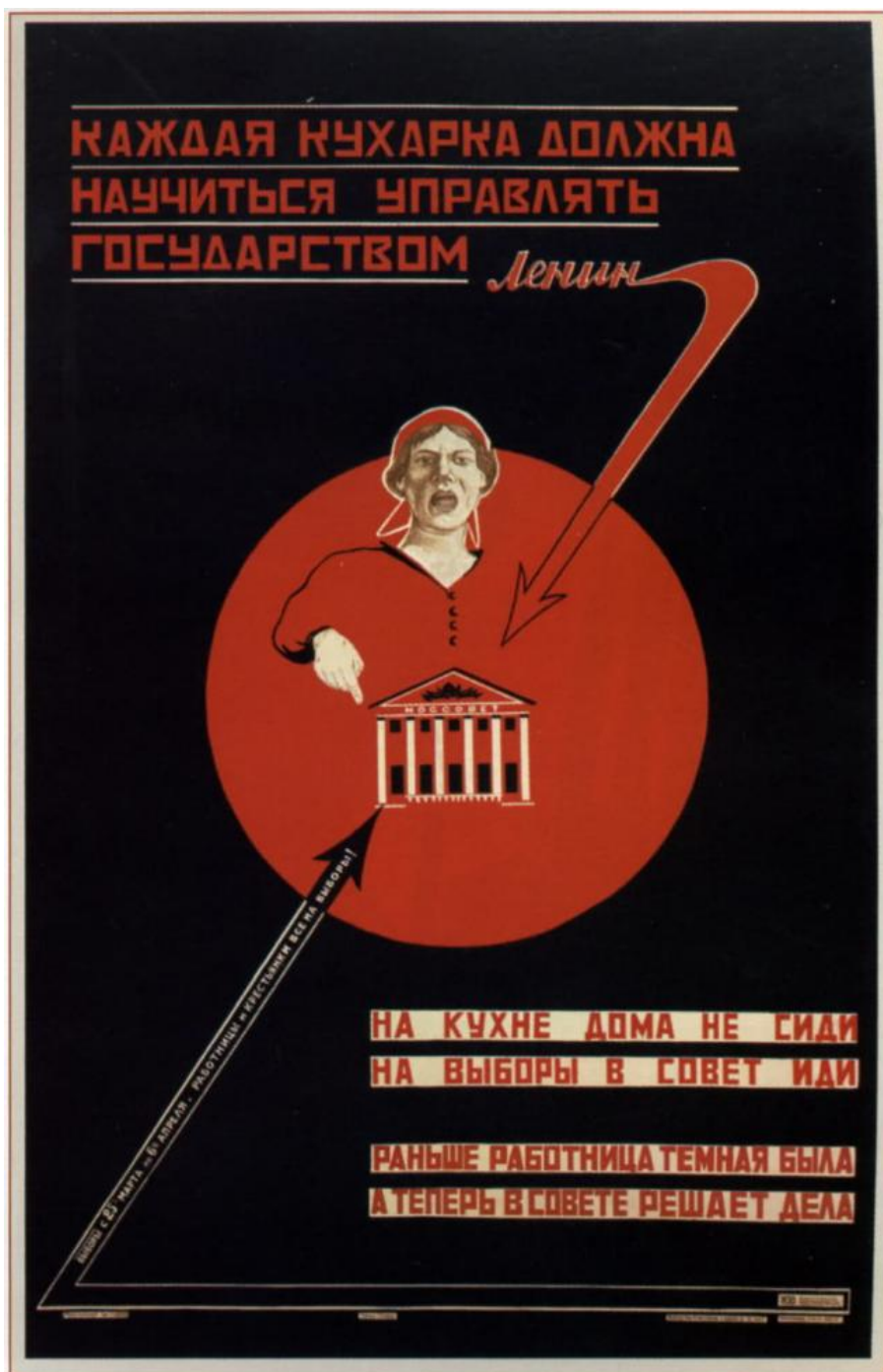
Ogni cuora deve imparare a governare, Lenin

Pensa al monaco-politicante Rasputin, al poeta Esenin, a Vysockij, il cantautore degli anni settanta, erano tutte figure di maschilità prorompente. Rasputin “guariva” tutte le dame di Pietroburgo, accoppiandosi con loro, e da lì la leggenda che avesse un fallo immenso. Adesso nel Museo dell’erotismo a Pietroburgo è esposto il vaso che contiene il pene di Rasputin; in realtà è un cocomero di mare e la gente va a vederlo e fa finta che sia il fallo di Rasputin. Putin ha investito anche su queste eredità. Nel momento in cui il discorso sul “gender” si diffondeva in Russia, queer e altro, mettendo in discussione la visione convenzionale della virilità, prontamente compare l’immagine di Putin che salva il cameraman dalla tigre siberiana, che si fa fotografare a petto nudo con fucili e canne da pesca, porta i suoi ospiti, Berlusconi compreso, a caccia sulla neve con i colbacchi e a fare la sauna, la banja , altro rito maschile in cui la complicità maschile, il male bonding , trionfa.