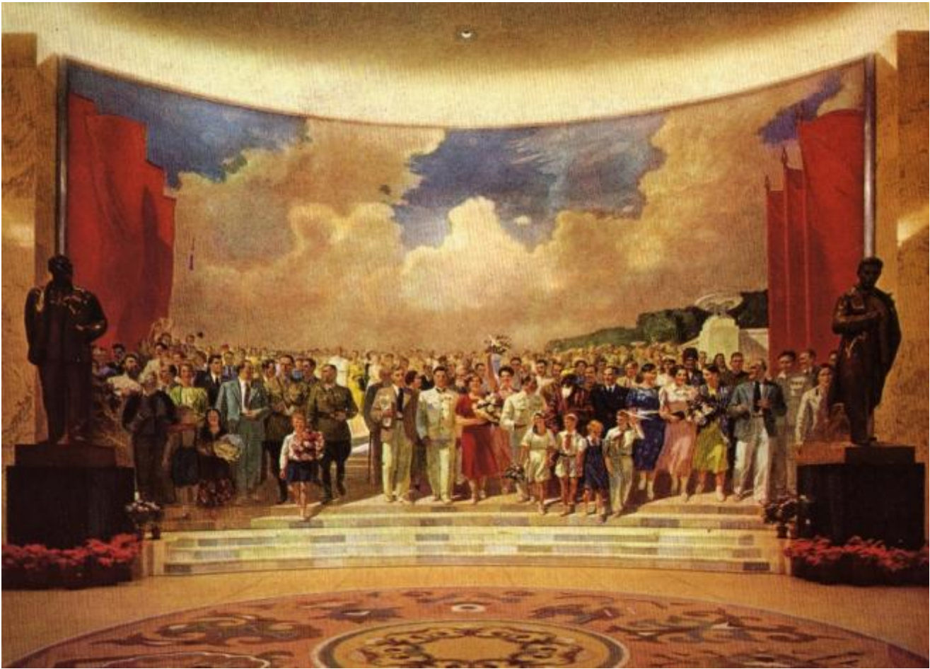
Efanov, I migliori rappresentanti del paese dei Soviet, 1939

Per far capire di cosa si occupa questo studioso, basta elencare alcuni temi affrontati in questi due libri: le icone popolari sovietiche, la storia di un celebre manifesto sovietico dalla Seconda guerra mondiale sino alla fine dell'Urss e oltre, le fotografie di Stalin usate dalla propaganda; e ci sono capitoli sulla cultura del corpo nella Russia comunista e sulla coppia Madre Volga e Padre Stalin.