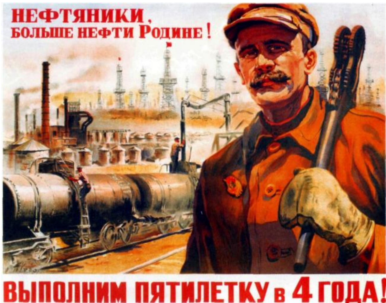
Krivosnogov, Realizziamo il piano quinquennale in quattro anni, 1948