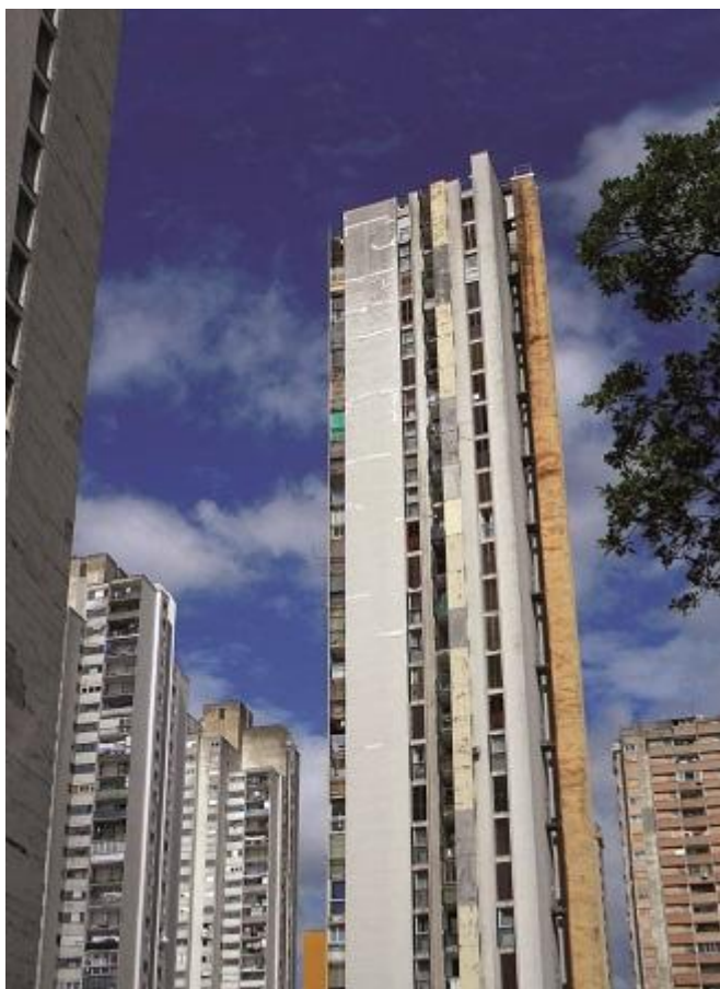
Grattacieli socialisti, Rjeka-Fiume (HR)

A sua volta però, il testo è frutto di un intreccio. Tra la descrizione delle cose visibili emerge continuamente un racconto di fatti sociali e politici, di scelte di singoli o di scelte collettive che configurano le ragioni profonde della modificazione dei paesaggi.