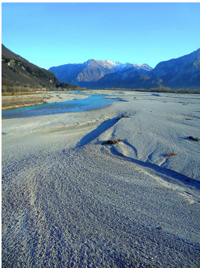
Ghiaia, Vivaro, PN

Ma “Alpe Adria senza” è anche, evidentemente, qualcosa in più. Testi scritti in un arco di tempo così ampio tradiscono una forma di raccolta di appunti personali, una sorta di diario di ossessioni e visioni private che emerge un po’ inaspettatamente.