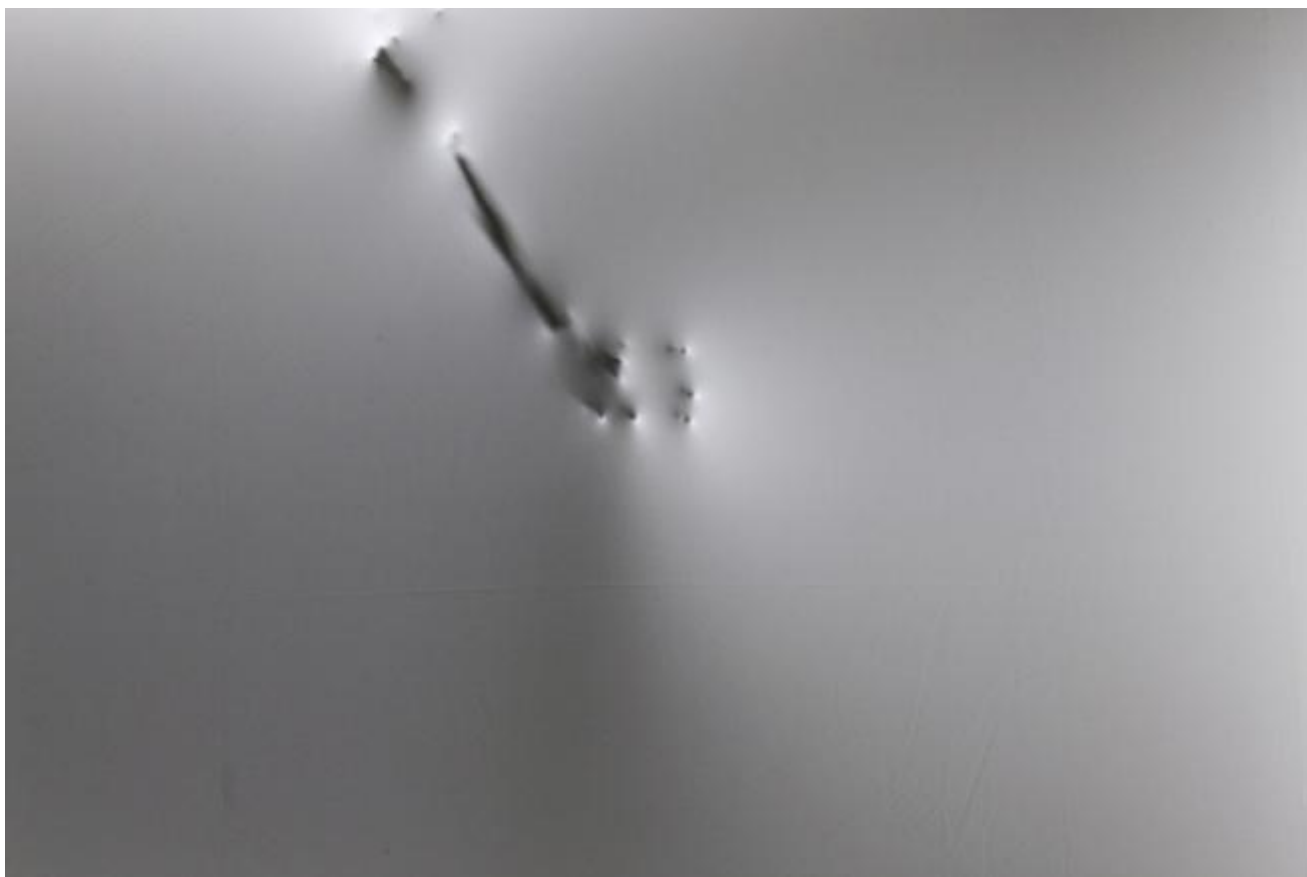
La timidezza delle ossa

Da un sottilissimo strato di tessuto bianco iniziano lentamente a emergere frammenti di strutture ossee: un polso, una mano, un braccio e poi ammassi di ossa che fanno tornare alla mente tragedie del Novecento. Una epidermide che contemporaneamente nasconde e mostra, che toglie e dà, che livella e porta in primo piano.