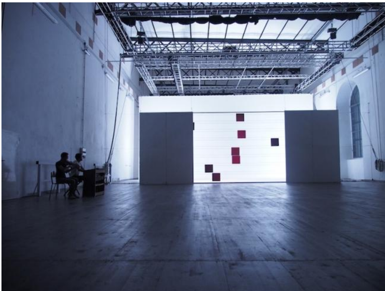
La più piccola distanza

La notizia della fine dell'esperienza di pathosformel ha aperto un dibattito anche sul Nuovo Teatro: è stato Renato Palazzi a interrogarsi sul destino dei gruppi che nell'ultimo decennio abbiamo visto nascere e intraprendere percorsi artistici ben definiti e arrivare, oggi, invece, a una fase più di assestamento e consolidamento. L'universo teatrale attuale è densamente abitato da giovani compagnie composte da trentenni e (quasi) quarantenni che si sono trovate a tracciare il loro percorso artistico in una fase di crisi economica e culturale forse senza precedenti.