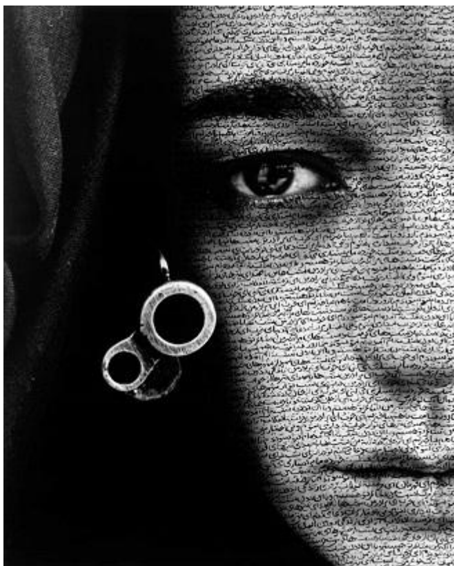
Shirin Neshat. Speechless. 1996

L'azione, va da sé, mette in conto il sacrificio ed è imparentata con la morte. Essere eroi e martiri non è cosa per tutte e per tutti, prevede ardimento e abnegazione o disperazione. L'azione militante è uno sport estremo: ci si immola solo per soldi o per sdegno, per interesse o per protesta.