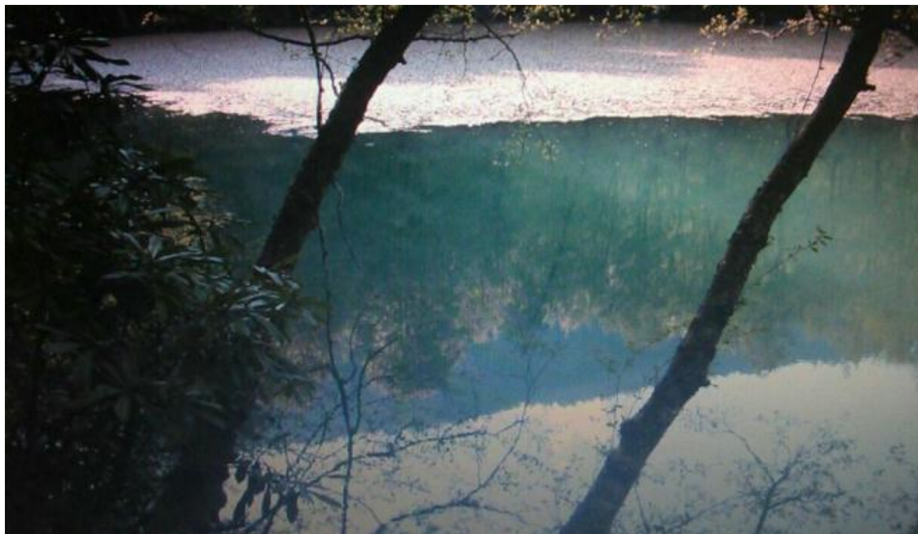
Lago nei pressi di Bel

La Via Licia è un sentiero a lunga percorrenza nel sud della Turchia. Se s'immagina la penisola anatolica come un rettangolo, bisogna prendere l'angolo in fondo a sinistra come riferimento per la partenza e un terzo del lato lungo per l'arrivo. Da Fethiye ad Antalya per la precisione, 508 chilometri con altitudini comprese tra lo zero e i duemila metri.