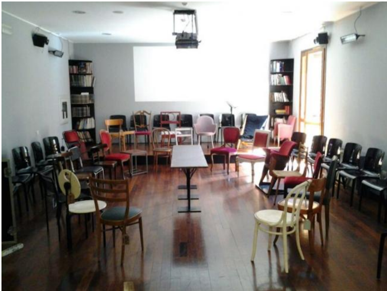
Prima dei Parlamenti

a chi le fa, a mettere il piede nelle impronte già scavate, a inventare genealogie profane per gettare ponti e avvicinare isole, a sprofondare e intanto veleggiare a pelo d'acqua. Ad applicare alla regia critica di Strehler un sottotesto gramsciano, come ha fatto Claudio Meldolesi, o a leggere Ronconi nelle pagine del Corso di linguistica generale di Saussure: per fare un esempio. A sprofondare nel Pantani delle Albe con i mezzi dell'estetica e dell'antropologia: per farne un altro.