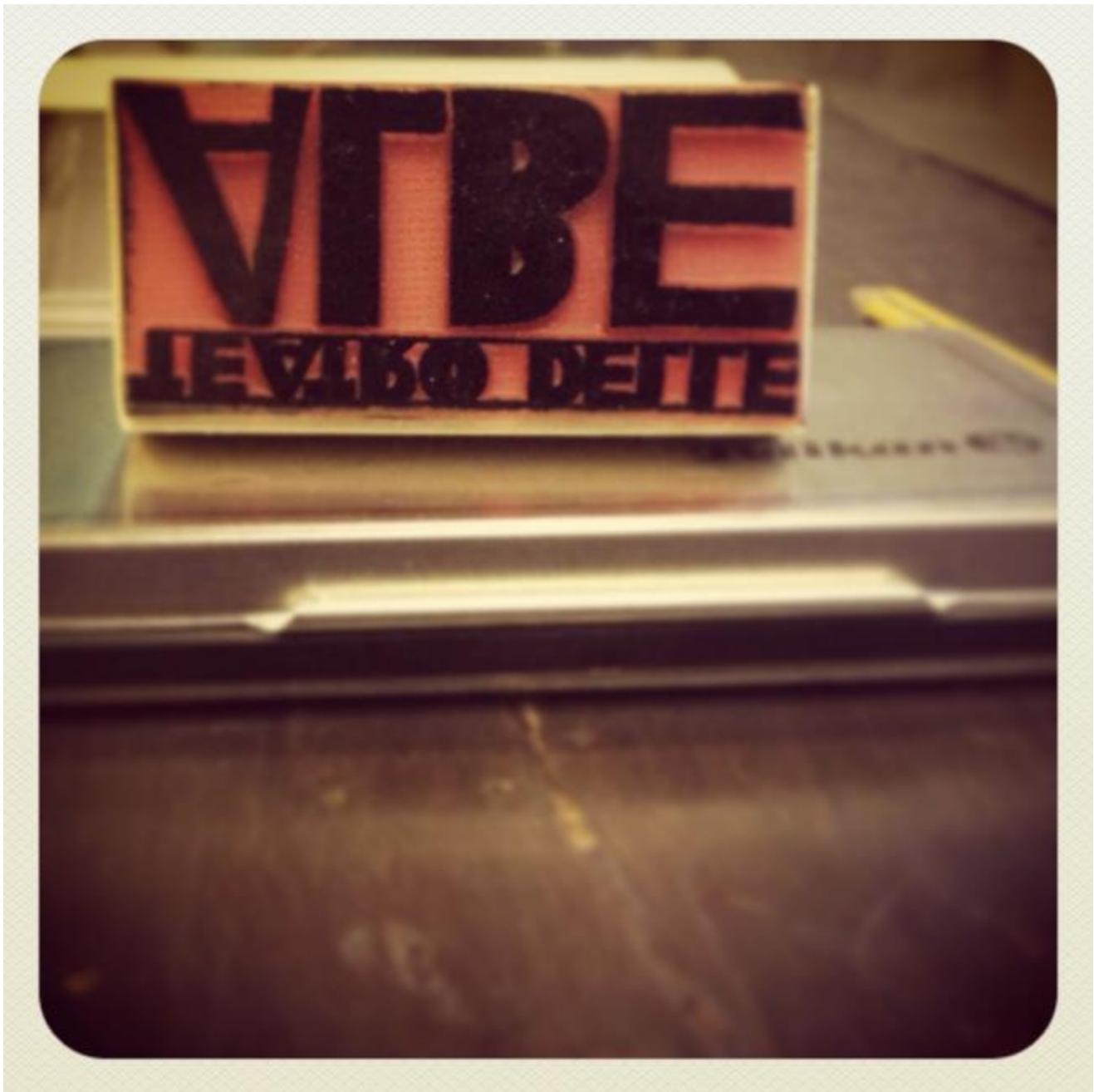
Timbro delle albe

In quella meravigliosa carrellata delle sue figure più famose, che è La Camera da ricevere , prezioso spettacolo quasi privato che Ermanna Montanari offre alla piccola comunità dei Parlamenti, troviamo Fatima, asina parlante, che si commuove di fronte all'infinito e allo stesso modo per una volgare scritta in una toilette pubblica. Nell'interstizio c'è l'arte; ovvero la nuvola. Luminosa: imprendibile e densa.