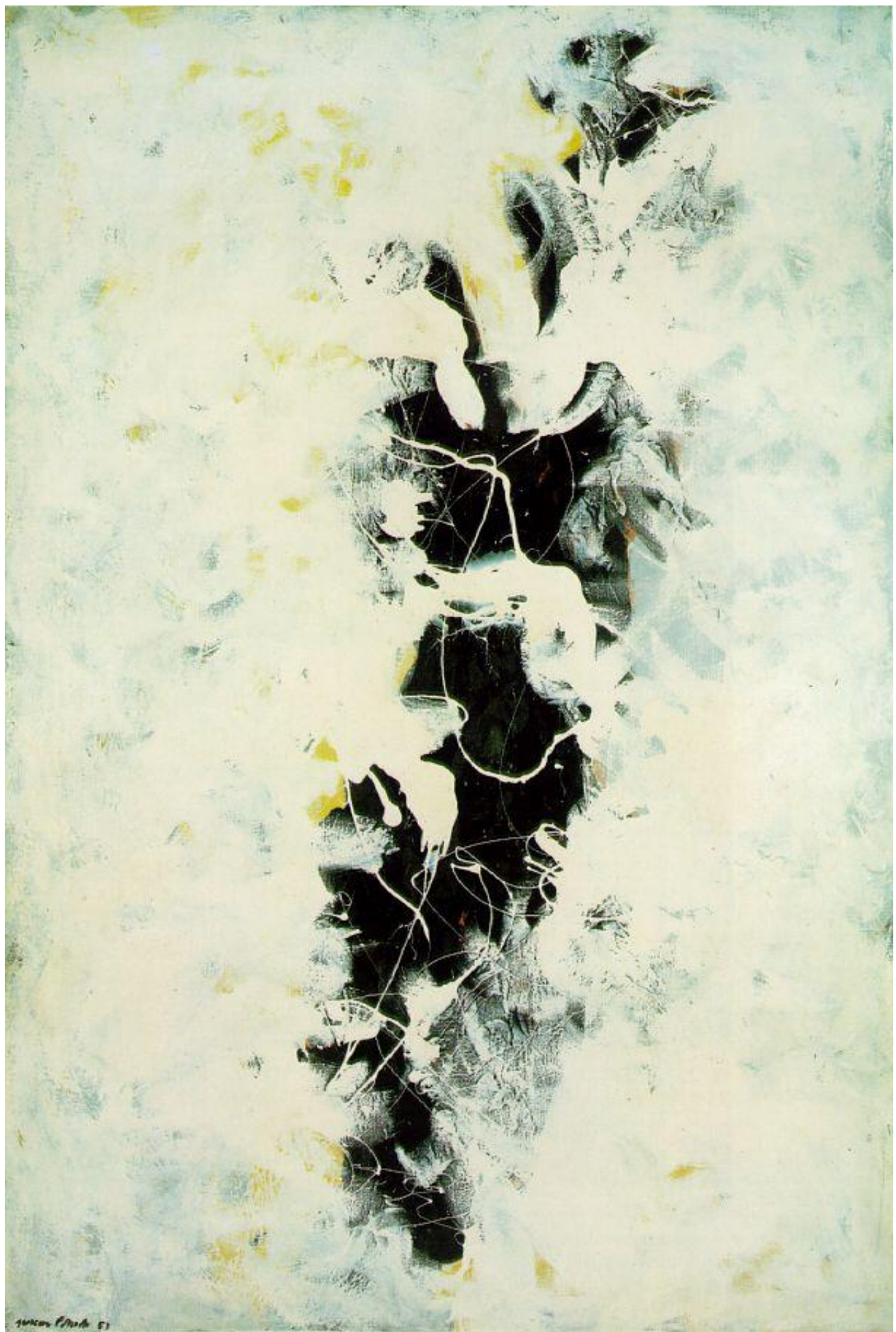
Jackson Pollock, The Deep