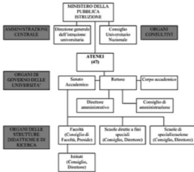
Fig. 2 – Schema dell'organizzazione del sistema universitario 1979 vs 2007

Maran, Laura, Economia e management dell'università. La governance interna tra efficienza e legittimazione. FrancoAngeli, 2009 - Business & Economics.