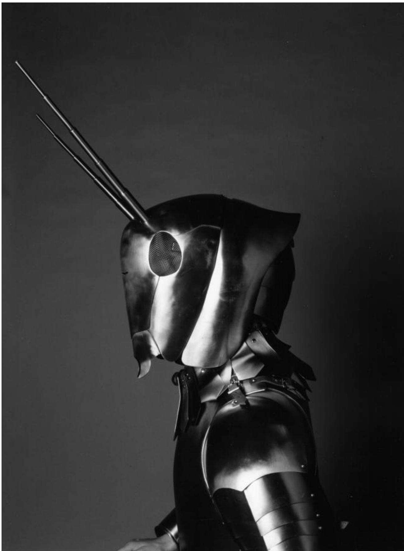
Sanguis/Mantis (2001); Lyon, Les Subsistances; © Angelos byba Foto: Malou Swinnen.

È il caso di citare, tra le altre, l'azione Sanguis/Mantis (2001), dove il riferimento è di nuovo al liquido biologico e all'insetto, la mantide religiosa, noto per divorare il maschio durante l'accoppiamento. Il capo