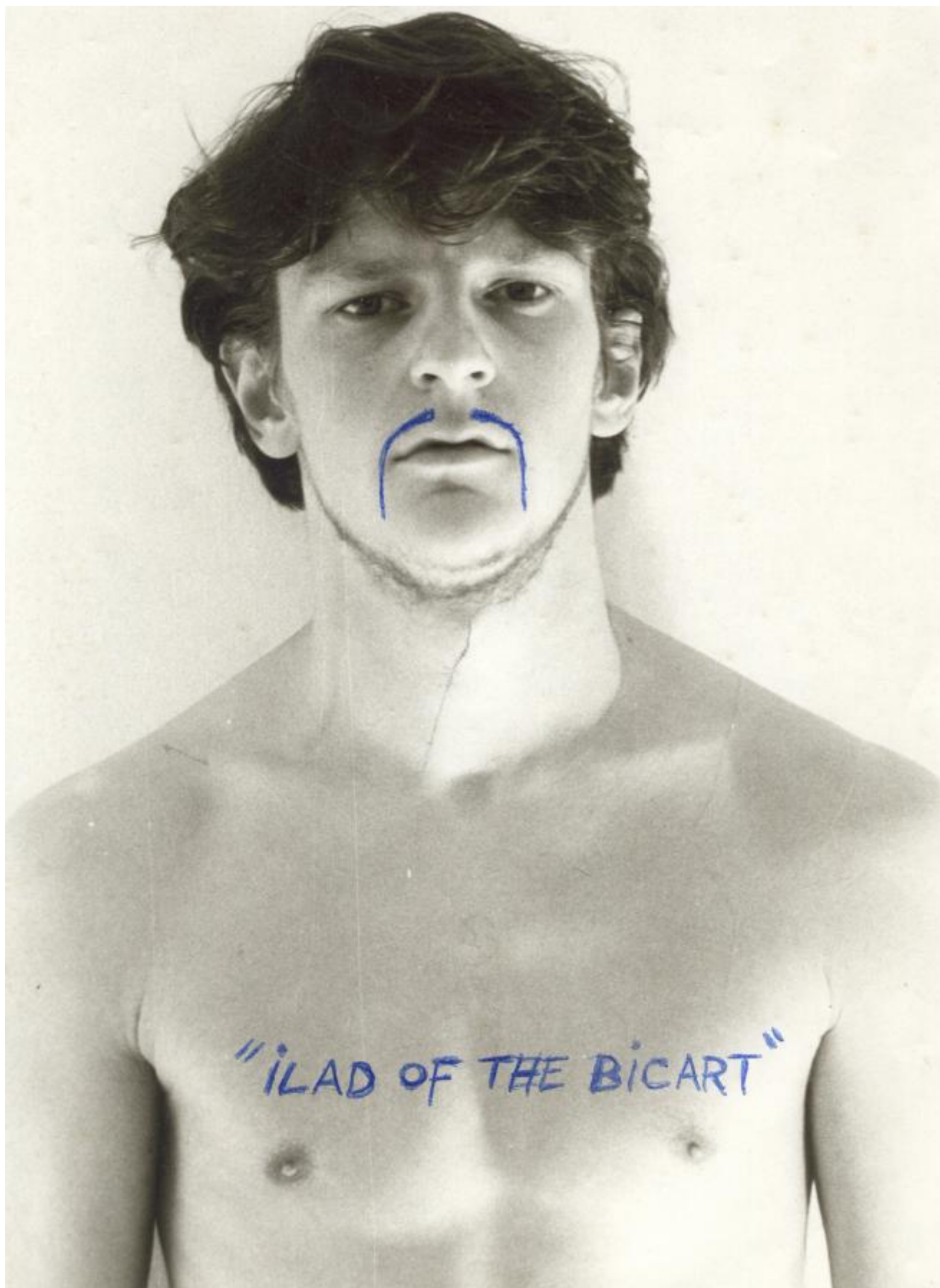
Ilad of the Bic Art (selfportrait) (1980 – 2007) Black & white photo, HB pencil, Bic ink; 18 x 24 cm; Collection Angelos byba / Jan Fabre; © Angelos byba.