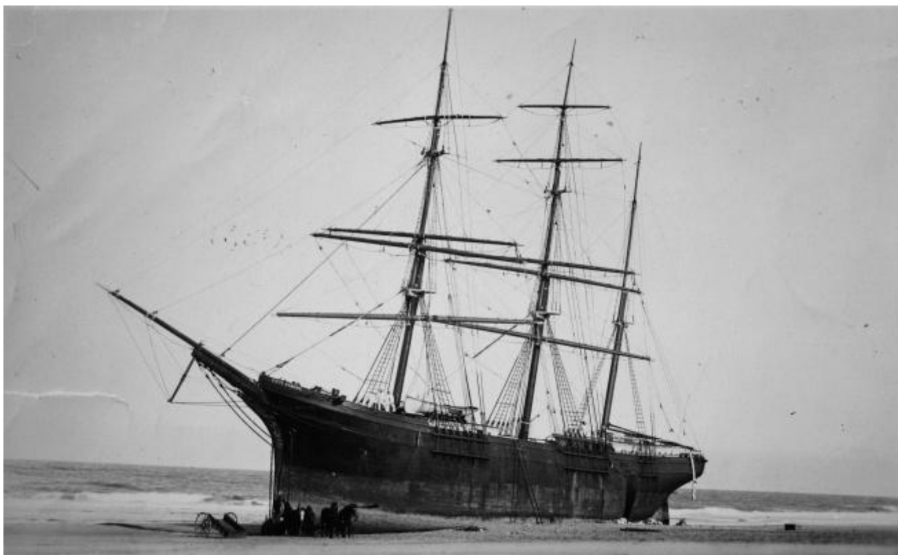
Nauset Beach, Cape Cod, 30 novembre 1892, una naufragio dopo una tempesta.

Thoreau non prova commozione. La sua descrizione di un naufragio ha la forza oggettiva di un cronista che fotografa la tragedia della vita e della morte secondo Natura; percorre la spiaggia dove sono allineati i cadaveri: «Ho visto molti piedi freddi come il marmo, e teste arruffate man mano che venivano sollevati i teli e il corpo livido, gonfio e straziato di una ragazza annegata... il relitto contorto d'un corpo umano, lacerato dagli scogli e dai pesci, al punto che s'intravedevano ossa e muscoli, eppure del tutto esangue – solo bianco e rosso – con gli occhi spalancati nel vuoto, lanterne cieche e senza luccichio: o simili agli oblò di una nave arenata, piena di sabbia».